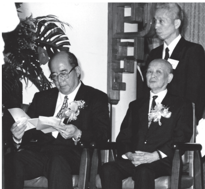
▲ 老前人與前內政部長吳伯雄先生（左）合影。

老前人為道鞠躬盡瘁，曾經他在台上講道理，台下已經準備要帶他去吊點滴了。臨終前，他沒有交代要咱做什麼，只叫咱要知其「心」、要盡其意。老前人歸空這幾年來，咱基礎忠恕運作正常，這實在是老前人的慈悲德佑。