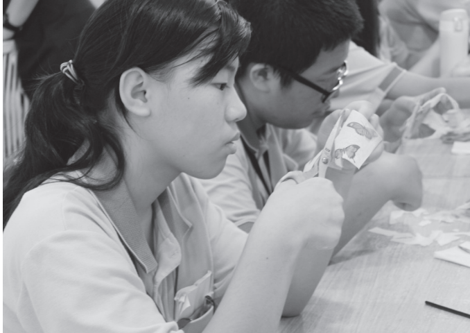
▲ 蝶古巴特 DIY 新體驗。

上一次因為有事，所以不能來參加，這次朋友再找我來參加生服營，也是我第一次參加生服營。剛開始的時候很緊張，後來我被分到勇二小隊，彼此都不太認識，經過小組討論後，就開始互相認識了。