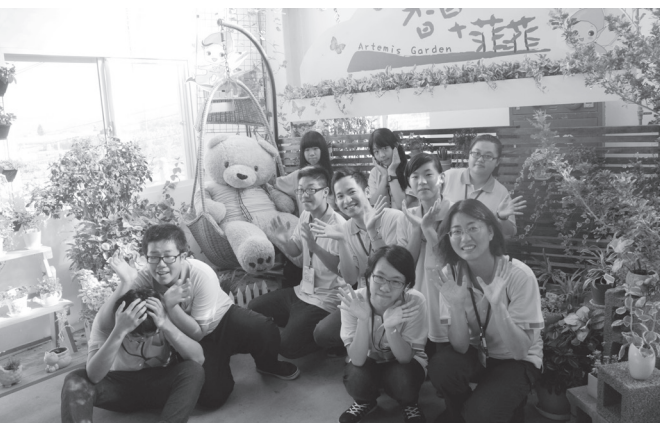
▲ 小組合影，留下美好的回憶。

第一天剛開始還覺得四天的時間有點久，但是到了第三天，卻覺得明天就要回家囉，感到有些不捨！第二天，開始有服務工作要做了，而且我們竟然洗了三天的碗，超有成就感的。服務別人，也會得到相對應的收穫，我得到了開心，雖然很累，但我還是會繼續撐下去，不會半途而廢；「有始有終，不到最後一刻不放棄」，這