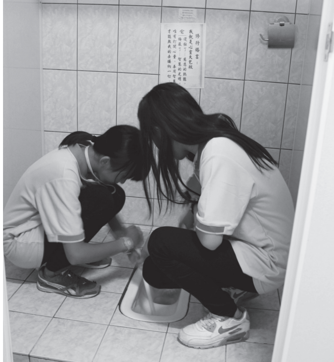
▲動手做才知道，原來洗廁所真辛苦。

這幾天的課都充滿不同的意義，聽課就有如得到了珍貴的寶藏，感謝講師們給予了我們更加成長的養分，而其他活動也都有其意義，所以真的很感謝生