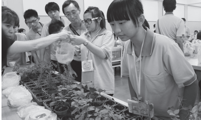
▲ 戶外體驗課程，認識各類的香草植物。

的啦！原本期待今年的營火晚會，結果沒有！不過沒有關係，有玩到好玩的「地遊」（大型桌遊體驗課），體會到人要心存善念啊！還有隨緣的重要，生命真的很奇妙，不能有走走停停的時刻，只能一直往前，遇見各種狀況還需要用智慧去選擇，原來人生也如「地遊」充滿各種坎坷啊，哈！