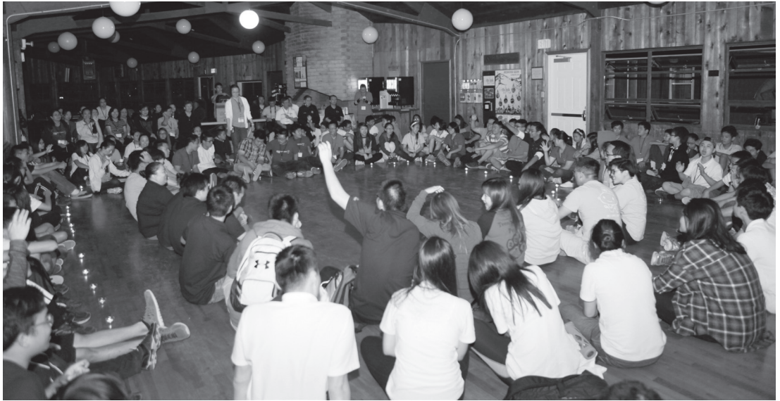
▲ 感性的星光夜語時間。

Besides lectures, we had many group activities to give us hands-on experience and “lessons”. For instance, we played a game where we would call out our parents’ name and they would rush out to help us even though they were busy with their own work. This filial piety activity showed us how hard-working our parents are and how we have to appreciate all the time they dedicate to us. Another game out of many that we played was where we would take items on the ground and create works of art. This made us think about all the trash, waste and dead organic materials that were located on the ground. Although the art was quite beautiful, it was quite sad to see what the world would become if we didn’t take care of it. Using these group activities, we were able to bond with our group and enhance our understanding of the lessons being taught.