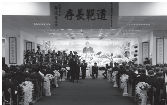
▲公奠禮中，詩歌禮讚緬懷袁前人德澤。