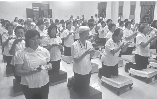
▲ 道親們虔誠地向 老中及諸天仙佛獻燈祈福。

為了圓滿 2 月 13 日法會早上 9 點開始的獻供、燒香和叩求禮，後學在當天 8 點 30 分集合 9 位印尼和台灣的年輕學長演練獻供禮，並以印尼學長為主，台灣學長為輔進行。由於雙方學長都已具有禮節基礎，故這次的練習是為了培養彼此的默契與動作的一