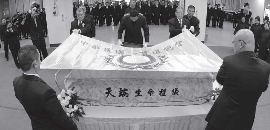
▲袁前人公奠禮，覆蓋中華民國一貫道總會會旗。