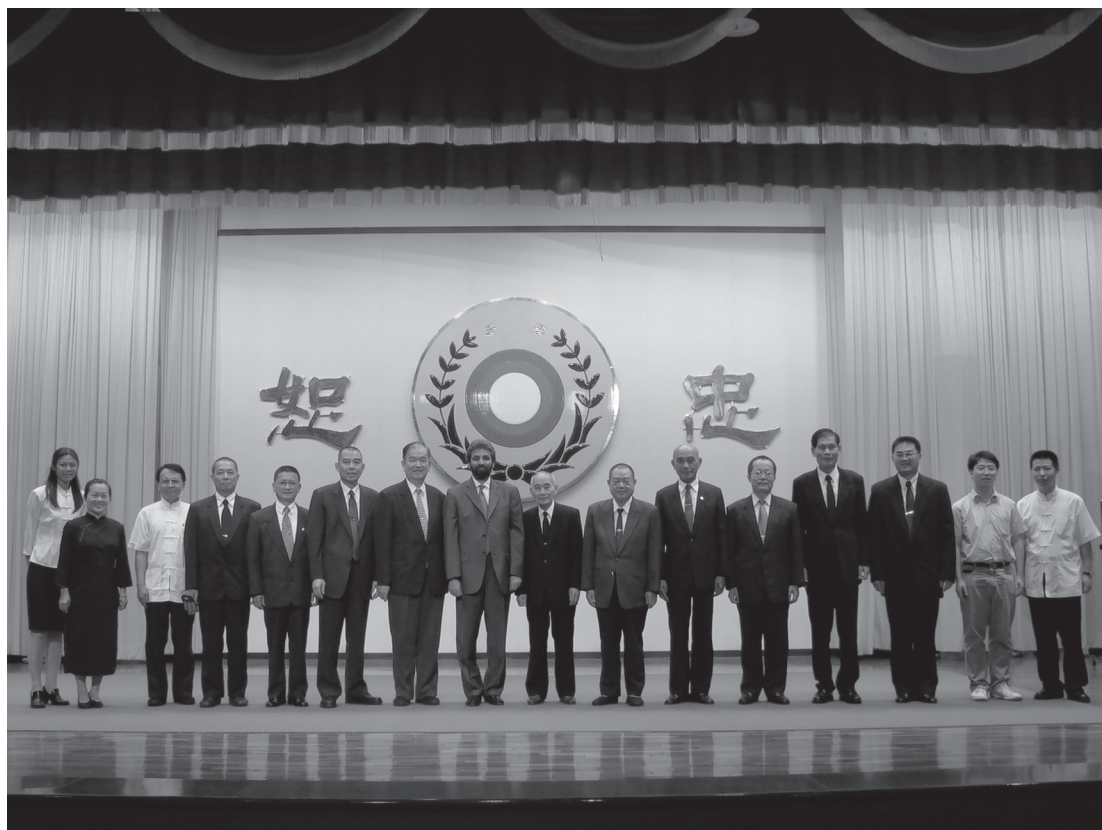
▲ 聯合國世界宗教和平組織秘書長巴瓦金先生訪忠恕道院時合影留念。

如是耐煩耐勞、克己為人的前人輩修辦道精神，可說是道場最大的福分，也是永恆的典範。