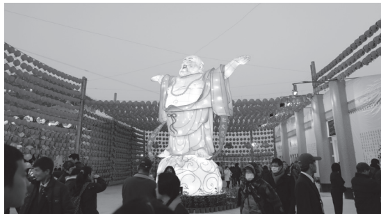
▲彌勒祖師主燈與民眾廣結善緣。