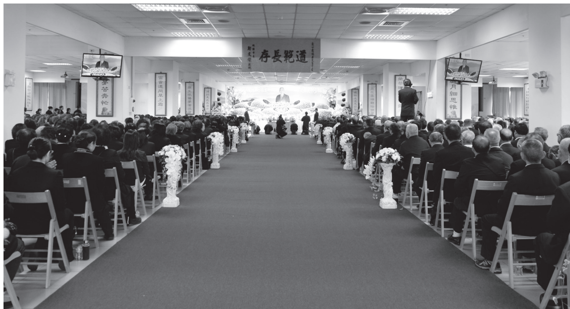
▲ 莊嚴會場中，各道場代表前來參與公奠禮。

一貫大道的修持方向就是儒家思想，一貫道的名稱是從哪裡來的呢？孔子說：『吾道一以貫之。』《論語·里仁》一，代表先天的根源，就是大道，請問人身上的本性是從哪裡來的？是 上天老中賦性在人的身上，這本性是生化化之根源，沒有了祂，身體不會自己呼吸，生命也就不存在了。而孔聖人所傳心法就是：『吾道