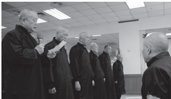
▲陳前人率道務管理委員會於袁前人家奠禮致奠。