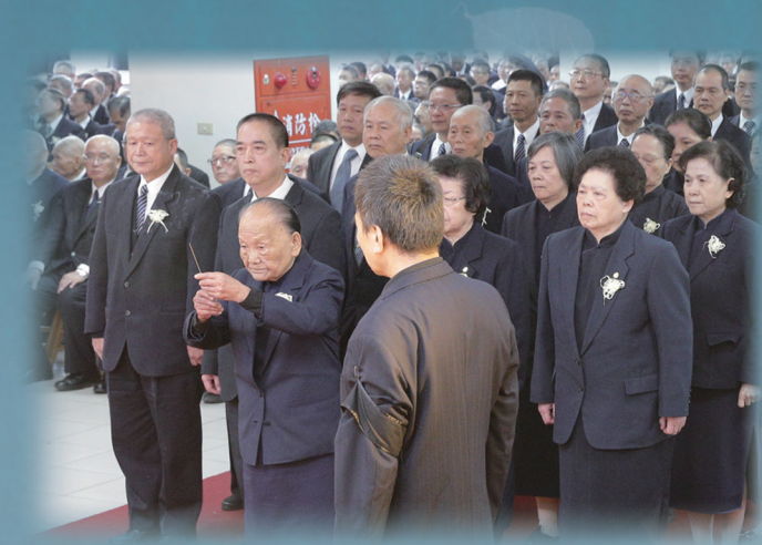
▲ 基礎天基張粉前人率領公奠。