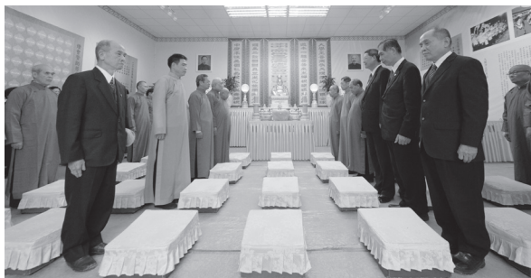
▲台灣燈會一貫道燈區臨時中堂開壇。