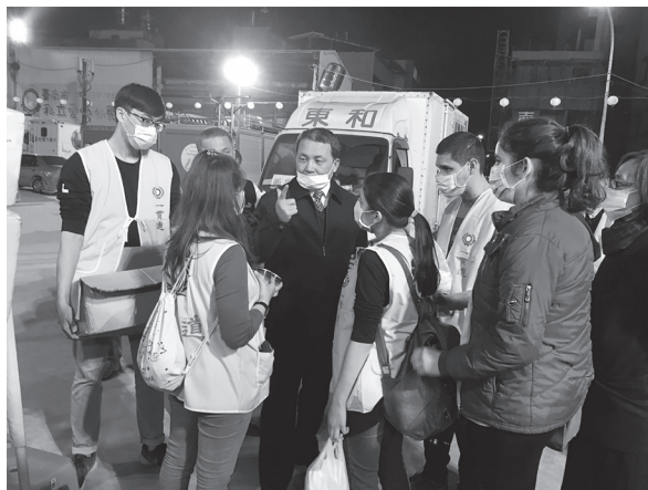
▲ 志工來自不同道場，發揮了人飢己飢，人溺己溺，四海一家的精神。

感謝 天恩師德、祖師鴻慈，今年（2016）在 2 月 6 日凌晨 3 點 57 分