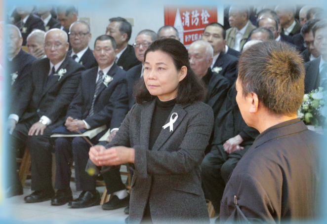
▲ 前立委楊麗環女士公奠。