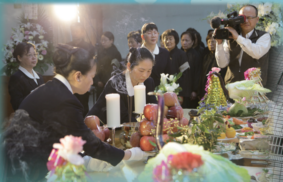
▲ 誠敬莊嚴獻花、獻果。