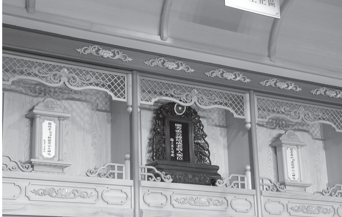
▲老前人與袁前人聖靈長佑基礎忠恕道場。

96 春秋，奉獻道場 70 載。25 歲求得大道參班清口當愿，26 歲離家捨業發愿來臺開荒，化轉一己之幸、一家之福，圓成無緣大慈、同體大愛之神聖使命。27 歲領命點傳，追隨張老前人開闡道務，以身示道，老實修行，全命以之，大德敦化；內德外行兼備，身教言教具足；成全後學無數，弘展道務多國。善繼善述張老前人所創之基礎忠恕道場慧命傳承，參贊護持中華民國一貫道總會暨各國總會不遺餘力；接任一貫道世界總會理事長，大公為懷，與人為善，實為道場典範、會務楷模。綜觀袁前人平生示現，實是古聖先賢乘愿而來，亦是承先啟後，為天地立心，為生民立命，為往聖繼絕學，為萬世開太平的最佳實踐者之一。中華民國一貫道總會暨一貫道世界總會為敬佩及感念袁前人終身之聖功德範，謹頒會旗各一面，做為永恆