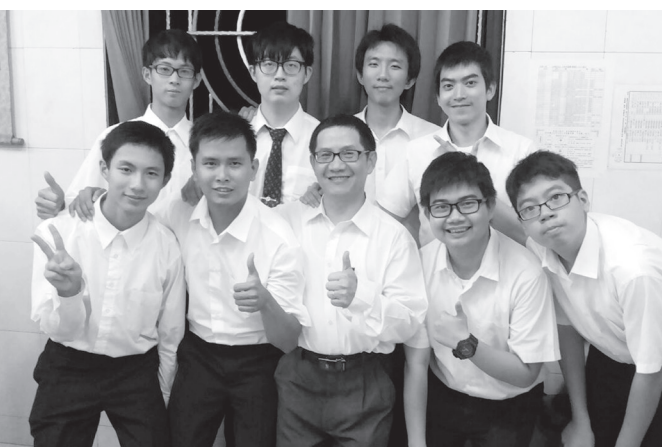
▲ 印尼與台灣的青年學長共同擔任獻供、燒香和叩求執禮人員。

坤雙方學長相互行禮告別後，祈福活動順利圓滿結束，印尼道親們都懷著法喜充滿的心情滿載而歸。