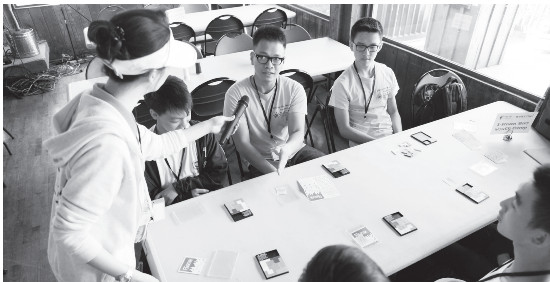
▲ 從體驗活動中了解志工使命。

除了聽課外，我們透過許多小組活動去實踐課堂上所學，從中實際體會。例如，我們玩了一個遊戲，當我們呼叫我們的父母，他們就算手中的事情忙不過來，依然會馬上衝過來幫助我們；這個孝道體驗活動讓我們知道，父母們是多麼地竭盡心力在疼愛與照顧我們，而我們應當感激他們在我們身上花費的所有時間。我們還玩了非常多遊戲，其中一個是撿起地上的物品並創作出藝術作品，這個遊戲讓我們想到地上所有的垃圾、廢棄物以及死掉的有機生物；雖然這些藝術品都很漂亮，但是如果我們不關照這個世界，它將變成我們不想要看到的樣子。透過這些團體活動，我們小組可以團結一心，也讓我們對所聽的課程有更深入的了解。