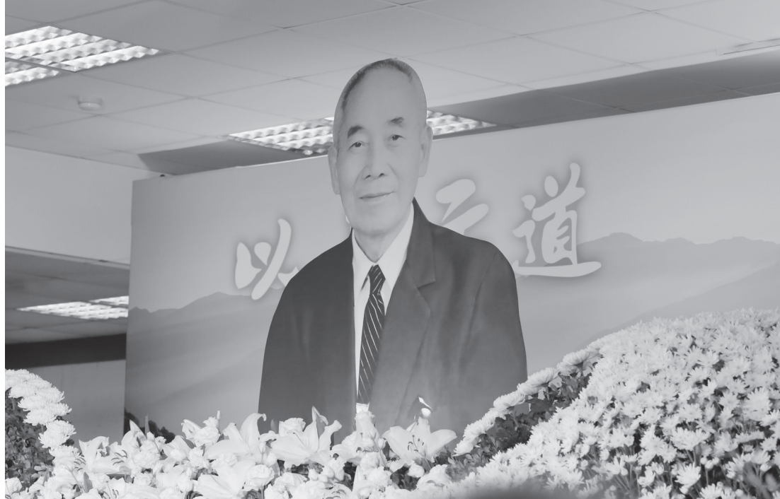
▲ 前人德行風範，永留後學心中。