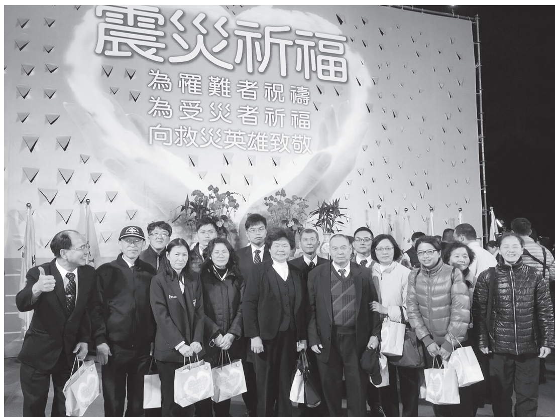
▲ 震災祈福晚會，為罹難者祝禱，為受災者祈福，向救災英雄致敬。

救災英雄致敬！因為大家同心協力地幫忙，把災難減到最低。祈福現場有超過 2,000 位的道親，大家不畏天氣的寒冷，齊誦《彌勒救苦真經》，手拿祈福燈，希望能為往生者祝禱，希望往生者都能通往安詳的地方。後學參加了這次祈福晚會，瞭解了人間有愛，人間就是理天的淨土；每個人都有一座小中堂，每個人都需要把愛傳出去，讓更多還在受苦的人，都能回到理天的淨土，回到 老中娘的身邊。