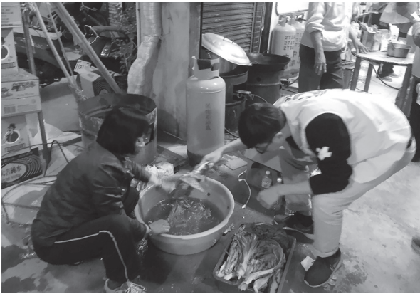
▲ 災區缺水，洗菜的水不能浪費，盡量充份利用。