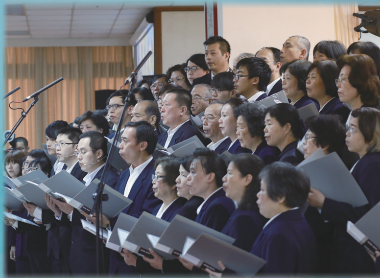
▲ 詩歌禮讚緬懷前人恩德。