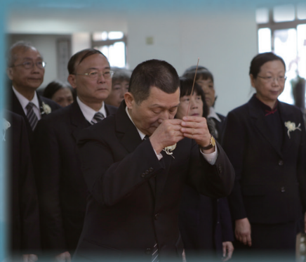
△ (左)安東道場謝德祥前人率領公奠。(中)寶光元德唐和勇領導前人率領公奠。