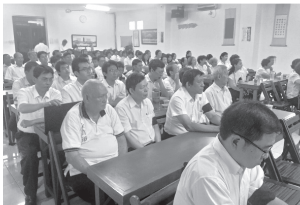
▲ 道親們專注聆聽法語。

獻供完畢後，接著點燈祈福，乾道點燈由許點傳師引領，而坤道則由蘇點傳師接續，不僅點燃手裡的一盞明燈，也同時點亮了自己的心燈。虔心跪在明明上帝蓮下，各自表明心願事。祈福完後，由學長將手中的明燈與祈福卡放在中堂兩側，讓每個人的願望能通達上天，祈求未來的一年中如願實行。在乾