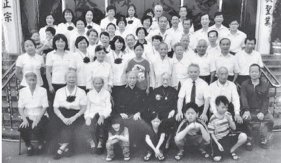
▲ 德性感化，道親們深深緬懷領導點傳師恩德。