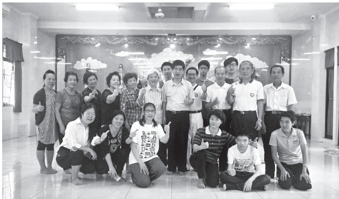
▲ 台灣團隊在雅加達全真道院和許點傳師合影。

大道普傳是不分國籍、不分種族，我們都是一師之徒、一中之子，不分彼此；而對於道中之學、修、講、辦、行，更要好好地修持精進，成為一位稱職的壇辦人員。最後，再次感謝參與法會的所有學長，感恩！