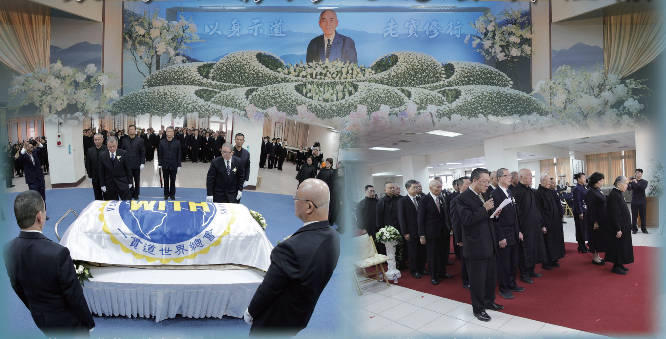
△ 覆蓋一貫道世界總會會旗。