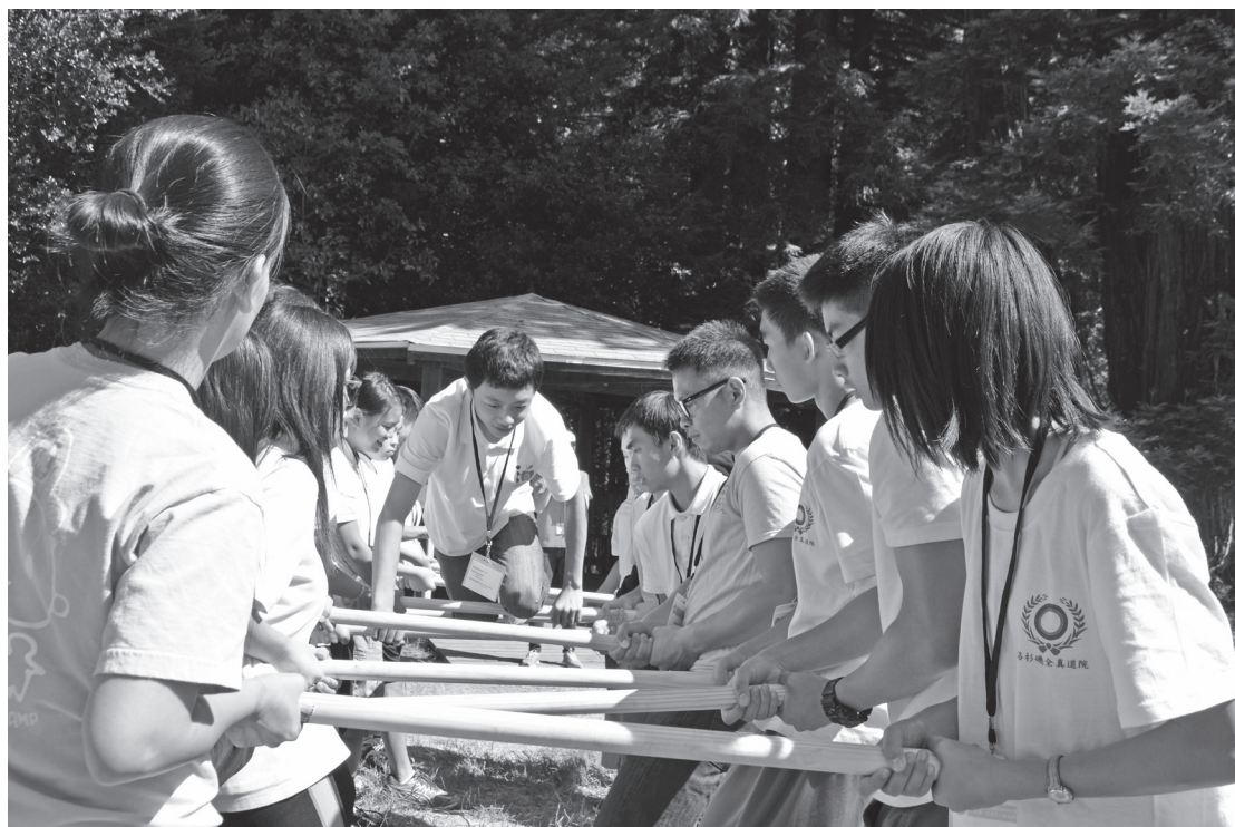
▲ 孝道體驗活動「I got you!」，使我們理解信任的重要。