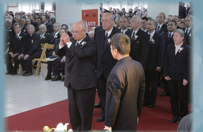
△ 寶光玉山王寶宗前人率領公奠。