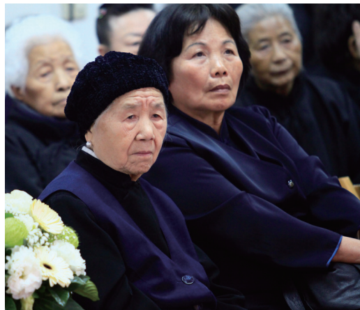
▲ 願前人對張老前人的德澤滿懷感念。

候，年少不懂；現在我才發覺我們老師真的好慈悲，要派任天才，一定要12歲。因為人在童年時，腦子裡什麼都沒有，你叫他一就一、叫他二就二，很簡單。念頭停、一心專念，你的心就定下來，「定」中方才生智慧。