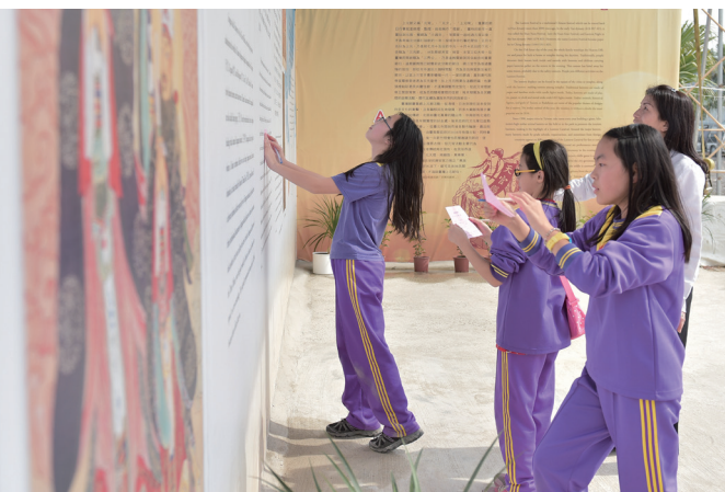
▲ 尋寶活動，找出答案可以得到造型氣球。