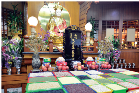
▲ 恭請先天寶塔先賢靈位，虔敬祭拜。