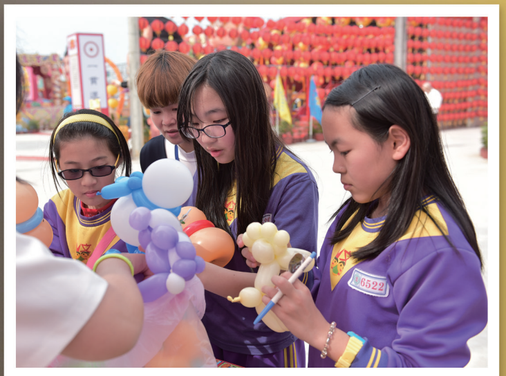
▲ 尋寶活動的氣球獎品最受歡迎。