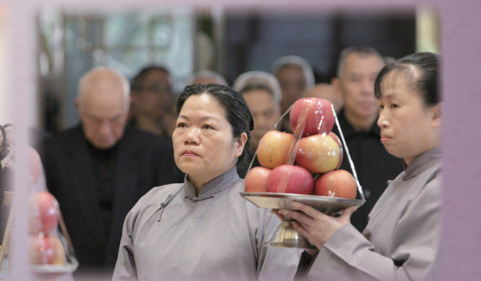
▲ 家奠禮之前於中堂獻供。