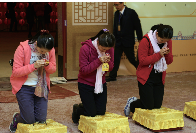
▲ 誠心跪於佛前，祈福點燈。

礎忠恕、基礎天基、發一崇德、寶光元德、寶光建德、寶光玉山、寶光崇正、寶光紹興、浩然浩德、浩然育德、興毅、安東、常州等 13 個道場協辦，大家出錢出力，不遺餘力。