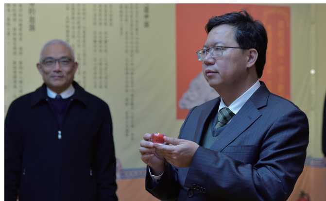
▲ 桃園市鄭文燦市長至一貫道燈區點燈祈福。

以上粗略的紀錄，謹提供總會及諸位前賢分享；不成熟的建言，也僅供參考。衷心預祝 2017 台灣燈會在雲林的一貫道燈區成果比往年更豐碩！