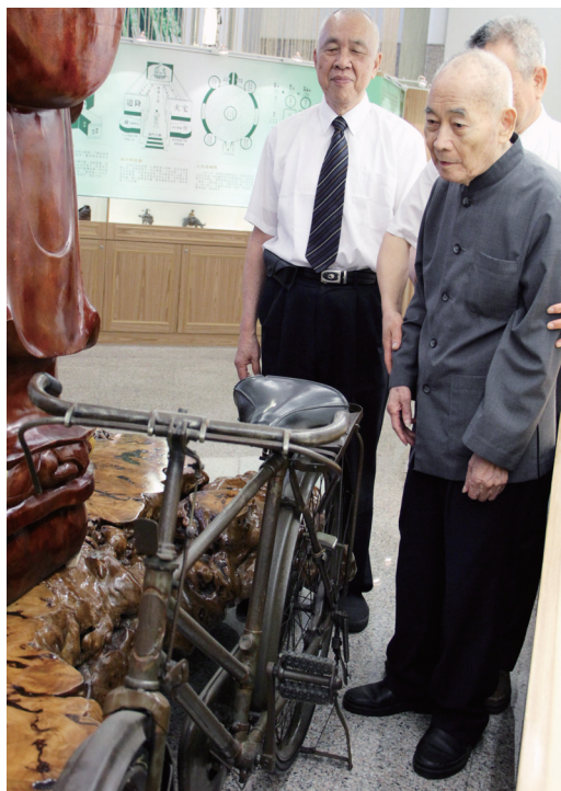
▲ 天庭道院保有袁前人使用過的自行車。

袁前人的生活十分節儉，「惜福」不只是講臺上的道理，還具體實踐在日常生活中；家裡的家具都是二手貨、壞了也是一修再修；屋子一有損壞，便自己充當木匠、泥水匠開始進行修復；竭盡所能地省電、省水之外，日曆紙、廣告傳單的背面也成為前人抄筆記、寫草稿的便條紙；在政府尚未宣導之前，早已重複使用塑膠袋。衣服、鞋子常常穿到破還捨不得換，甚至還幽默地自我解嘲：「來看看老師的鞋兒破、帽兒破、身上的袈裟破！」即便自己是個超級「省長」，但是對道場所需的財物、資源，卻絲毫不會吝嗇。