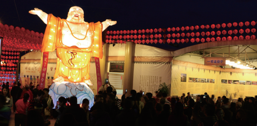
▲ 2016台灣燈會，彌勒祖師與民眾歡喜結緣。