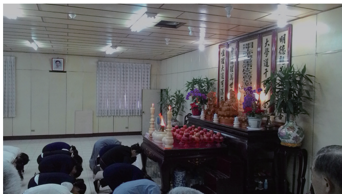
▲ 白阿美點傳師慈悲率領班員開班叩求。