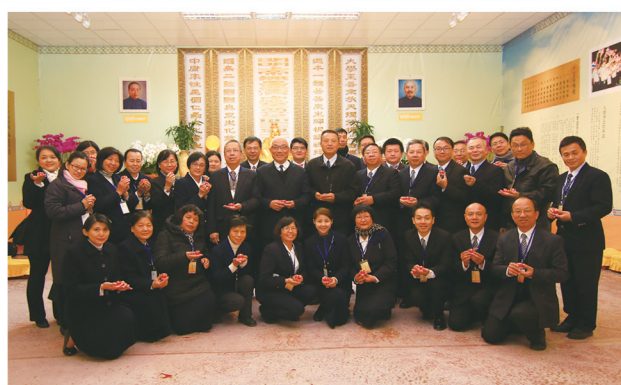
▲ ▶ 點傳師與服務志工歡喜合影。