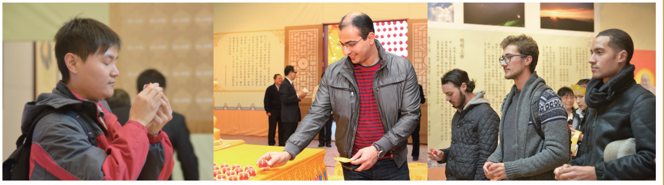
▲ 民眾絡繹不絕點燈祈求平安。