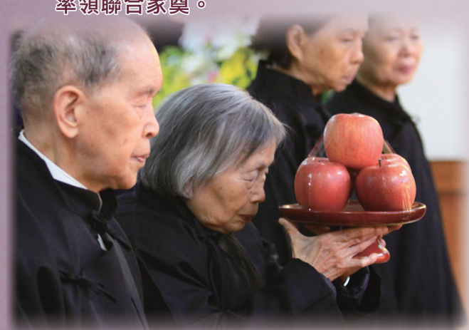
▲ 啟化單位游李領導點傳師率領家奠。