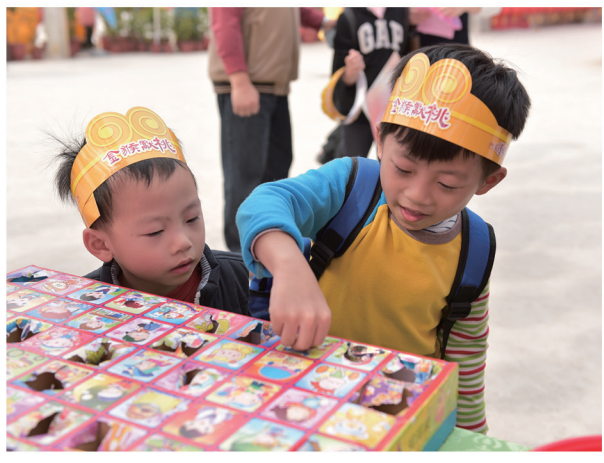
▲ 小朋友最愛戳戳樂。