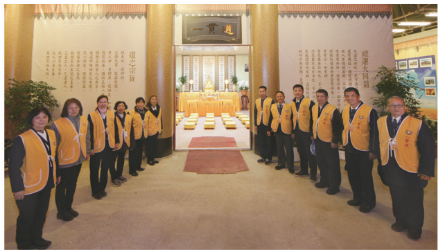
▲ 服務志工熱情迎賓。