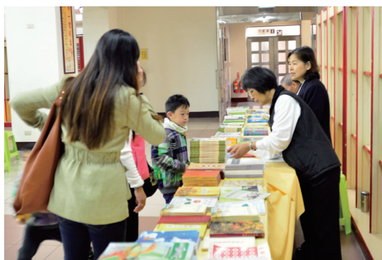
▲ 善書與雜誌贈閱，與大家結緣。