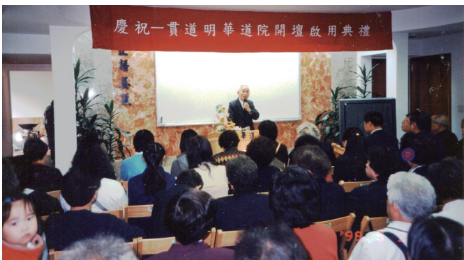
▲ 2000 年赴加拿大主持明華道院開壇。