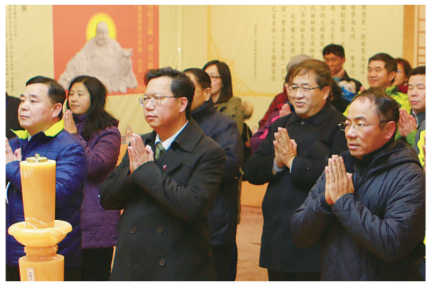
▲ 桃園市鄭文燦市長蒞臨一貫道燈區。