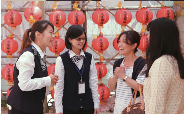
▲ 志工親切地為民眾導覽。