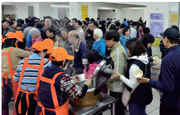
▲ 每日由各輪值單位提供平安齋。