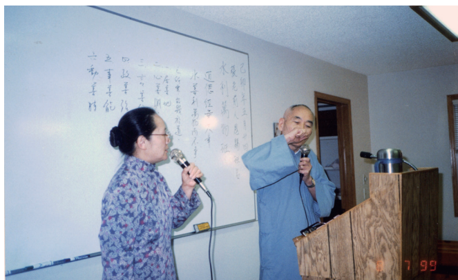
▲ 1999 年巡視歐洲道場，講述《道德經》第 8 章。

懇切地提醒大家不要被世間五欲之樂所迷惑。基礎忠恕全體後學唯有秉承前人「承繼張老前人修辦心願，落實真修實辦，合德同心，永續道脈，直到千秋萬世」的心願，繼志述事，示現一貫真傳、基礎家風，方能無愧於天恩師德，而報答前人恩澤於萬一。