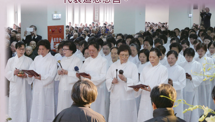
▲ 誠敬唱誦《彌勒救苦真經》。