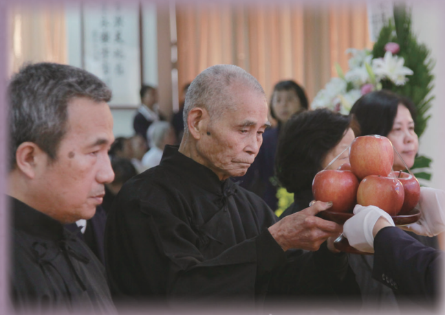
▲ 瑞周天達單位王老和領導點傳師率領家奠。