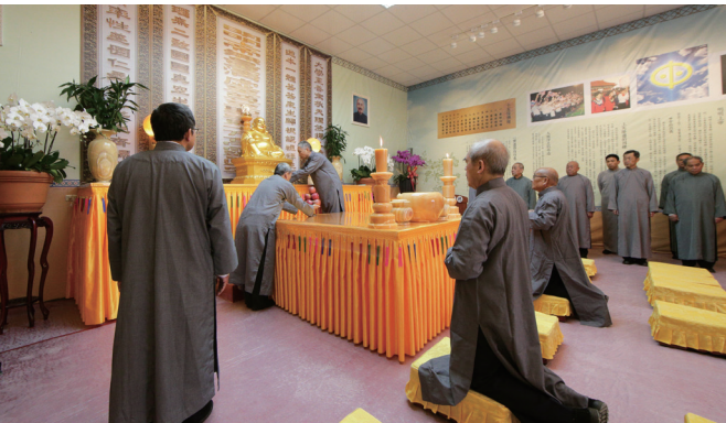
▲ 臨時中堂開壇，虔敬獻供。

千頭萬緒，驚險萬分。由於市府招標延遲，加上過年前有好長的一段日子持續下雨，眼看年關將屆，惟宗教祈福區仍是一片泥濘黃土，整地工程難以進行，連帶著各宗教燈區也受到影響，進度嚴重落後。