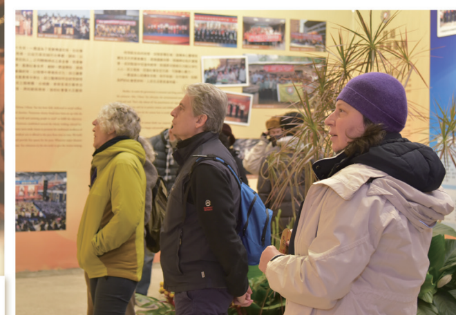
▲ 民眾透過展場圖文了解一貫道。