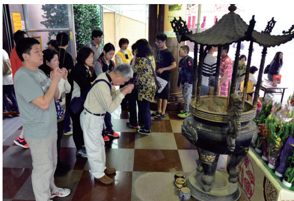
▲ 道親及寶眷依照不同梯次前來祭拜。