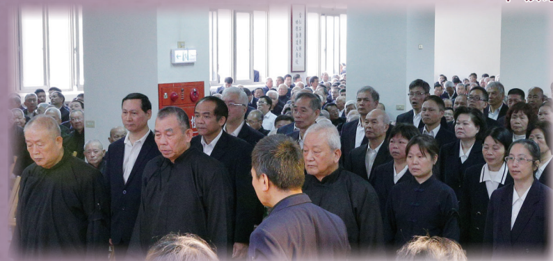
▲ 忠恕學院高級部及忠恕道院職志工聯合家奠。