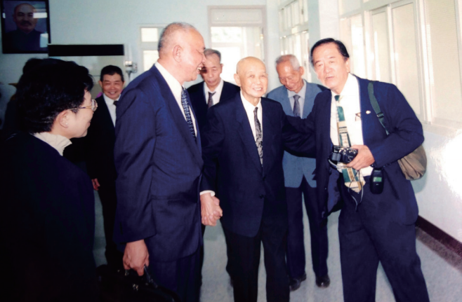
▲ 老前人、黃領導點傳師與張先生於天庭道院留影。

也鼓勵大眾多吃素食，並藉機看是否有緣度人求道。由於世居萬華龍山寺西昌街，這裡攤販雲集，人來人往，熱鬧非凡，開了這間餐廳，後學太太如魚得水般認識了好多人，度了不少街坊鄰里，也度了許多來用餐的客人，廣結善緣，這都是深受老前人「以身示道，老實修行」的德行感召。