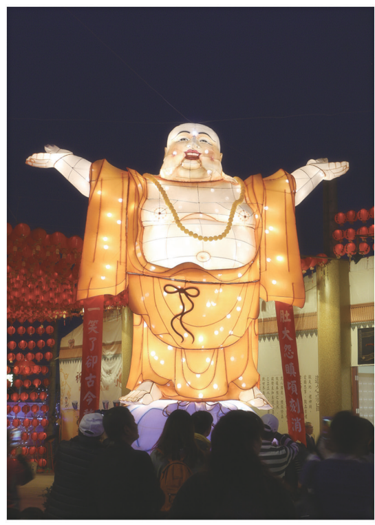
▲ 彌勒祖師廣迎眾生，歡喜結緣。