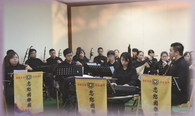
▲ 忠恕國樂團莊嚴奏樂。