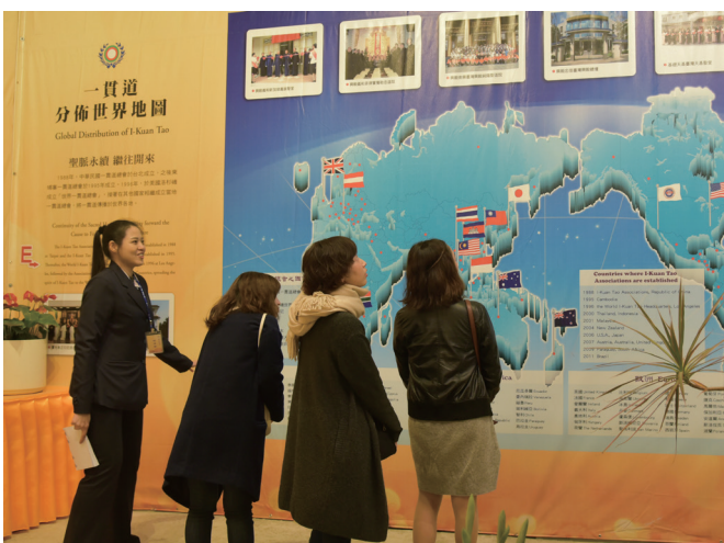
▲ 藉由文化走廊的簡介，讓民眾更了解一貫道。

位道親的名字從閻王的生死簿上勾除，然後登錄在天籍當中。等到有一天，這位道親歸空（逝世）了，靈性回到天上時，也要核對天籍，驗三寶。