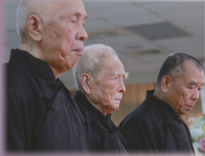
▲ 陳前人率道務管理委員會致奠。