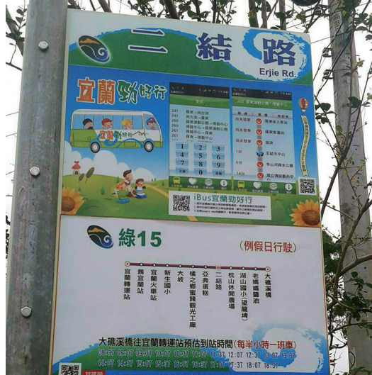
▲ 綠 15 號公車二結路站可抵達天庭道院。

天庭道院落成前後，張先生曾詢問老前人：「道院為何要蓋在既偏遠、人跡又少的地方？」老前人回答說：「放心！將來定有直通道路，由台北出發，一個鐘頭就可到達這裡，同時這邊也會成為一貫道村。」果不其然，雪山隧道通了，忠恕會館於去年