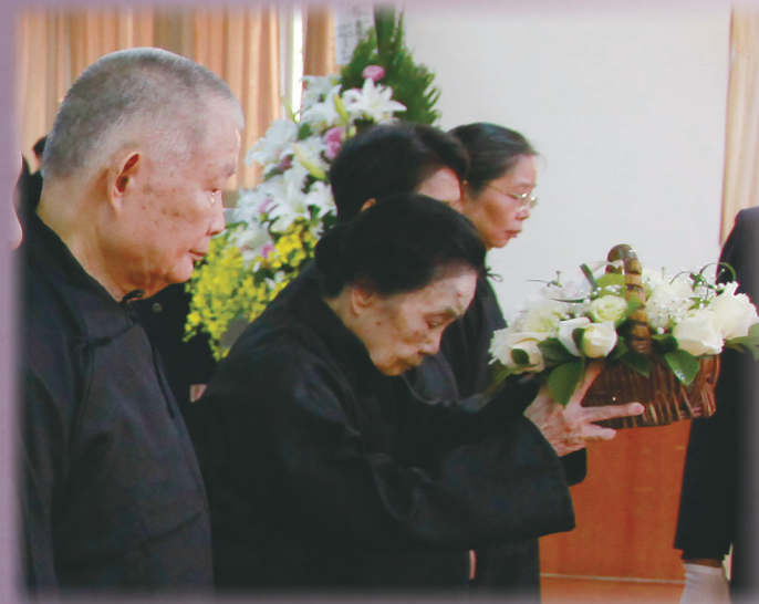
▲ 瑞周天定單位藍琴領導點傳師率領家奠。