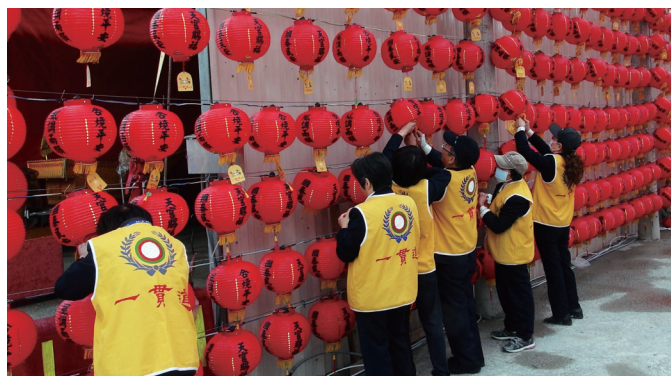
▲ 平安燈下一一掛上贊助者的吊卡。

彌勒祖師以「大肚能容」和「滿腔歡喜」的親和特質，與眾生結緣，引導眾生；而儒家修行的特質乃「落