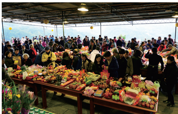
▲ 敬備各式供品，聊表祭祖心意。