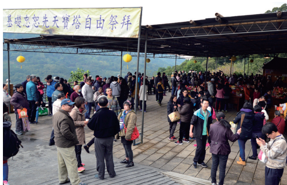
▲ 飲水思源，緬懷先祖與前賢恩德。