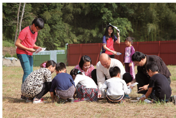
▲ 家長與小朋友一同參與戶外親子活動。