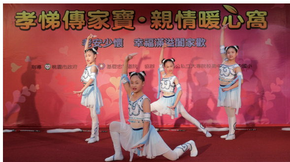
▲ 長庚國小舞蹈社於孝悌楷模表揚大會中精采呈現。