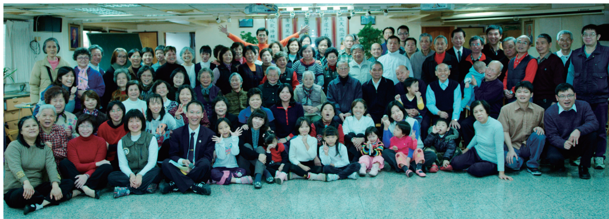
▲ 楊梅點傳師（中）與點傳師及道親們歡喜合影。

繁華落盡，人生終有落幕的時刻，看著追思會場中您的笑顏一如往昔，心中告訴自己：今天是您成道歸位的好日子，走過坎坷的人生，畫出圓滿的修辦路，您，是我們的典範，您的懿德行止清楚烙印在每一位曾被您慈光照護過的人心中；而被這份慈光提攜過的我們，當要將您與前人輩們的道範德光承繼傳揚給更多的同修與眾生！感恩有您～