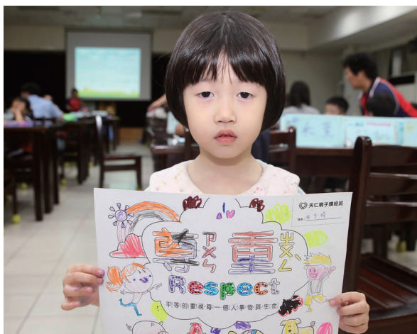
▲ 讀經班小朋友彩繪塗鴉，畫「尊重」。