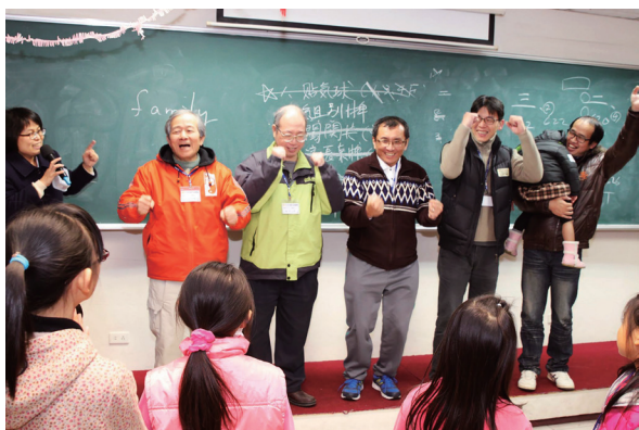
▲ 台上，家長齊聲歡呼：好極了！YA！