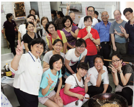
▲ 讀經家長班烹飪教學。

這樣有意義的親子教育課程，不分地域，只要願意每週花 1 小時時間給小朋友的爸爸、媽媽們，都可以參加喔！你讓孩子學數學、學外文，但是你讓他們學習如何培養良好的公民品德了嗎？這個地方可以免費學習！各位鄉親千萬不要錯過噢！（以上引用 FB 社團竹南大小事小小主編風雨無阻也要讀好書報導）