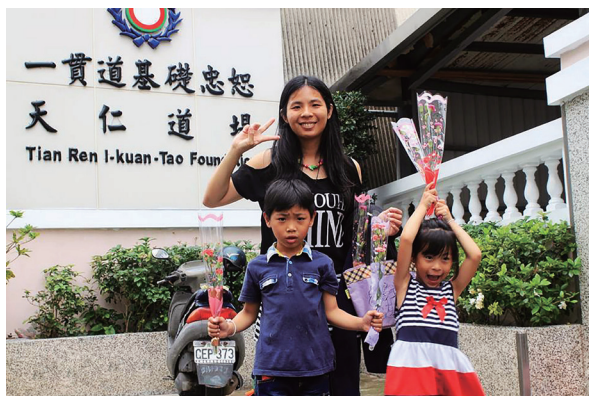
▲ 母親節慶祝活動後，親子開心合影。

為主，言教輔助，因此每月也有一次「家長班」與「小朋友班」分班，各自進行心靈成長課程，「家長班」透過互動體驗及影片討論等方式，學習正確的教育方法與態度。