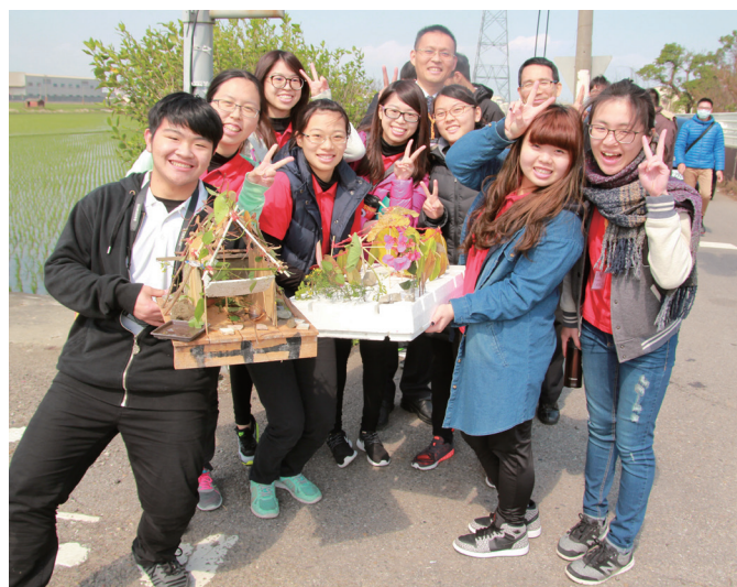
▲ 各小組合作無間，白手起「家」。

回到講堂，各組安頓好自己辛苦蓋成的「小中堂」，立即回位就坐，準備聆聽張講師講授的「關鍵下一秒」。無常人生，不可預測，尤其如今已到末世，善惡報應加速，因此，生如何修？死何處去？是修道人一定得明瞭的。透過張講師生動的譬喻及解說，後學們明白：原來人有三魂，分別是生魂、覺魂和靈魂，也就是身、心、性。而三寶正是用以導正自己的性、心、身。世上萬象常使我們的心