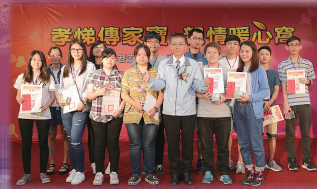
▲ 桃園市教育局林威志副局長頒獎給大專組及高中組同學。