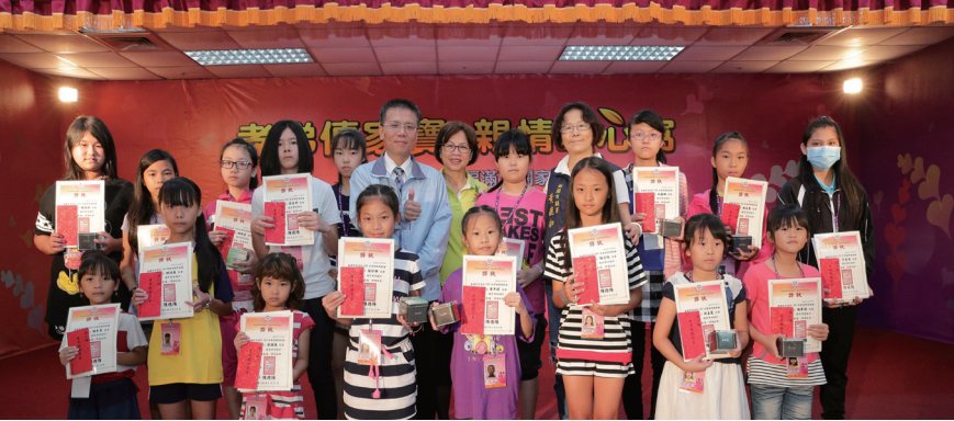
▲孝悌楷模國小組同學與貴賓合影留念。