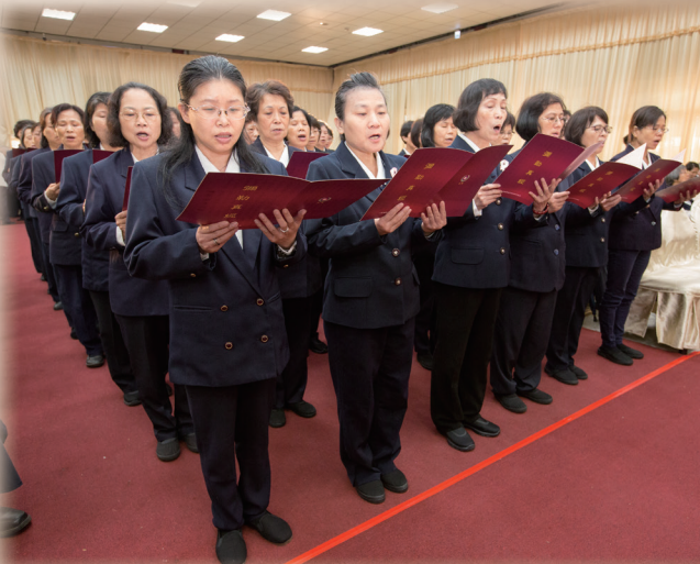
▲ 誦經團讀誦《彌勒救苦真經》。