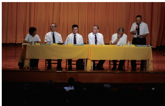
▲ 北區資源共享說明會，Q & A時間互動熱烈。