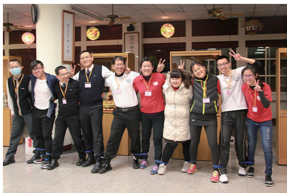
▲ 講師及幹部們挑戰多人多腳。

形的中堂。一顆真心獻於佛前，一叩首、一叩首，叩除自己不好的心念、雜念，也叩一叩自己的自性，有沒有好好做主？還是執迷了呢？濟公老師慈悲教誨我們：「『叩首』非『叩手』，……叩首是為了養成恭敬謙和的心。……要至誠，不要求快。」《老師的話》讓後學想起自己在家禮佛時，為趕時間，常「迅速完成」，不禁汗顏。禮佛是為反省修己，仙佛不貪後學的叩首啊！