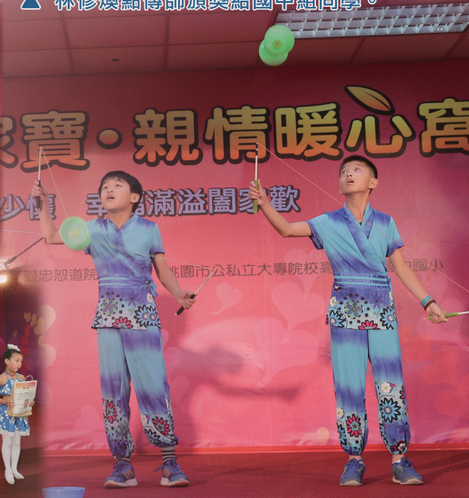
▲ 精彩表演節目帶動全場氣氛。