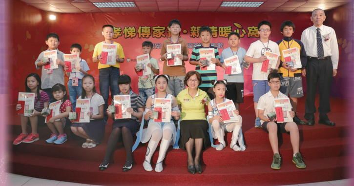
▲ 桃園市民政局湯蕙禎局長蒞臨頒獎。