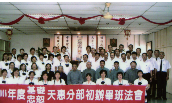
▲ 2006 年馬來西亞檳城舉辦初辦畢班法會。

但因為有人告，職責所在，我一定要來，請勿見怪。」也會暗示其他警察，莫找善良修行人麻煩；之前曾有一位不信邪的新進警察，硬要來找碴，來的時候就突然肚子劇痛，折回肚痛即好，如此連續兩三次，這位新進警察心裡就清楚了：這群老實修行人是有上天在護祐著呢！