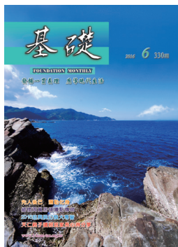
〈岸上聽濤〉圖 游重斌 文 岱 文