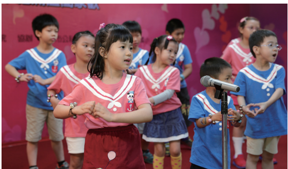
▲ 先天單位兒童讀經班小朋友表演手語帶動唱。