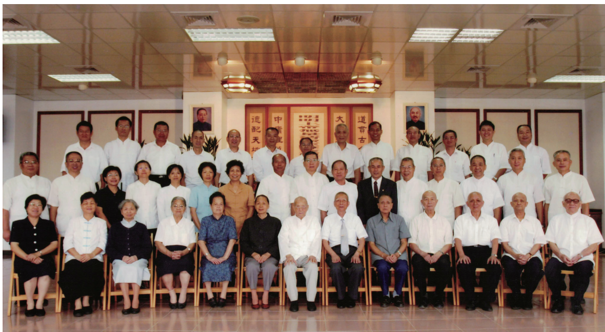
▲ 周前人、陳前人和瑞周天惠單位點傳師群合照留影。