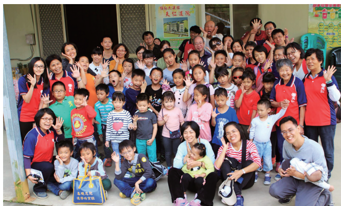
▲ 天仁親子讀經班戶外活動一日遊。

坐的位置都是可以看到自己孩子的位置，話題也是孩子，心都繫在孩子身上，這就是媽媽，真的很棒！