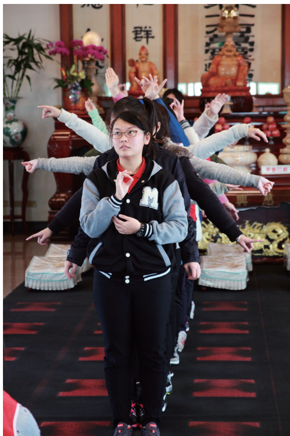
▲大專班坤道臨場演出千手觀音，創意無限。

跪在佛前，後學低頭看著手中這顆歷經兩天兩夜結成的「成果」，默默期望它雖然離開中堂，也要永保持豐盈、光澤而不晦暗。