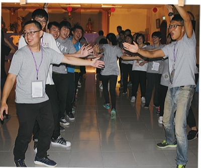
給彼此正向鼓勵的祝福， 並互相擊掌打氣。