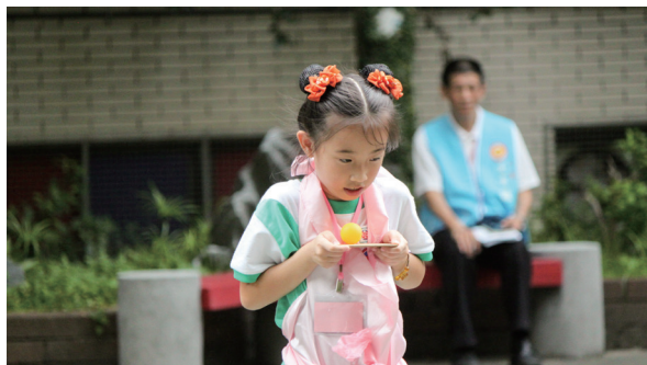
▲ 小朋友全力守護竹板上的乒乓球。

接著，郭淑君講師講述正課專題：「孝順的『懂』事長」。從兩位大家熟知的董事長：周董（樂壇奇才周杰倫）及郭董（商界翹楚郭台銘）為何會成功談起；其成功的關鍵是什麼？請各組把想法寫在紙板上，再由各小組長出列逐一唸出成功的原因，幾乎每組的答案均為：孝順、工作努力、認真讀書、謙虛、善良、堅持理想、願意回饋社會等。再由郭講師做三方面分析：1. 孝順懂事，2. 自我管理，3. 判斷