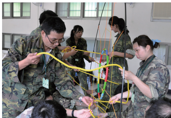
▲ 「蜘蛛網」關卡，恨不能有多些手來幫忙。