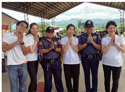
▲ 區長特別派了 8 名警察護持整個活動。

步出機場外，已經有當地的道親開兩部車前來接機，其中一部車的駕駛就是秋誼學長，大家簡單地寒暄幾句，便把行李搬上車，直奔至誠道院。後學剛好被安排搭乘秋誼學長的车，看著她嬌小的身軀，居然開著中型客貨兩用車，後學為之訝異；閒談中，秋誼學長說：「因為每天都要往返五間中堂，所以開著客貨兩用車會較為方便。」後學由後座往前看秋誼學長轉方向盤的自信與俐落，便知道她一定十分熟悉當地的情況，一位坤道能在這語言與生活習慣差異這麼多的情況下，為道打拼努力，實在不容易！當下為其勇氣深感讚嘆！