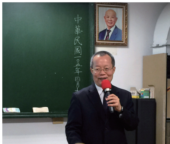
▲ 李副前人期勉大家：感動自己，並感動別人。

每一個道場都有每一個道場的家風，各有其殊勝處，道場佛規禮節嚴謹，就能看出道場莊嚴的氣息。重點在帶動正向循環，不只感動久居各地