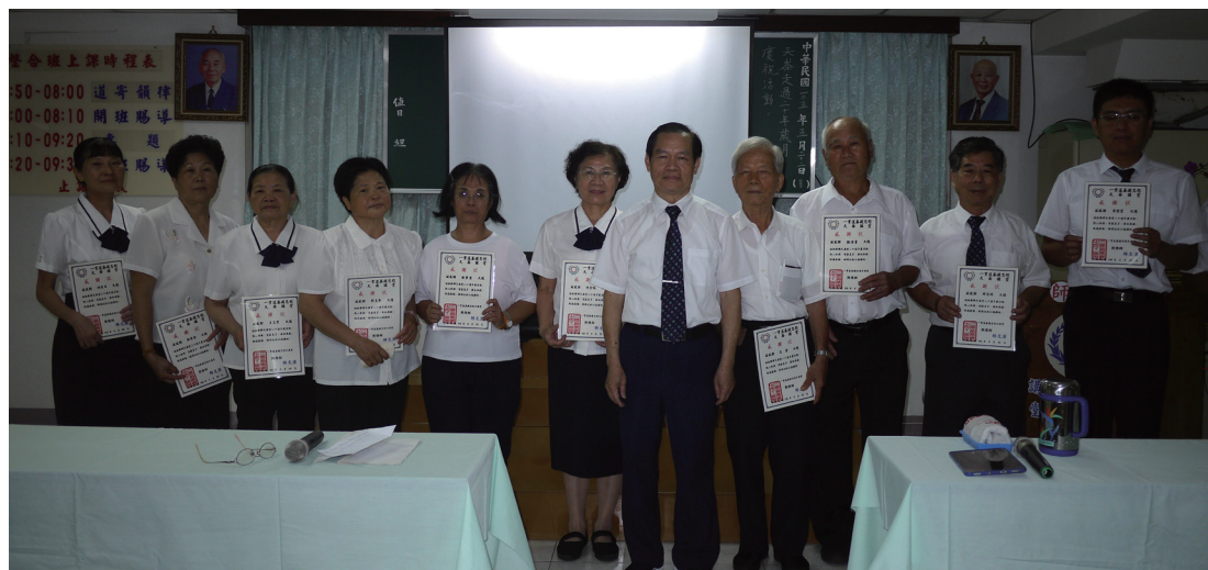
▲ 感謝大家慈悲付出，讓天崙講堂在 20 週年慶之際，換上新裝。

感謝 天恩師德，感恩前人輩及點傳師慈悲帶領，讓我們的青春歲月因進入道場修道、幫辦而不蹉跎，也讓我們認知人生真諦與茹素清口的重要性。耳邊又響起大家一起歡唱慶生歌曲的情景，祝福天崙講堂道務持續傳承綿延，祝福點傳師與道親身體健康、福壽綿長！