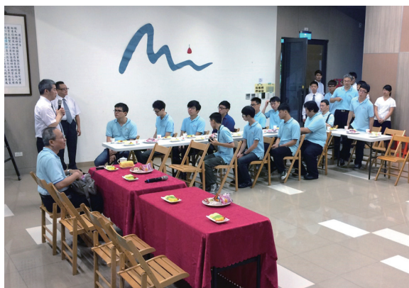
▲ 參訪發一崇德道場，令同學們收穫良多。

這次參訪讓後學有很深的感想，因為有前人們辛苦地開荒與普傳大道，今天的我們才能求得如此寶貴的一貫道。一貫道經由一代又一代的傳