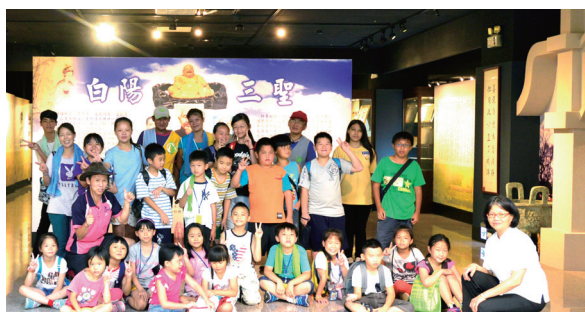
▲ 桃園市龜山區兔坑里社區兒童夏令營成員參觀文物館。