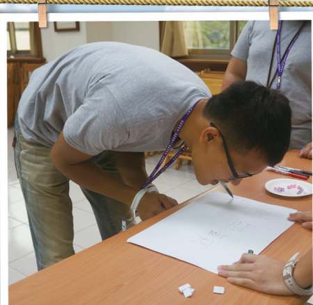
體驗身體的不便，藉以 反觀自身所擁有的幸福。