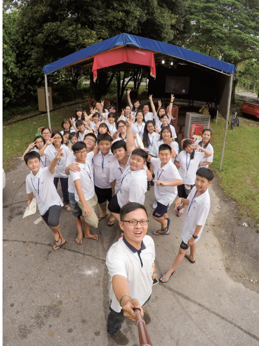
▲ 看著鏡頭,大伙一起自拍留念。

晚餐後,有位學員分享:「每次我們在練習表演大賽的時候,就一直想著,要把這首〈你打開我眼睛〉送