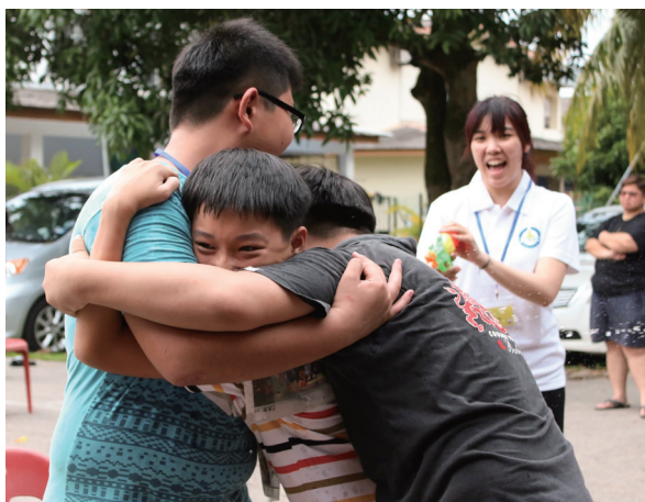
▲ 外面兩位學長保護中間者的報紙衣不會濕掉。

覺，天下的事物也具備了自然的規則和原理。由於人對事物自然的原理沒有用心去窮究，所以我們的知識不能達到細微明辨的地步。而我們修道，就是要讓自己回歸本心（天心），一切從原點出發，自然能明心見性，窮極乎眾理。