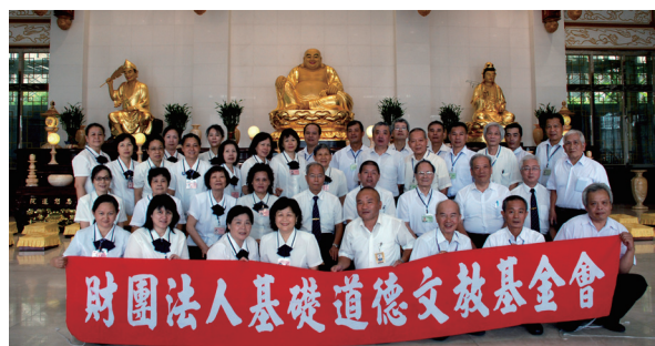
▲ 忠恕學院台北分部初級部一班二年級於祖師殿留影。