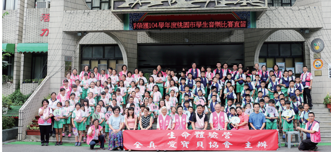
▲ 北門國小生命體驗營全體大合照。