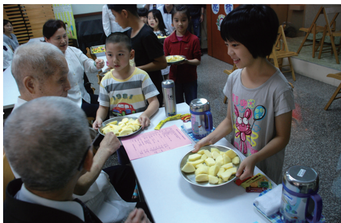
▲ 小菩薩們學習與傳承，端出努力切好的水果請老菩薩們享用。

本次現場邀請了6對母子或母女，每次回答均有小小的出入，引發大家會心的微笑；原來現在的父母和孩子彼此之間，雖比上一代親密，但仍有許多想法與思維上的差異。藉著「心