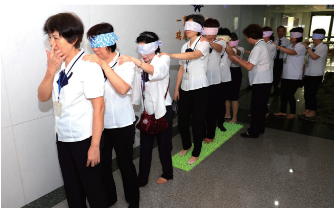
▲「回家的路」雖然崎嶇不平，仍要堅持下去。

將身心收攝回來，用最真誠的心去懺悔、體悟。其三、腳踏實地走回原點。短短的路上設有許多障礙物，有軟有硬、崎嶇不平，通過考驗才能回到中堂，也在提醒大家：唯有修道並經過考磨才能出頭天。