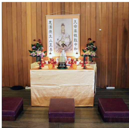
▲ 莊嚴的臨時中堂讓大家在營隊中沐恩成長。

大家如何在求道、修道中改變自己，將「道」運用在日常生活中；要善解包容、轉識成智、清口茹素、戒殺守仁。第一天精彩的課程，讓大家都有滿滿的收穫，宛如享受一場豐富的心靈饗宴。