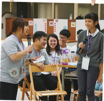
體驗活動後的回饋時間， 真誠分享。