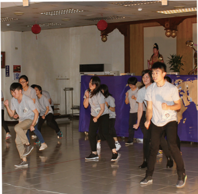
晚會開場熱力舞蹈。