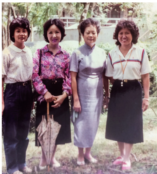
▲ 楊點傳師（右二）與道親合影留念。

追憶楊點傳師，後學印象最深刻的是「馬來西亞修辦隨駕行」。跟隨著記憶走，場景首先來到了馬來西亞吉隆坡一位道親家。俗話說：「在家千日好，出門一時難。」初到時，我有一點「怎麼會這個樣」的訝異！我不懂事地提議：「經理啊！這兒環境如此差，您借住在這裡，會給人看低，又不方便；何不到外邊租一間屋子，又可以開中堂，又方便度人、成全人，也不用看人臉色，而且住得也舒適一點。」楊點傳師回答：「做人做事要飲水思源，當初剛到馬來西亞，沒有路可以走的時候，是這戶人家沒有嫌隙心地讓我們住下來，而且不怕麻煩地讓我們開臨時中堂，還