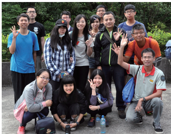
▲ 集合時，各小隊先合影留念。

師一直在跟大伙講著口號：「一家人」；這就好像在道場服務幫辦一樣，唯有大家同識共辦，才能上下一條心，大家不分你我，共辦三曹普度大事，這時大家體現的就是天心，而不是你我分別的心了。