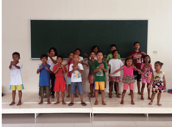
▲ 小朋友很認真地彩排表演活動。

第二天，大家7點出門，分成兩批前往兩個地點場勘。第二堂震撼教育～這群當地的孩子們在短短兩個