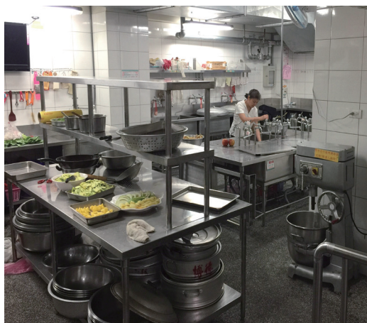
▲ 專業的伙食餐廳，寬敞又便利。

《論語·里仁》有說：「見賢思齊焉，見不賢而內自省也。」發一崇德道場給我們一個很好的典範，我們要好好學習！訪道完後，後學心裡有