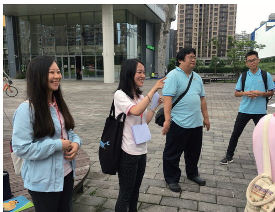
▲ 用心設計的 RPG 活動，刺激而有趣。

透過講師的分享，感覺他們成全年輕人的方法，很有一套，可以讓沒興趣來或是很難抓住的人留下來，所以可以感覺他們的人很有向心力；僅