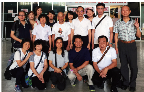
▲ 收穫滿滿的海外學習之旅。

此外還有一個小插曲讓後學感觸很深，因為每天往返各個中堂，路程需要花費 30 分鐘～1 小時不等，沿路上後學總是無意、不間斷地看到可樂的廣告。而後學在結業式中主要的工作是負責攝影及拍照，因為菲律賓的天氣很熱、又缺水，後學心裡就在無意間起了一個念頭：「如果現在有瓶