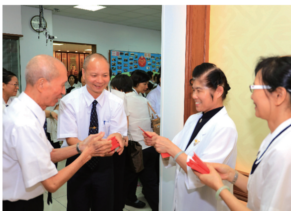
▲ 點傳師一一發給賜福佛卡，法喜充滿。