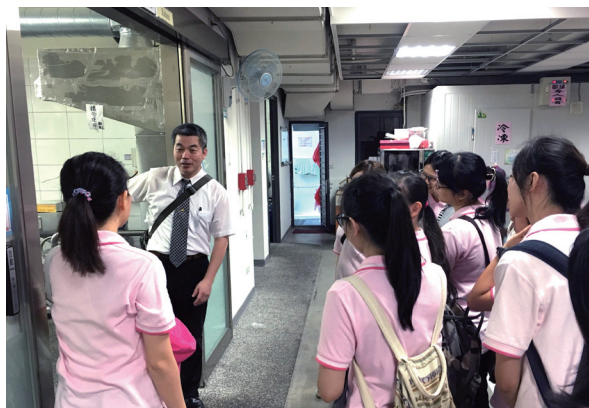
▲ 介紹博德新城中的各項設計，實用中見到巧思。

回想起當天的活動，後學由於下午有事而無法參與全程，有點小可惜；但早上的訪道，倒是讓自己有不少的啟