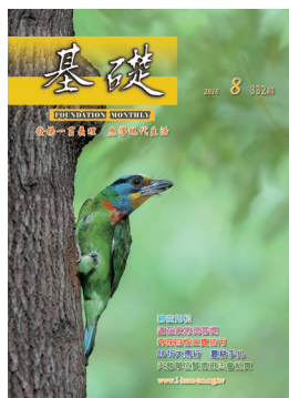
〈五色鳥之歌〉圖 施駿龍 文 岱 文