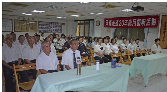
▲ 來自嘉義、臺南、高雄等地區的道親，齊聚祝賀天崙講堂成立 20 年。

在這個彌勒家園的大家庭裡，道親像一家人般親切，每逢整合班、活動、會議、道院輪值等各項班務，都能在點傳師帶領及道務助理、班長與幹部的策劃擔綱下，完成一次次不可能的任務；為什麼說是「不可能的任務」呢？一則是因為點傳師住在台北，經年累月為道務南來北往，以及至國外輪值奔波，長達 20 年的時間與精神，真是令後學們佩服與感動；再則是因為天崙幹部及道親每年前往基礎忠恕道務中心（桃園市龜山區忠恕道院）開會、幫辦或輪值服務時，大家