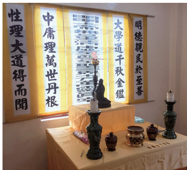
▲ 莊嚴殊勝的臨時中堂。

7天的國外學習，收穫很多，後學內心也充滿無限的感動；看到菲國當地的辦事人員與小朋友親密互動、教學中文，還有負責辦道時的執禮、講三寶等等，在在顯示大道已在三寶顏這裡生根。最後，感恩點傳師及各