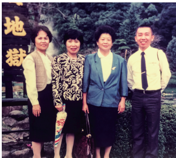
▲ 楊點傳師（右二）與道親去日本時合照留影。

後來，後學知道楊點傳師要關心哪位道親時，就會幫忙寫好信，然後念給她聽，楊點傳師都會很慈悲說：「好，很好！快點，我們要準備出去了！」出門時，後學跟楊點傳師都是手挽著手，保護她不要跌倒，因為楊點傳師當時真