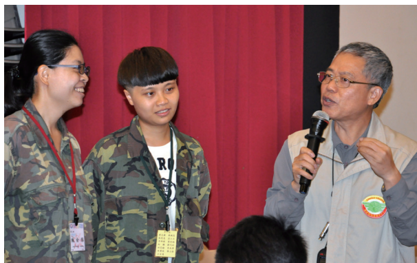
▲ 透過輔導員引導，了解每個關卡的意義。