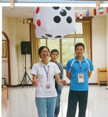
小組競賽，爭取在 世界地圖中的前進格數。