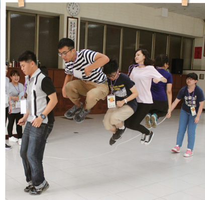
藉勞力或智力換取所得， 並探討想要與必要的差異。