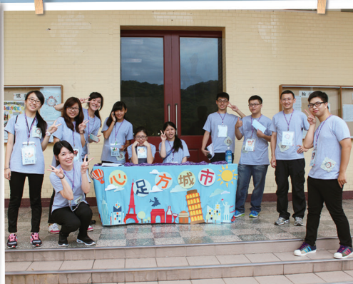
歡迎蒞臨心足方城市。