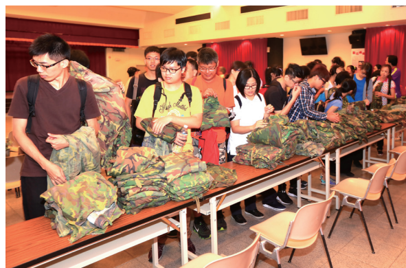
▲ 挑選迷彩服，準備進入營隊。

另外，這次的共識營，讓我們暫時忘了都市的忙碌緊張，到了山林間，放鬆心情，一方面看著美麗風景，一方面又勞動身心、沉澱心靈；唯一美中不足