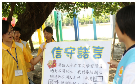
▲ 透過特別設計過的海報，更能讓同學了解遊戲的意義。