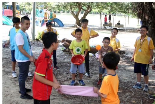
▲ 大地遊戲寓教於樂，讓孩子從中體會信德的重要。