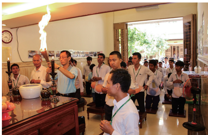
▲ 午獻香，由當地道親擔任執禮人員，展現學習成果。

慧忠壇主斯文高大、中文流利且幽默，相當盡責地招待我們。在一次聊天中提到，他的爺爺住在吳哥，之前非常支持慧忠進入道場，後來生病好長一段時間，退化到不認識身邊照顧他的人，也不認得一年回家不到一次的孫子。就在去年爺爺臨終前，剛好點傳師在柬埔寨，忽然靈機一動，想去慧忠在吳哥的老家辦道並探視爺爺。因為這個機緣，那天上午，他們一家人及已經兩週無法進食的爺爺都求了道；下午點傳師一行人離開不久，爺爺就歸空了；歸空時身軟如棉，示現道的殊勝，讓眾親友都驚訝不已。相信這些時機巧妙的顯化，都是上天為這些人才所安排的震撼教育！也難怪當地人才可以有這麼好的表現。