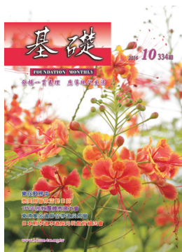
〈秋意金鳳花〉圖 詩壹 文 岱文