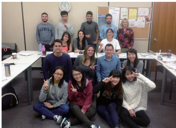
▲ 和語言學校的同學一起開心學習。