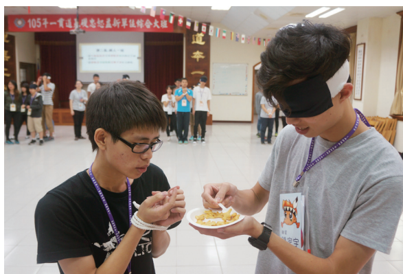
▲ 透過各種體驗活動，讓大家深入「知足」的課程目標。