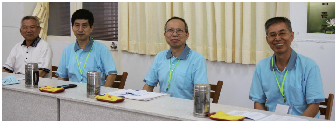
▲ 各區點傳師慈悲護持生服營。

核心精神和服務的價值。這種較為細膩的互動方式，也是由於學員們的心態都已有了轉變，不再只是抱怨著很累（前兩年往往要針對這方面多加疏導），遇到各項服務工作也任勞任怨地承擔，幾乎沒有二話，所以當分享到更為深刻的心理建設時，往往學員們也都有所共鳴。