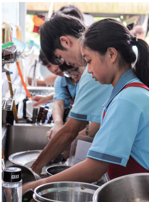
▲ 細心洗滌所有的碗盤。

第1天剛進來時，彷彿有一種奇妙的感覺，類似學校，但我很害怕，不知道該怎麼做，甚至害怕到想哭。第2天，我覺得自己比第1天勇敢，甚至願意主動去交新朋友，而且也學到獻茶的禮節。第3天，我印象最深的是營火晚會，我們只花了半小時，