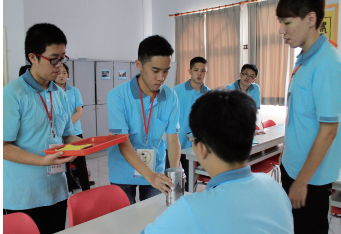
▲ 學習遞送茶水毛巾，傳承尊師重道家風。

第一年的副隊長經驗，感覺比學員還不累一點，但需要記跟想的事較多，超級不一樣的感覺！希望我的學員也覺得我帶得還行囉！