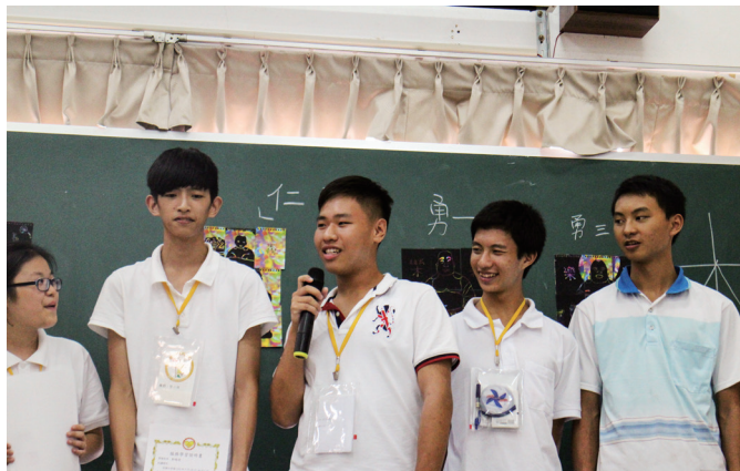
▲ 快樂分享這四天的心得。

看到那個刻著「我好帥」的銅鑼，原本平靜的心掀起了狂暴的波浪，並在心中挑起了一波波漣漪。看著看著，漸漸回憶起這幾天又苦又快樂的日子。