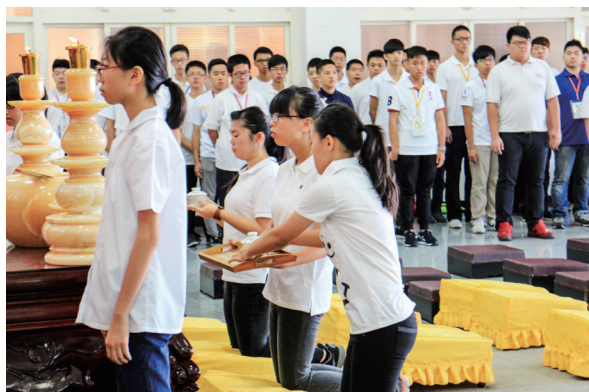
▲ 學員負責獻供禮節。

第2天，我擔任燒香的上執禮，在中堂拜拜時都沒問題，也不緊張（平常都有在拜拜，念佛號對我來說不是問題），但在祖師殿時，我念錯蠻多部分，可能因為本來就不熟，再加上緊張的關係，希望下次在祖師殿執禮的時候能更順暢、更正確。