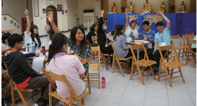
▲ 多元的互動與分享是大專夏令營的特色。

因為工作的關係，我缺席了後面幾次的課程驗收，等我能從工作中回神過來，已到了活動前夕。連夜讀完課程企劃，有些惴惴不安的我來到了活動現場，從報到處簽到、觀月樓寢室放置行李，到2樓講堂的小組認識活動，一切井然有序地展開夏令營的序幕；我想我過度擔心了，18期、22期的夥伴與支援學長們，正用自己的方式寫著自己的歷史。覺察當下，我