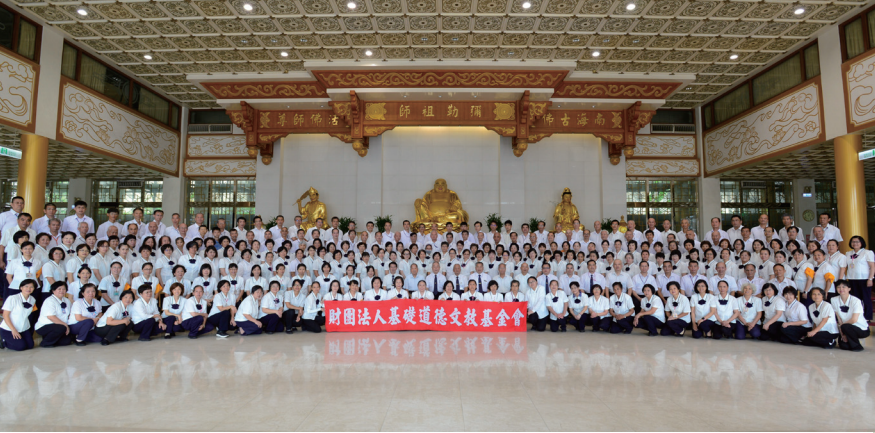
▲ 基礎忠恕學院高級部期中法會於祖師殿合影。