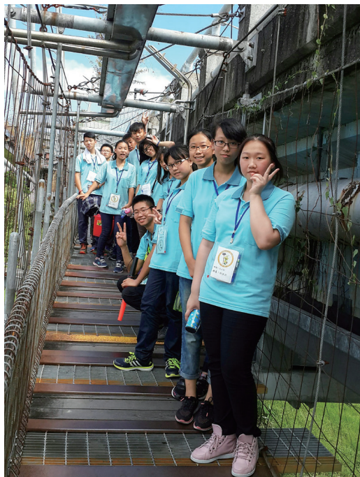
▲ 小組於外掛橋上留影。

剛來生服營，我分到了仁三小隊，一開始不太熟，第1天大家沒太多互動。到了第2天，開始要服務小學生了，此時大家便有了默契，要一起完