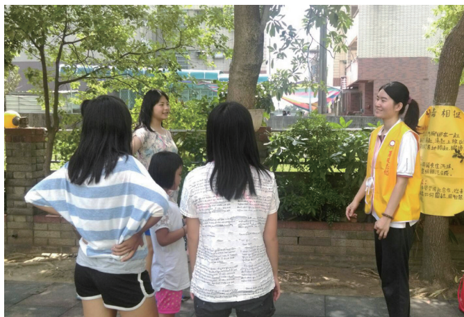
▲ 透過遊戲，帶動育幼院小朋友體驗學習。

活動進行中，雖然有遇到無法引導的同學，後學也是盡力讓他能和其他的夥伴們一起完成闖關任務，得到最佳成績，讓他們自己發現及學會團隊合作的精神；後學能有這樣的體驗算是值得了，也希望藉由這次活動可以讓育幼院小朋友更有向心力，就算年紀還小，卻也正是建立團隊合作基礎的開始。