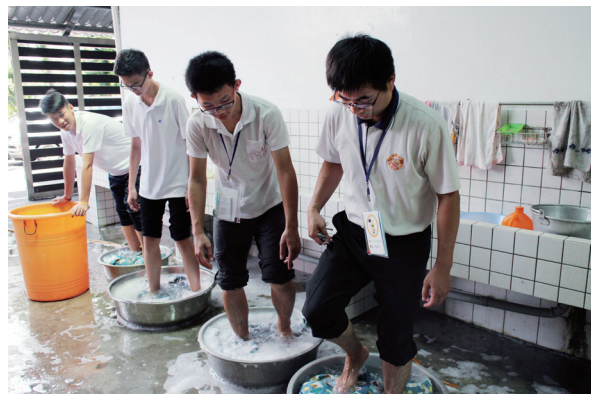
▲ 帶動小隊洗被單，共同承擔營隊任務。

隊長，真的是個很不錯的營隊體驗，跟我這幾年曾參與的宿營、大專夏令營，都是很不同的。