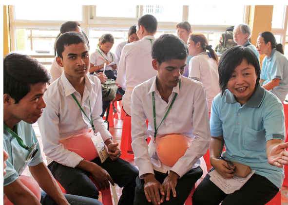
▲ 揸著水球，體驗母親懷胎的辛苦。

以「媽媽原來是觀世音」的故事引入，提示學員：孝順就是修道的開始。再以「安養慰敬順顯」6種孝順的方法，總結如何全方位地盡孝。接著由張老前人因為孝順而求道，進而道傳萬國九州的顯親，說明大孝的可貴；最後談到法會殊勝，仙佛護持，祖先