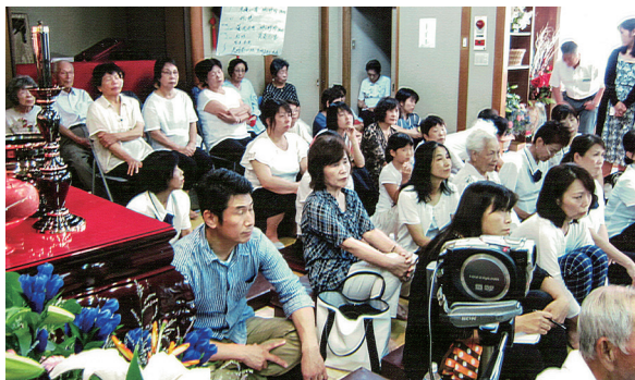
▲ 道親齊聚法會，聆聽專題，滋養心靈成長。

身心要健康，要常食四勿湯（勿生氣、勿固執、勿自私、勿設限），這是心靈的提升；而身體要健康，則要吃有益的食物。天廚媽媽們非常熱心，在高