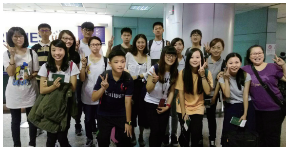
▲ 滿懷期待踏上澳洲之旅。

聊天、玩遊戲、一起寫作業，假日一起出去到處玩。相處短短一個月，大家感情卻都很好，謝謝你們，回台灣我一定會想念大家。