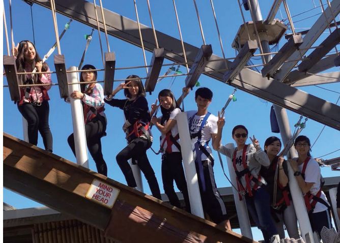
▲ 在澳洲的各種初體驗，令人印象深刻。

這是我第二次到澳洲。回憶中的澳洲，有著溫暖的陽光和餘暉遍照整片天空的夕陽；這次與上次不一樣的地方在於我在 Brisbane 待了一個月，而且多半的時間都使用英語溝通，對我來說是一個很不一樣的美好體驗。