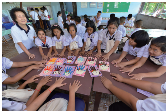
▲ 學員繪製感恩卡，向父母親表達感謝。

有了昨天的經驗，今天的活動內容更加精彩，有體驗懷胎十月、人生真諦專題、孝道專題、中文教學、道歌教唱、架構圖教學、感恩卡繪製等。然而最大收穫是下午校長賢伉儷、副