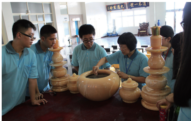
▲ 經過各項工作的培訓後，再開始輪班服務。

因為營隊性質的緣故，參與生服營有名的就是一個「累」字（甚至連第一次參與的學員都事先耳聞）。但經過這幾年的經驗，會發現身體上的累並不是真正的累；相反地，如果工作太過輕鬆、時間太過寬鬆、玩鬧時間增加了，就會出現精神上的疲累，因為精神渙散