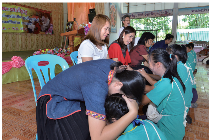
▲ 孝道主題的分享，帶來深刻感動。

因今天以辦道為主，故營隊提早在早上 5 點出發，一個小時的車程到達學校，趕忙佈置臨時中堂、架設音響設備、禮節演練、打掃環境，大家分工合作。禮堂在 4 樓，沒有電梯，