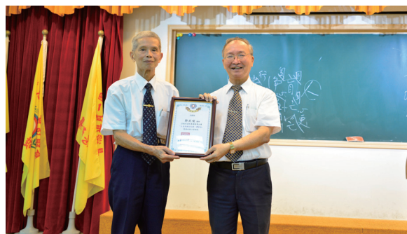
▲ 高程輝領導點傳師致贈感謝狀予鄭點傳師（右）。