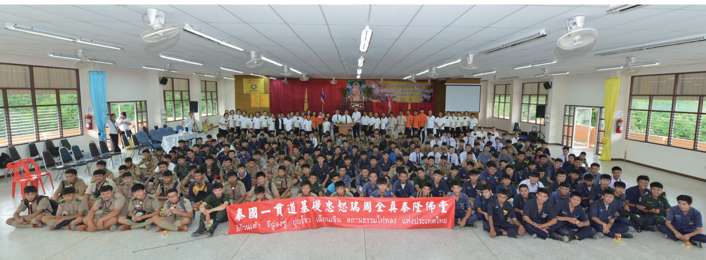
▲ 滿懷歡喜大合照，期待再相聚。

因為是我們團隊首次在國外舉辦營隊活動，有辛苦，也有考驗，但獲得許多寶貴的經驗；許多團員已向同學、朋友招兵買馬，預約明年一同參加營隊活動。我們團員就是這麼可愛，有了這麼一群有經驗的可愛團員，相信未來再舉辦類似的活動，都可得心應手。這都得感謝天恩師德，感謝前人、領導點傳師及點傳師的成全，也感謝支持我們赴泰國了愿的家人；只要用心，上天會有最好的安排。