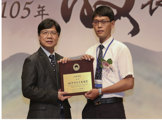
▲ 慈興講堂獲頒內政部獎。

人台灣省台南市香光聖堂、財團法人一貫道神威天臺山天臺聖宮、財團法人一貫道寶光紹興崇華聖道基金會。