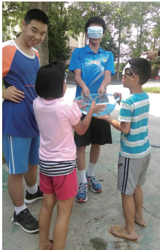
▲ 闖關活動中要發揮團隊精神，才能順利過關。