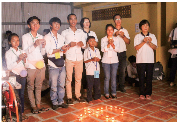
▲學員點燈為父母祈福，啟發祈願行孝的愿力。