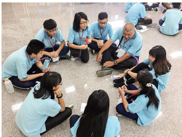
▲ 小組時間，學員彼此互相認識

服務，是沒有捷徑的；幫助別人只是邁出了一小步，通向大同的道路卻還有一大截，等待我們發掘、前進。路，還長著呢！