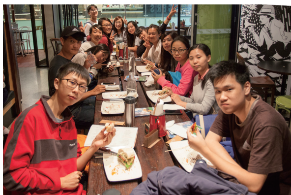
▲ 品嚐在地美食，體驗異國風情。

我喜歡布里斯本的天氣、大學環境、街區、公共設施，和黃金海岸的風光……，多得說不完；尤其印象最深刻的是公共設施這一塊，可以明顯