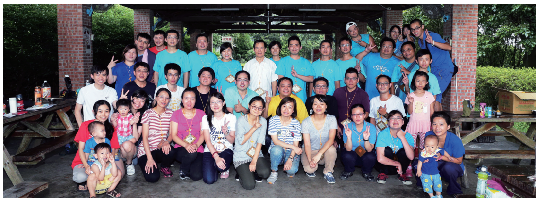
▲ 在文山農場體驗大自然的樂章。

再次感謝天恩師德，以及參與這次活動的所有學長，讓我們身心靈都充飽了電，真是如獲至寶。讓我們彼此祝福，期待明年大家都有所成長。