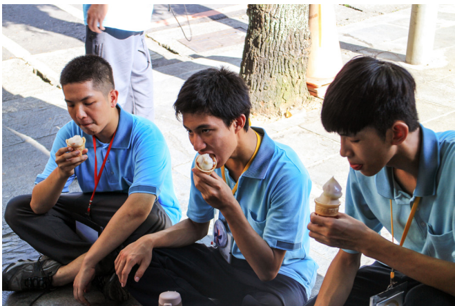
▲ 戶外教學，大快朵頤吃著芋冰。

麼可能成功？這幾天，謝謝每個隊員包容我的活潑，有時候又有些不受控制，還有大家辛苦地把所有事情都一起完成了。我愛生服營的每一位，包括隊輔，你們真的辛苦地陪伴我們，還有大隊長和營長，如果缺少了任何一個人，就沒辦法讓生服營順利地辦下去了。