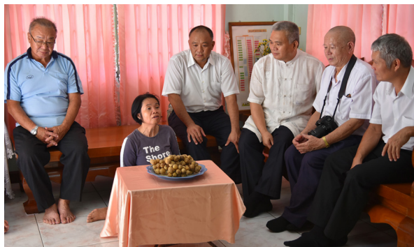
▲ 娃差利壇主心路歷程分享（左二坐在地上者）。

泰國這個純樸的國度，生活步調也相對較慢；後學來到這裡，雖然不完全是與世隔絕，但暫時少了在台灣種種壓力，內心感到清靜許多，這是個難得的回憶。有些學長發愿明年還要再來，後學也希望有更多年輕一輩加入團隊，共同學習與成長！期盼未來還有機會再到泰國了愿，唯有付出，收穫將會更多！