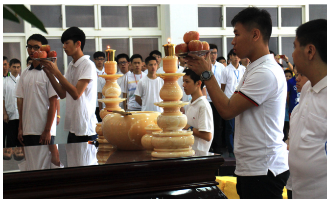
▲ 執禮初體驗，讓學員們成長很多。