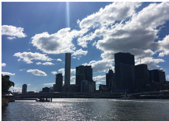
▲ 澳洲的建築景緻及風土民情，令人記憶深刻。

最後感謝澳洲忠恕道院的各位能開辦這麼好的一個活動給我們參與，感謝 天恩師德，感謝點傳師慈悲，也謝謝各位的照顧。