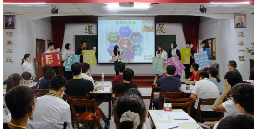
▲ 小組上台分享時間規劃，期許成為道場中堅份子。

像力，穿越時空一起來到了「時來運轉轉運島」，有緣遇上島主召開轉運仙丹拍賣會；仙丹的功能包括改善健康、財富、家庭、事業、智慧等等。經由學長非常有感染力的拍賣，各組學長爭先恐後地參與競標，似乎買到仙丹的話，未來就會得到我們想要的轉變。但經過討論後，我們開始回歸理性，知道如果想得到，卻沒有努力地付出，是不可能達到的；而且時間真的不等人，當我們極力為某項目標努力的時候，被我們所忽略的更重要的人、事、物也在默默離我們而去。因此如果能在來得及之前，為自己心中真正想要的事而努力，才會得到未來的幸福。