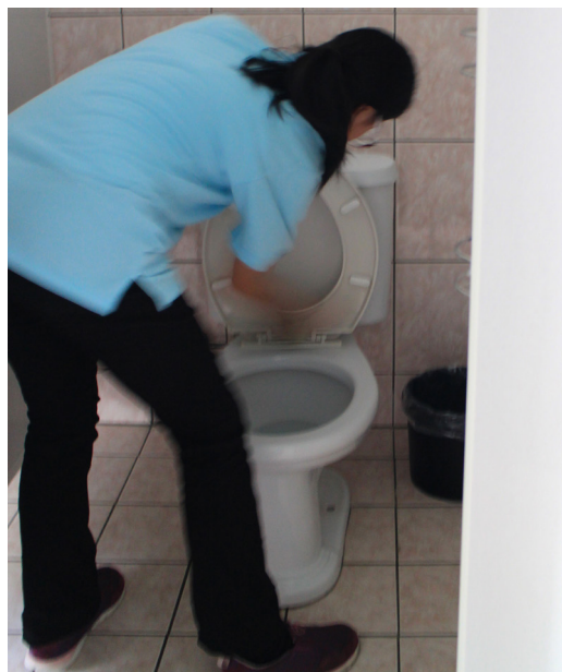
▲ 固定時間巡視並維護廁所清潔。

後學參與這次4天3夜的生服營活動，每晚都僅能睡3～5小時，白天因為帶小隊，也無法補眠；要是平常上班時，晚上沒睡好，中午又無午休時，精神一定不佳，但在活動期間卻沒有這種感覺，真是太神奇了！後學這幾年來，感覺來到中堂服務，真的就好像有如神助，仙佛一定在我們身上灌注了好多精力，只要早上從床上爬起那一刻後，就算無法回去睡回籠覺，也不會很難受，精神及體力都