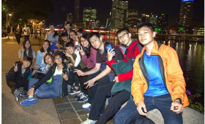
▲ 感恩一起遊學的好夥伴，豐富這一個月的生活。

從家父那邊得知；在暑假期間，澳洲忠恕道院為一貫道學子舉辦遊學營。後學趁著剛滿 18 歲又考完大考，