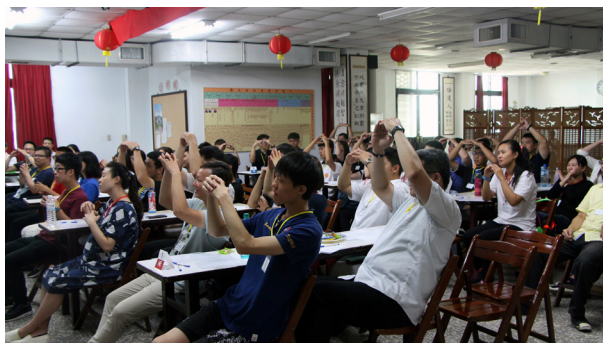
▲ 全體熱烈參與人生平凡幸福賓果活動。