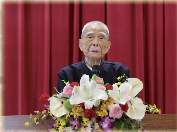
▲ 陳德陽前人慈悲叮囑道親們知恩報本。