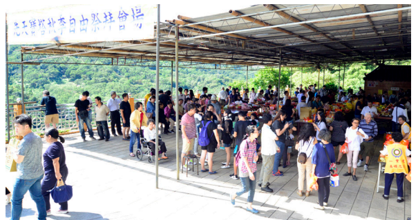
▲ 先天寶塔秋季自由祭拜，誠摯表達緬懷與追思。