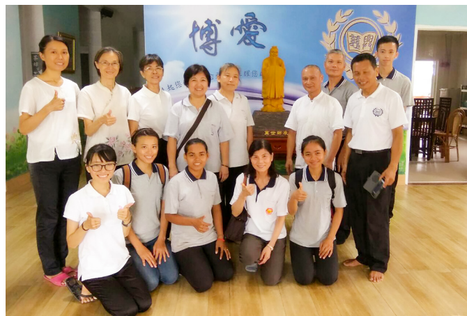
▲ 與東國慈興國際學校駐壇人員合影。

一眨眼，11天的東國了愿行程已結束了，雖然不是第一次到國外道場，但這次讓後學體悟最多，也最法喜。天時緊急，上天開恩，我們有幸先得後修，更應加緊腳步，行功了愿；盡人道、達天道，度化眾生，才不負前人拋家捨業，離鄉背井的犧牲奉獻，願以此文與前賢們分享，共同勉勵。