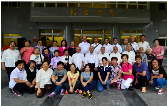
▲ 黃總領導點傳師與忠恕道院職志工歡喜留影。