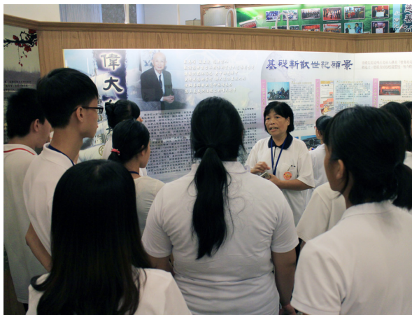
▲ 就近參訪天庭道院道史館，聆聽導覽。

在夜幕低垂時，萬籟俱寂，萬物養息；孩子們睡了，我們還在會議桌上；後學看見所有師資在一天的緊繃下來，眼皮彷彿重千斤；再偷偷瞄一下營長，他太神了！還要主持檢討會及帶著大家跑明天的流程！最後一天，我完全累垮掉，因為最緊繃的戶外活動過去了，一切交通安排順利完成，似乎我的一口氣也鬆了；天氣還是很熱，我就像是得了雞瘟的雞，一坐下來就完全入睡，整天昏沉沉，彷彿已耗盡所有體力；這幾年來，感受到體力和精神一年不如一年，後學 52 年次，好像是營隊中最沒體力的一位了，明年不知還有沒有體力繼續。今年大學生加入，擔任副隊長和其他職務，非常成功！也讓自己清楚：是該年輕人接棒的時候了！