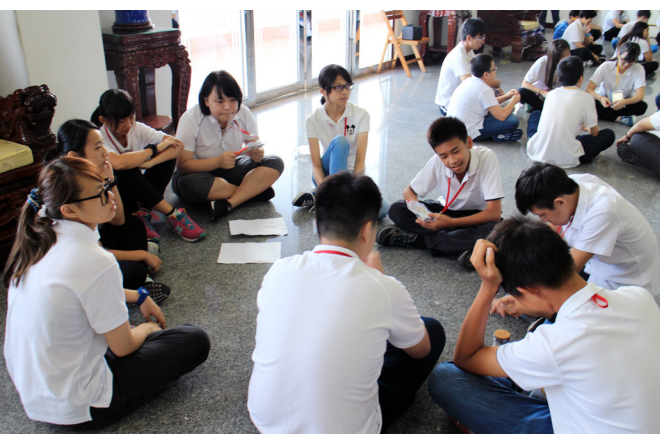
▲ 分組討論，讓學員腦力激盪、表達意見。