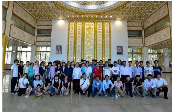
▲ 呂領導點傳師與國外道親於忠恕道院合影。