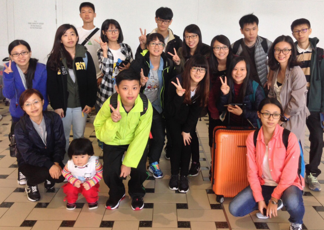
▲ 體驗遊學生活，開啟另一種視野。

後學真的很高興有你們大家，Remember to keep in touch! :)