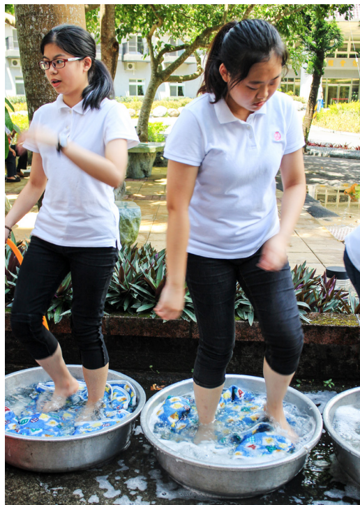
▲ 學員同心協力水洗棉被。

由的暑假生活，想當然囉，一進營隊，一陣陣不適應的感覺朝後學席捲而來。行進的隊形、報數的音量，甚至連上廁所、裝水都要以「團體」為單位，雖說如此，後學十分幸運地遇見了仁一小隊的所有夥伴，我們在這4天當中相處得很融洽，也一起完成了許多繁重的任務。