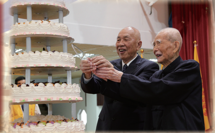
▲ 陳前人與黃總領導點傳師切蛋糕共賀。