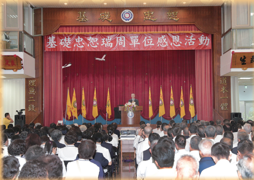
▲ 感恩前人輩成全與提攜，愿齊心傳承永續。