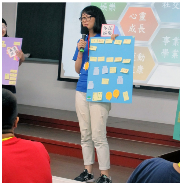
▲ 心靈成長、家庭、社交、事/學業、休閒娛樂……，我的順序是？

成長營結束了，希望這次的活動能增進學長們對道的信心，凝聚第二代青年的向心力。改變從現在開始，讓青年自覺自醒，心中有夢想，「愿」能堅持並奮然前行，為道場付出，成為道場中堅份子。