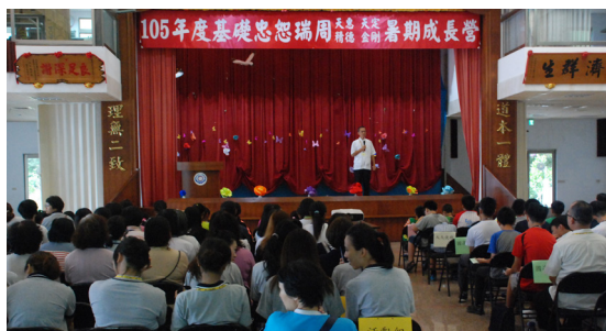
▲ 暑期成長營帶來許多省思和體悟。

民國 104 年（2015），劉領導點傳點回歸理天，每想起她老人家過世前提勉精德同修：「捨身辦道菩薩愿，上天取得爾心田；為道頂起諸磨難，為眾捨己芳名傳。」後學心中盡是不捨與慚愧——不捨的是，回到精德中堂時，再也看不到、聽不到她老的慈祥叮嚀與賜導，對她老的思念與緬懷有增無減；慚愧的是，後學對道的不精進。劉領導點傳師雖然已不在我們這些小後學的身邊，但她老的風範行誼永遠印烙在後學們心中。相信瑞周精德同修們也會追隨她老的腳步，對道學的精進與道場的護持，與日俱增。