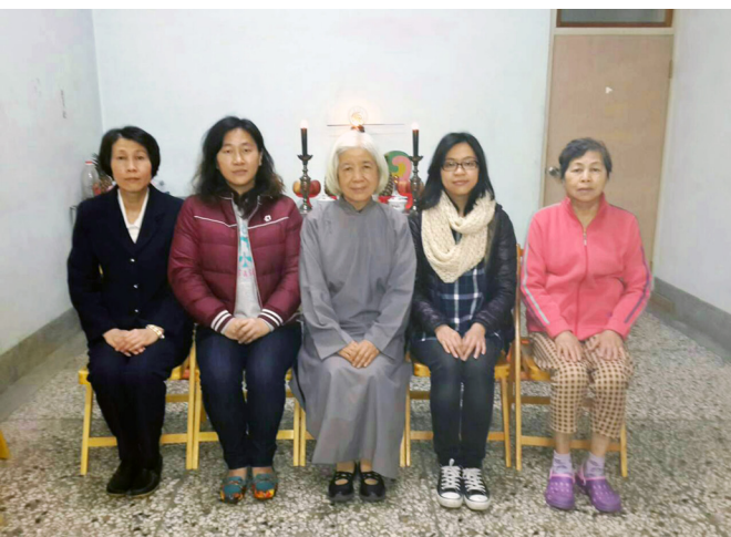
▲ 張點傳師和當引保師的作者及作者的大姊（右）及其大姊剛求道的兩個女兒合影。

我們要迴光返照，自性佛一明，夢幻就會破滅；自性佛不明，就被夢幻所迷。學習謙卑，虛心求教，虛心學習；人若不覺悟世間一切只是短暫擁有、人生無常迅速，枉此生有此殊勝因緣。無所求之求是大求，無所為之為是大為。用心、感恩、懺悔，遇到歷練考驗時，「三分的誠意，上天就會給七分的助力」。三施並行，事在人為，人有誠心，上天自有感應；堅持自己的信念，不要輕易改變，不論自己面臨的環境有多困難，秉持著無怨無悔的心，一定要堅持修道這一條路，才能消宿世業債。