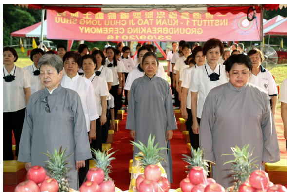
▲ 虔敬禮拜，祈求上天庇佑建設順利平安。