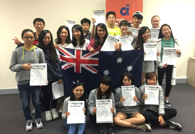
▲ 在語言學校中，和來自各國的同學共同學習。