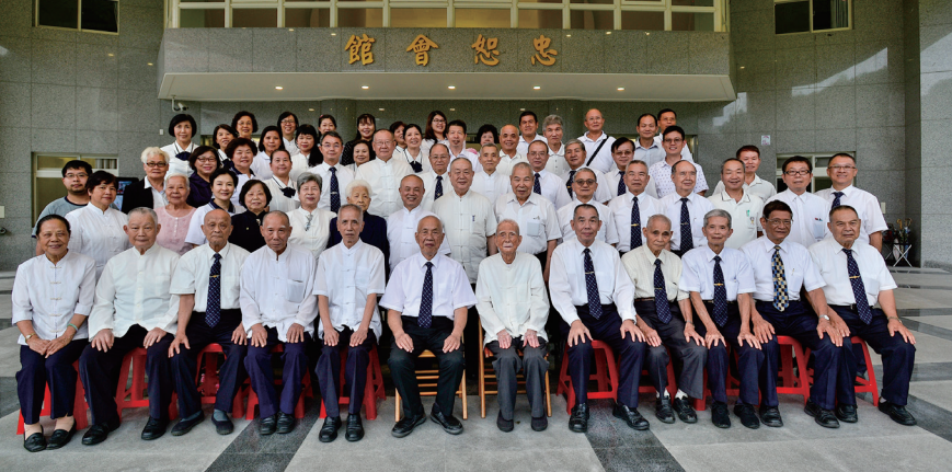
▲ 基礎忠恕會館啟用一週年合影留念。