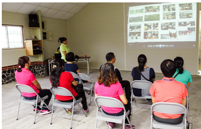
▲ 家長班上課，介紹親職教育的重要性。

品德營第一天進行孝道體驗活動。每位學員都揹起一個水袋，體會母親懷胎十月的辛苦；在講師的說明下，同學們對自己「腹中的孩子」都小心呵護，瞬間少了嘻鬧與輕忽。在揹水袋的過程中，還要進行闖關活動，體會父母養育小孩的奔波勞累。分組闖關內容有：1. 完成一份拼圖：需要有專注力。2. 開菜單，想出一天三餐的菜單，需考量營養、美味、價格等，而且是自己能下廚做的。3. 分類整理：將多樣物品歸位，讓同學們體驗父母整理家務的忙碌。4. 訂正一份考卷：體驗父母檢查子女功課的用心。5. 找出數字：於1～500的數字中，找出某兩個指定數字，找到第一個數字後，