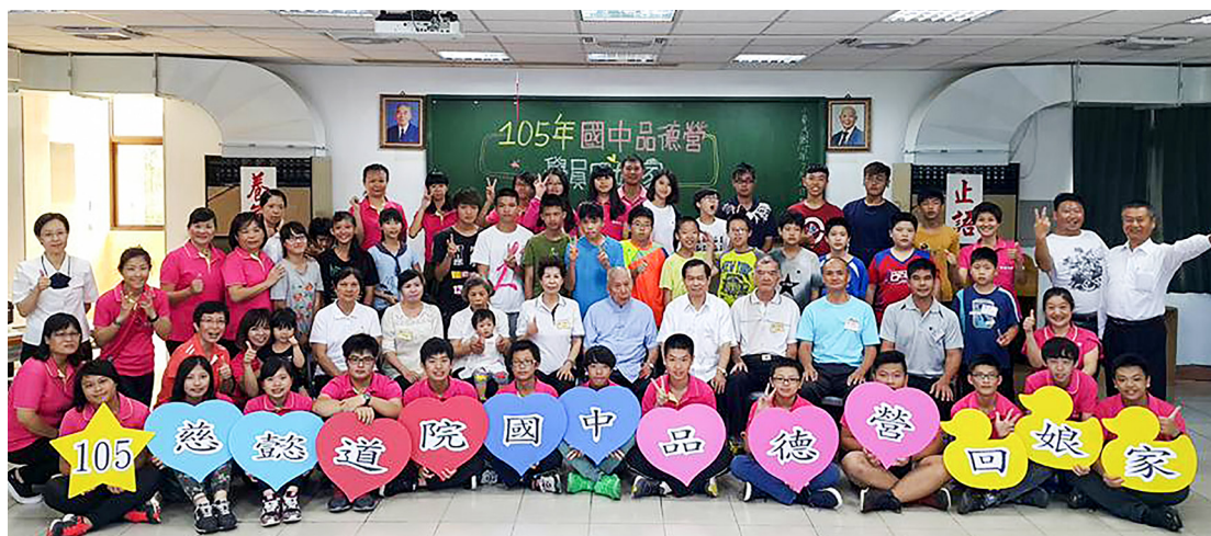
▲ 黃點傳師與品德營師生大合照。