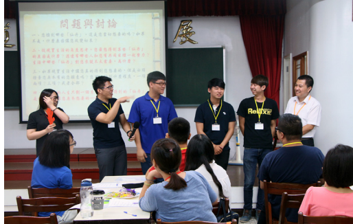
▲ 在拍賣會中體會到：為自己心中想要的事而努力，才會得到未來的幸福。

著來到餐廳共同享用總務組學長費心準備的火鍋，稍作休憩與餐敘，結束了今天的營隊活動。