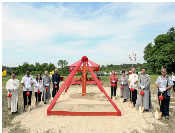
▲ 林文恬會長（左5）和江領導點傳師（左4）等貴賓共同主持動土儀式。

忠恕聖道院的建設運作以瑞周天定在馬來西亞的天嘉中堂為中心，分為12組籌備與執行；動土典禮的各項細節，都是在點傳師慈悲領導下，經