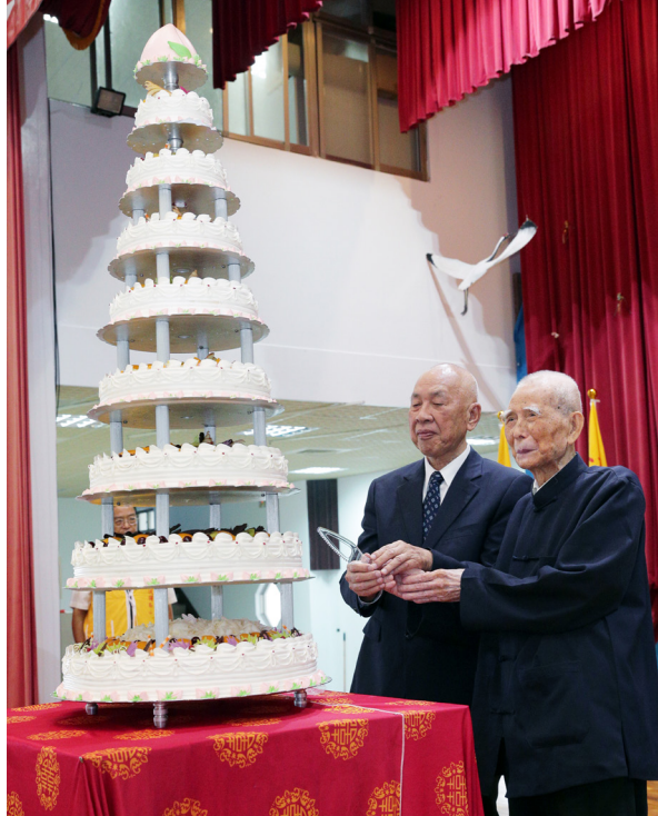
▲ 陳前人與黃總領導點傳師慈悲齊心切下九層大蛋糕，祝福基礎忠恕道務永續發展。

往後我們能夠脫離四生六道的輪迴，若是沒有上天慈悲，沒有師尊、師母二位老人家筆路藍縷，在烽火中不畏生死，帶領著前人輩們奔走四方，哪有今日大道普傳？所以，我們最要感謝的就是天恩師德。