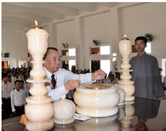
▲ 廖領導點傳師代表獻結緣香。

30 日道寄韻律帶動。因天暘中堂的坤道多是年輕，正忙於學業，所以不容易找到執禮人員，讓後學很傷腦筋！剛好有一位求道未滿一個月的坤道道親很認真，每天早上都會來天暘中堂學習中文；後學告知這位學生，請她背獻香禮，法會當天請她當執禮人員，她也沒有推辭，開始認真背禮節。一直到法會前一天，這位學生忽然跟後學說：「我兩天法會不能參加。」原因是她要參加免費電腦鑑定考試，若通過，有證書可以領（這對當地年輕學子而言，確實是很重要的考試，畢竟她才 15 歲，能有電腦操作檢定合格證書，對以後進入職場，有很大優勢）。當下後學也只能鼓勵她：「法會的機緣是非常奧妙、殊勝而難得，電腦鑑定考試以後還有機會再考。請妳自己考慮清楚。」她也沒有給後學