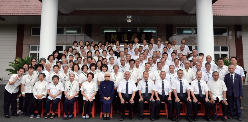
▲ 於天庭道院舉辦壇主法會，黃總領導點傳師和與會者合影留念。