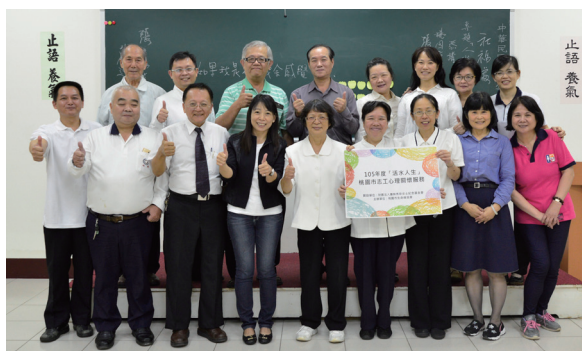
▲ 社福處舉辦體驗教育工作坊。