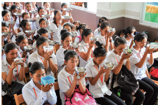
▲ 滿懷感恩心，享用素食餐點。

第二天的午餐時間，後學夾完菜要回到座位的時候，看到一位當地幹部蹲在大禮堂入口處，左手拿著已夾好飯菜的碗，蹲在地上，右手撿起一粒一粒的米飯放進自己嘴巴；後學看到這一幕，真的感觸很深，後學來東國第二年了，第一次看到當地的人撿飯粒起來吃。這原本對他們來說根本是不可能的事情！當地的人常常吃完飯，碗裡剩下一堆飯粒、菜渣，都是很平常的事情。當後學看到這一幕，真的只有一個想法：一貫道把東國孩