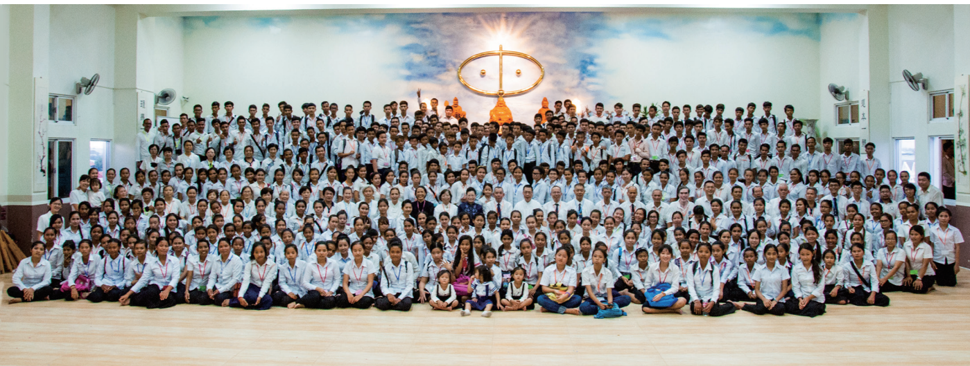
▲ 基礎忠恕柬埔寨幹部聯合法會大合照留影。

規，走向成仙作佛的路。佛規本是上天定，是道的表現，我們要學習尊師重道、承上啟下、相敬如賓，成為謙謙君子。另一堂課「持齋的意義」，講師說明吃素好處——培養慈悲心，讓很多眾生平安；遠離業障，讓自性恢復光明；脫離因果報應，從此六畜斷絕；使身體健康、養顏美容、延年益壽；躲浩劫避災難，拯救地球。