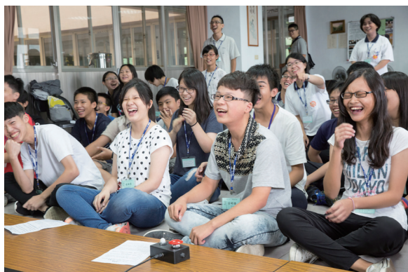
▲ 搶答活動，看誰勝出！

卻不見得享用得到；答題遊戲中，最高分的題目不見得難，低分的題目不見得簡單。活動就像人生的縮影：有挫折、有高興、有不圓滿、有處處驚奇的不確定性，短暫的兩天也經歷了一次相聚再分離，緣分稍縱即逝，只能嘆「離別容易再見難」。為此，平時更應該把握每一段機緣、每一次相聚；並且，不論笑容或眼淚，都要相信每段緣分都是上天最好的安排。