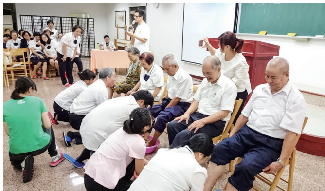
▲ 幫長輩按摩，洗足浴。

有一種情感是與生俱來，沒有條件；有一種愛是默默無語，綿綿不絕。我們最敬愛的前人輩及各位前賢們，他們的一生，為了道場、為了家庭、為了工作、為了這個世界，犧牲奉獻。感謝有這些前輩們一路走來的播種與耕耘，才讓後學們有機會走這條修辦的路，能徜徉在這個幸福的大道場，能有機會付出與了愿，一切的一切就只有感恩！讓我們一起抱抱身邊的長輩、前賢，讓我們每一個人的愛，在這個世界及道場，一直傳承下去。