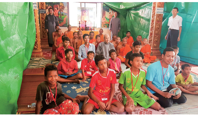
▲ 龍點傳師、辦事人員與新求道親合影。