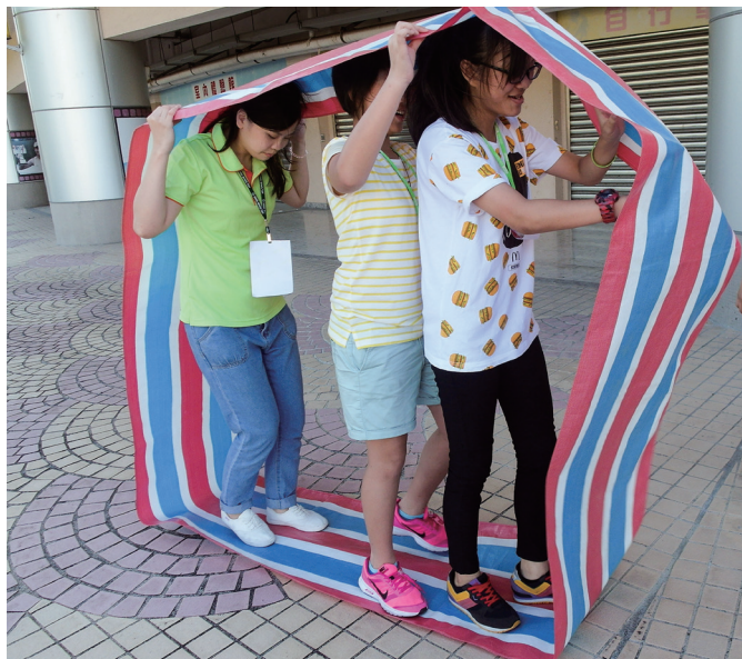
▲ 晨間活動，小組團結轉動風火輪。

非常的讚！我最喜歡的部分是營火晚會，因為不但可以噴彩帶，而且氣氛也非常好。這次是我第一次當小飛俠，真的非常好玩，如果可以，我之後還要繼續幫忙大家！