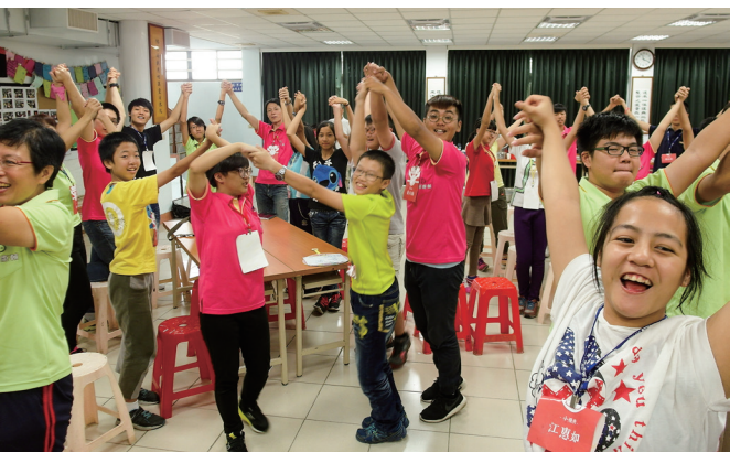
▲「災難的地球」課程，小組間踴躍地互動。

最後，祝福以後的營隊每次都可以圓滿成功落幕，大家也可以玩得開心且順利！充滿活力的夏令營，有緣再相見！