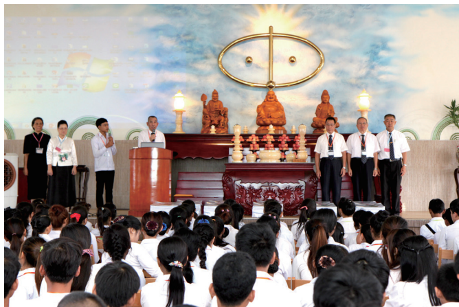
▲ 廖領導點傳師慈悲介紹主班點傳師。

一個肯定答案。隔天早上，依約定好的時間，她按時來報到，這點真的讓後學很感動！所謂「有捨才有得」，相信她暫時放下電腦證照鑑定考試，選擇參加法會，將來得到的福報不可思量。