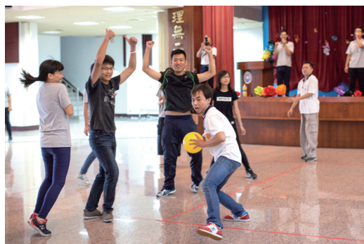
▲ 以年輕人喜歡的體能競賽，帶動營隊氣氛。

午茶之後，是體能競賽的大地遊戲——集體跳繩和躲避球，前者要一次又一次地練習，看看哪組可以一起跳 10 下？遊戲結束之後，勝者可以在晚餐 DIY 時，優先挑選食材：南瓜、蕃茄、高麗菜、菜梗、茄子……。哪樣是大家的最愛呢？不論拿到什麼食材，每個人都化身型男、型女大主廚，端出一道一道的創意料理。但是，等等！不能吃自己做的菜！一番競賽，重新洗牌，輸與贏？得與失？真是別有滋味在心頭。