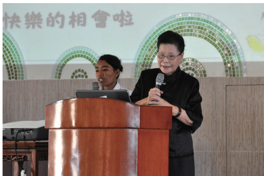
▲ 白阿美點傳師慈悲講述「禮儀風範」。

隔天上台之前，幹部們還一直跟後學說：「我們很緊張！」後學只給他們比了一個很棒的手勢，告知他們：「你們是最棒的！講師以你們為榮！」