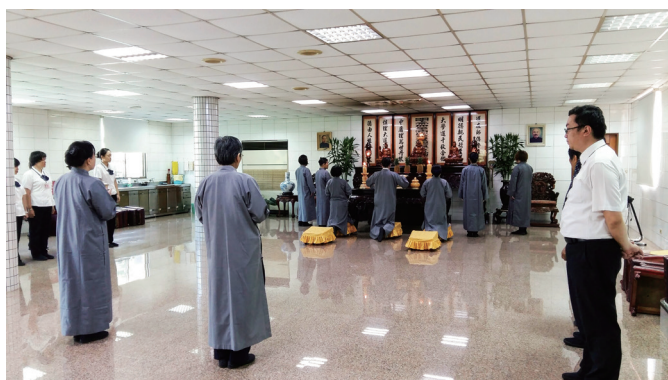
▲ 莊嚴肅穆的獻供禮。

後學修道前雖然會感恩，但心不夠誠敬；修道後，才算是真正懂得感恩了。道場每次只要播放歌曲〈母親的手〉，後學一定會忍不住流淚，沒