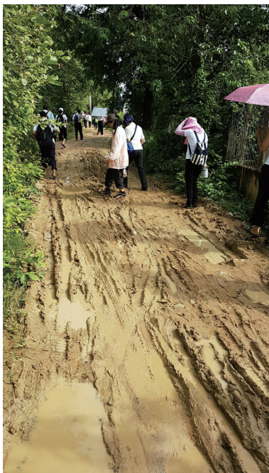
▲ 泥濘路，困難中才體會幸福與懂得珍惜。

這6天的柬埔寨開荒學習之旅，是後學出國旅遊以來，覺得最有意思、最值得紀念的一次！以前出國去旅遊，表面上玩得很開心，但是外國的風景一開始只是讓人覺得新奇，後來見多了就麻痺了，走訪那麼多景點，留下的只有後學「來過這裡」的印象，因為是走馬看花，因此沒有什麼感動。旅遊一趟下來，回家往往只覺得累，以及留下那看似豐收的紀念品。