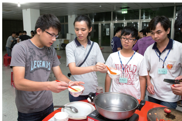
▲ 化身型男型女大主廚，創意料理嘗一嘗。