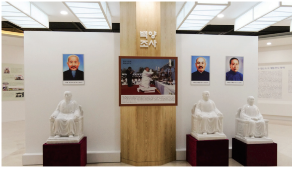
▲ 白陽三聖，闢道度化，眾生蒙恩。