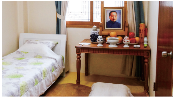
▲ 師母慈懷，永誌感懷，不敢或忘。

初金老前人到濟州島開荒辦道、闡述道義的地方，也是金老前人居住的法壇；法壇內備有一間師母房，供師母若來此可住宿用，只是有備而未用；師母成道後，仍保留下來作為紀念。由此也讓我們學習到：韓國道親對師母的尊敬，及對金老前人修道精神的崇仰，是多麼地誠摯啊！