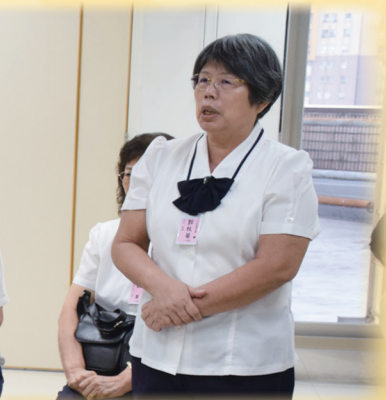
▲ (左)點傳師慈悲賜果。(中)座談會，道場年輕一代真誠分享。(右)分組討論，激盪彼此看法。