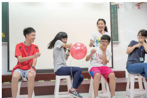
▲ 哇！汽球快破了？刺激又緊張。

的回顧影片，學員在螢幕上看到自己從報到開始，到各個活動時的特寫，興奮又感動；接著，學員上台分享心得，彼此感恩，並立下小小的心願。在〈如果我們不曾相遇〉的回顧影片中，歌聲又揚起：「那一天，那一刻，那個場景，你出現在我生命。從此後，從人生，重新定義，從我故事裡甦醒」（註2），兩天的營隊畫上圓滿的休止符。