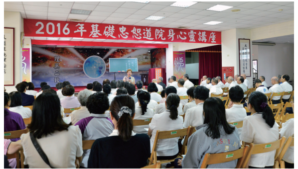
▲ 鄭法官講述與日常生活相關的法律概念。