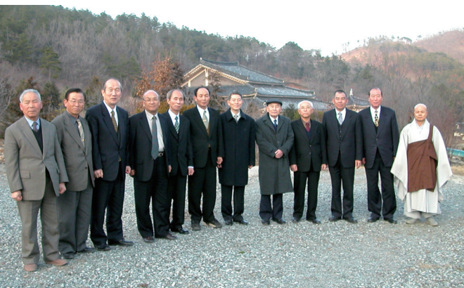
▲ 隨駕袁前人參訪韓國道場。

香。退伍後，在道場外的公司上班也有沒多久時間，之後老前人成立廣太公司，因此機緣又回到道場，至今沒再離開過道場，因為所有時間都在道場上服務。民國 63 年（1974），老前人成立青年班，之後機緣成熟，後學去了菲律賓，一待就是十多年。後來也曾經到美國去。從小開始就一直在道場上，工作是在道場設立的公司，下了班也還是在道場上服務。」