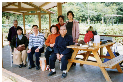
▲ 蔡點傳師、方文華點傳師（左3）和道親聯誼。