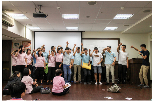
▲ 以 rap 方式表達要達成的年度目標。

第三組是「拿出數據有誠意」的目標：(1) 聯誼至少 3 次。(2) 每次上課穿制服 100%。(3) 全組一起過班。(4)