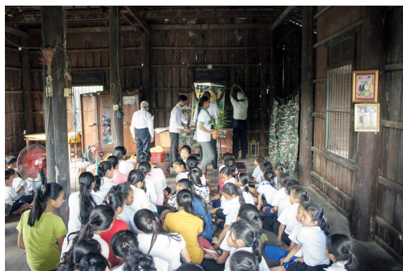
▲ 安靜等待臨時中堂架設的新求道親。