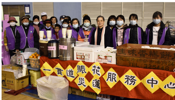
▲ 於賑災服務據點提供各式飲品、餐點。

回到家時已是凌晨時分，距離 2 月 6 日花蓮大地震已經超過 24 小時，但深夜的花蓮餘震不斷，仍籠罩著一股不安和灰暗的氛圍。