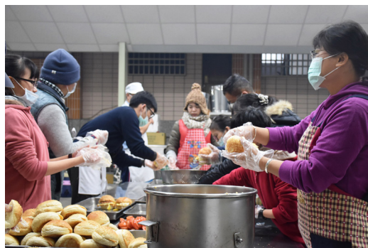
▲ 清晨就到慈懿道院準備元氣早餐。