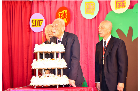
▲ 大人者，不失其赤子之心。

後學心裡想著：「這真是一個有趣的問題：『前人做D.J.？』這未免太大材小用了吧！這不是搶了榮隆學長和後學的飯碗嗎？」但後來又想回來，其實身為基礎忠恕道場領導的大家長們，一舉一動不也都是牽動著每位道親的心？他們總是以身示道，以淺白的話語囑咐、教導著道中每一位佛子——修道要老實、行道要切實、