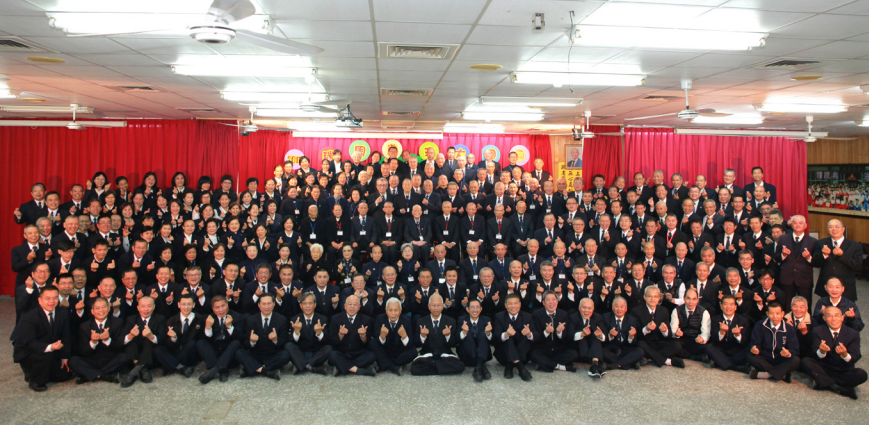
▲ 瑞周歲末團圓餐會，陳前人與點傳師暨新舊任道務助理合影。