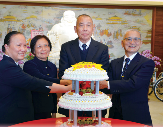
▲ 益新單位點傳師們共襄盛舉。