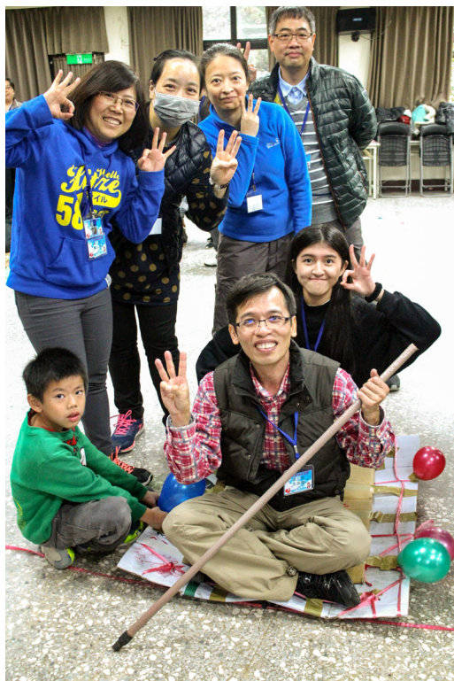
▲ 小組發揮創意，齊力建造法船。

上天看到大家的用心，這次青推成長營特賜戶外活動當天不下雨，讓我們不用淋雨，順利進行闖關活動，感恩上天慈悲！也很感謝負責參與規劃營隊的每一位學長，花了很多時間與精力策畫，你們真的很棒，這兩天來的感動深深刻印在後學腦海裡，我愛你們，你們是 上天老中的乖寶寶，也是天達的希望，天達有你們真好！