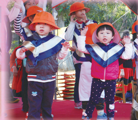
▲ 社區親子讀經班天真呈現動唱表演。