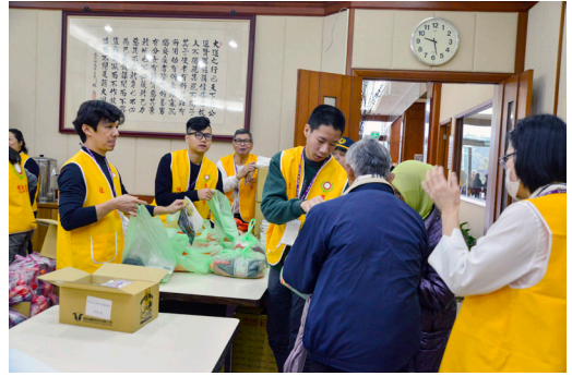
▲ 志工們整理好物資並為年長者服務。

「行善不是注入一滴水，而是燃起一盞燈。」忠恕道院每年辦理冬令關懷活動，除了讓鄉親過好年，更希