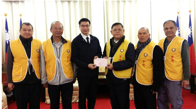
▲ 中華民國一貫道總會捐款給花蓮縣政府。

服務據點放滿了來自各地的滿滿愛心，有許多蔬果和供餐設備。距離不到 100 公尺，便是傾斜超過 45 度的雲門翠堤大樓，來自不同縣市的搜救人員、各家電視台的 SNG 車，還有許多居民皆關切等候。晚上 23：30，蒸籠中的粽子傳出陣陣香氣，薑茶和熱湯已經準備就緒；道親們用手推車推向雲門翠堤大樓周圍，逢人便道出關懷，也分送出暖心餐點和滿滿愛心。