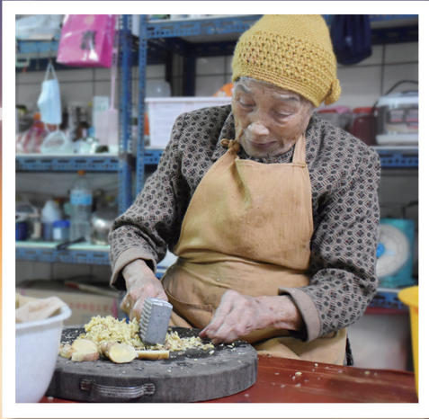
▲ 道親用心準備餐點。 ▶ 深夜中，以薑茶和熱湯送暖。