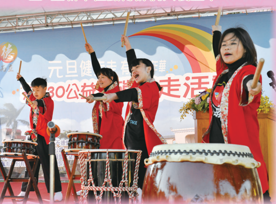
▲ 震天鼓聲熱鬧開場。