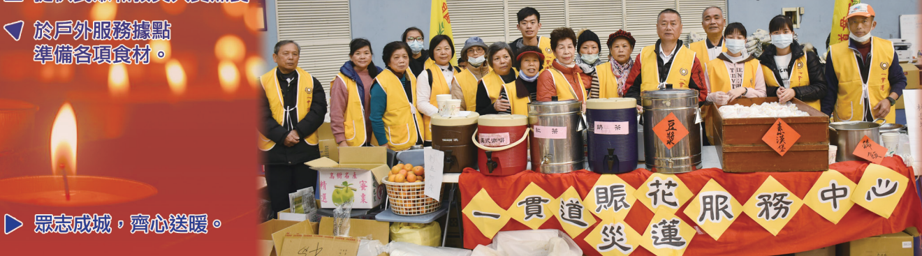
▶ 众志成城，齊心送暖。