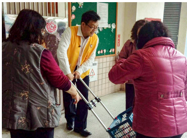
▲ 服務學長熱心協助里民。