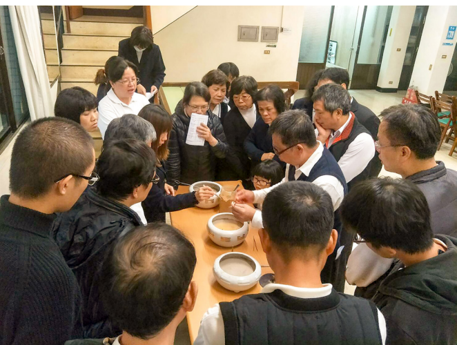
▲ 學習平爐和起八卦爐。