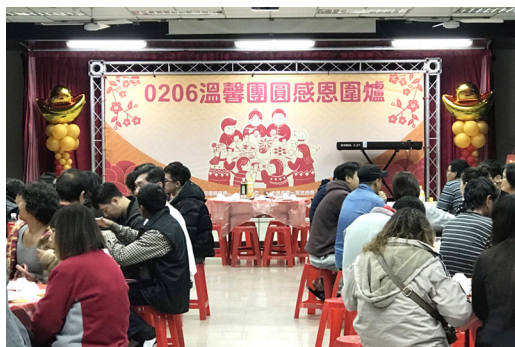
▲ 邀請受災戶溫馨圍爐。

由花蓮縣政府主辦，中華民國一貫道總會、花蓮縣一貫道協會協辦，原預定辦理素食宴席50桌，因多數受災戶選擇前往親戚或朋友家中一起圍爐過年，最後於勞工育樂中心席開25桌宴請受災戶一起溫馨圍爐過除夕夜，過程中得到非常多的肯定與讚賞。陪著受災戶一起用齋吃年夜飯，也希望大家都能感到溫馨。