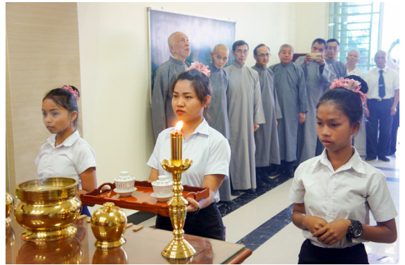
▲ 當地人才道氣充沛地展現禮儀風範。

大家開始忙著掛號、填表、設臨時中堂，然後開始獻供、請壇，明德中堂的辦事人員很有效率地進行著。這一天，乾坤合計共有100人求得寶貴的大道；禮節人員、辦道執禮、三寶的講述，全由東國道親一手包辦完成。大道要在一個地方宏展，不是沒有原因的，天時、地利、人和都必須具足，從這一場下鄉辦道可以看出，仙佛的慈悲已經展現在世人面前，我們唯有努力跟上仙佛的腳步，全心幫辦道務，才不枉費自己在道場多年的學習，與前人、點傳師們苦心的栽培。