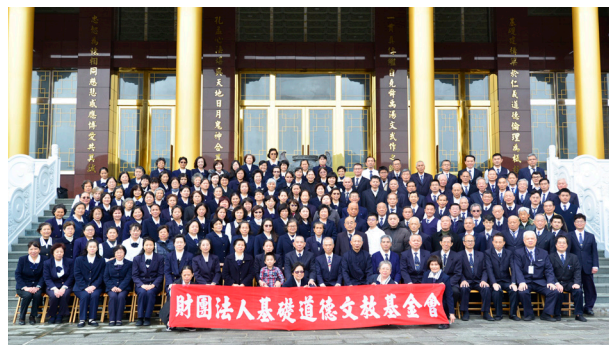
▲ 基礎忠恕學院初、中級部輔導法會於祖師殿前留影。