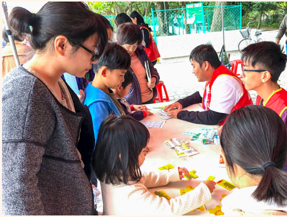
▲ 最吸引小朋友的闖關活動。

踩街隊伍更有多人身著道袍、旗袍等，讓人有古今交錯的感覺；爸爸、媽媽牽著自己的小狀元遊街，笑得興高采烈。本屆也特別邀請花蓮洄瀾詩社大師王鼎之、蔡政達等書畫名家前來揮毫，為讀經會考增添了文雅風氣，吸引大批民眾排隊求墨寶。