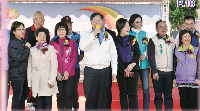
▲ 桃園市鄭文燦市長蒞臨致賀詞。