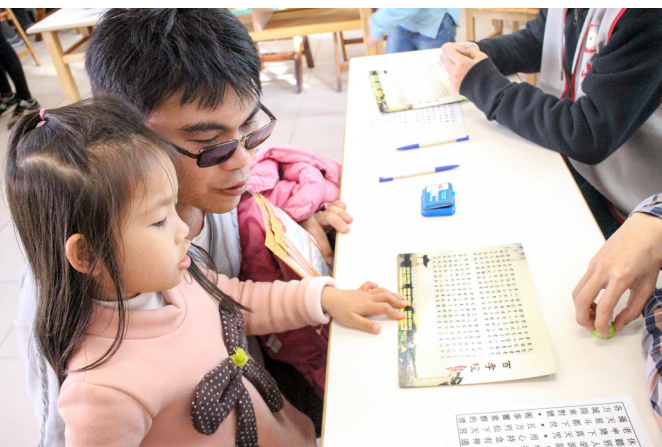
▲ 親子讀經也展現學習成果。

可抵兩關；另外，報到檢錄時出示環保餐具可抵一關；總共十二關。當日求道者、擔任引保師或服務志工可抵七關；集滿四個承辦單位的活動紀念章可抵一關。十一點前，集滿闖過七個關，即可參加抽獎！