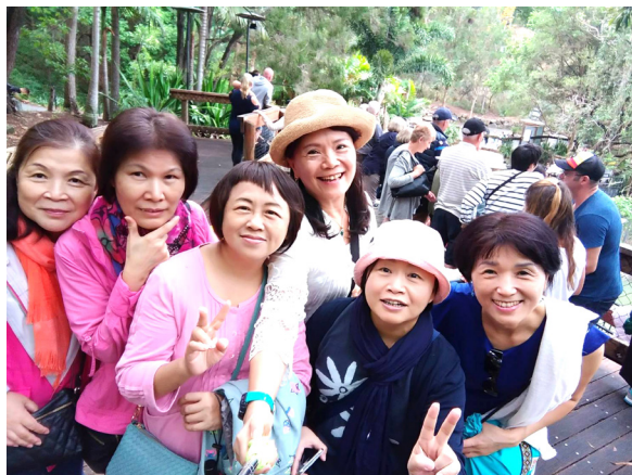
▲ 歡喜結伴，同行澳洲。

鱷魚，也有去 OUTLET 逛逛，剛好是打折季，有的服飾才澳幣 5 元、10 元，大夥都買得非常開心。好天氣就找景點遊覽，如拉明頓國家公園也很棒，雖然後學已去過二次了，卻依然有不同的新鮮感受。