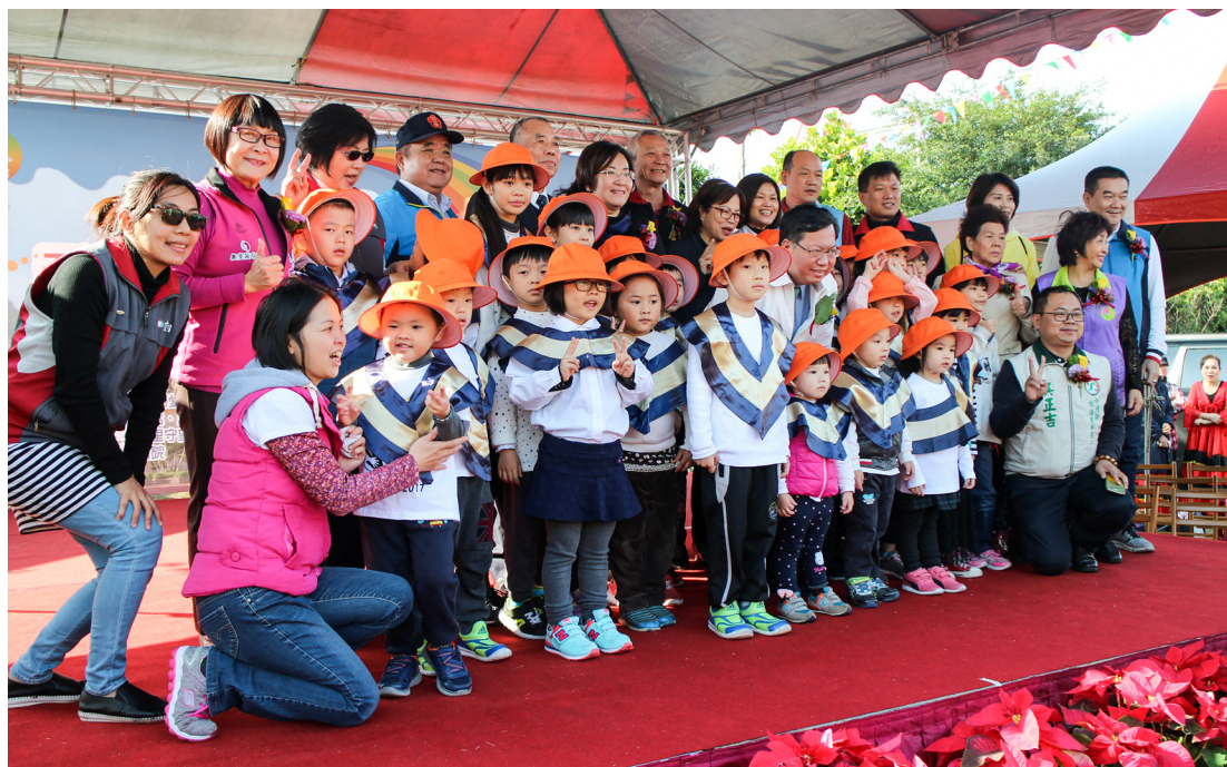
▲ 桃園市長鄭文燦先生也應邀參加，歡喜與大家合照。