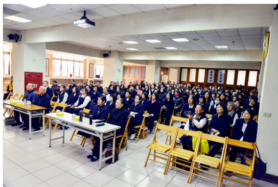
▲ 聚精會神吸收社福志願服務推廣經驗。

21 世紀是多元文化時代，度人與成全的方式需要轉型。杜點傳師強調，做公益能透過專業訓練，拿學分進修、實習 400 多小時，成為正式的社工（專業的助人工作者）。政府於民國 90 年（2001）頒布志願服務法，足見公部門重視社福區塊，已然成為國際趨勢。天元慈善功德會已於民國 91 年（2002）向當時的台北縣政府備案，基礎忠恕道場也有 2 個單位備案，道場響應政府政策成立志工隊，一來可培訓道場志工，接受嚴格評鑑，邁向專業。二來善用並結合政府資源與補助，可謂雙贏。