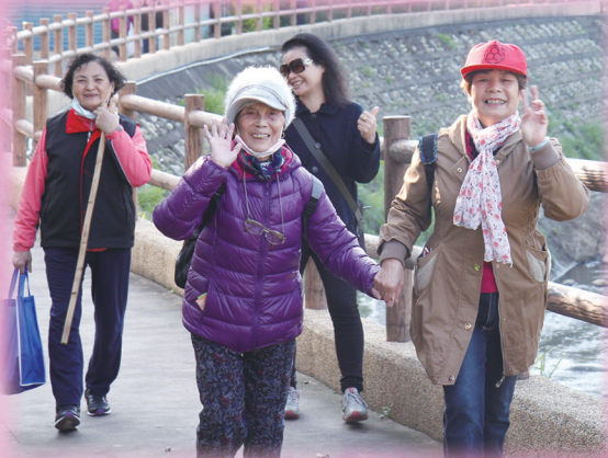
▲ 鄉親們歡喜參加健走。