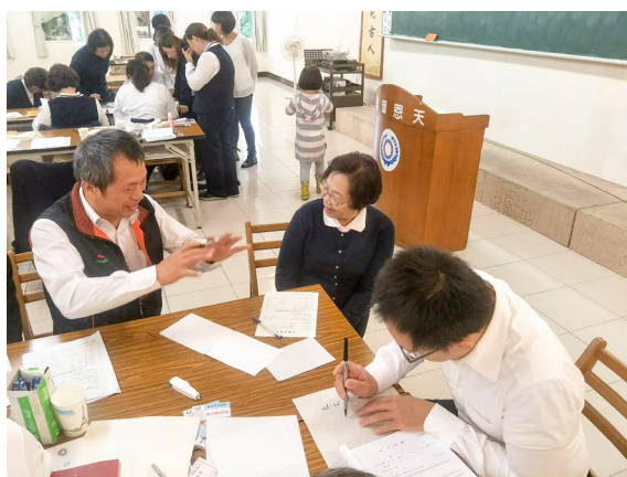
▲ 學習與新求道人應對及道義開示。

感謝 天恩師德、祖師鴻慈，後學入道場以來這些年，一直接受點傳師、講師，及輔導學長的愛護，學習了很多做人處事的道理，及道場上各種角色的輪換。後學真的非常開心能有這麼好的緣分，在這個班上共同學習成長。明年開始，換後學有可以付出學習的機會了，心情很喜悅，但也很惶恐，擔心自己的不足，誤導了新學員對道的信心；所以後學提醒自己更要提起十二萬分的精神，保持謹言慎行的態度，希望能在輔導新學員的同時，也提升自己的能力。當然，想到點傳師、講師，還有其他的輔導學