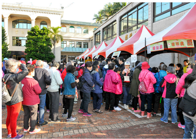
▲ 社區里民現場踴躍報名。

活動當日，益新單位邀請忠福、幸福、永福、水尾等四里里長協辦，安排健走活動；外出天德堂健走，也