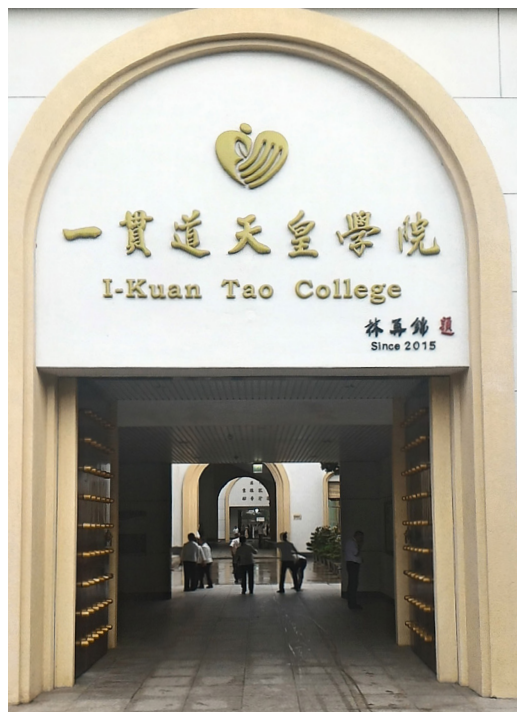
▲ 各道場成立一貫道學院，帶動學術研討風氣。

目前台灣的社會，似乎還未有社會團體能像一貫道道親一樣，願意常常回到道場接近善知識，後學覺得這就是「道」的寶貴，也為目前動蕩不安的時代，多了一股淨化人心的推力。