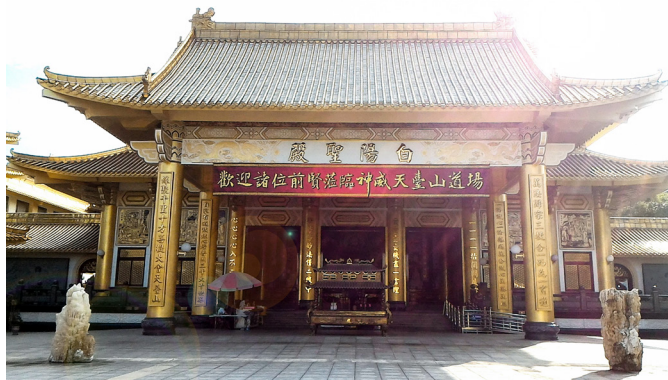
▲ 學術研討會假神威天台山場地舉辦。