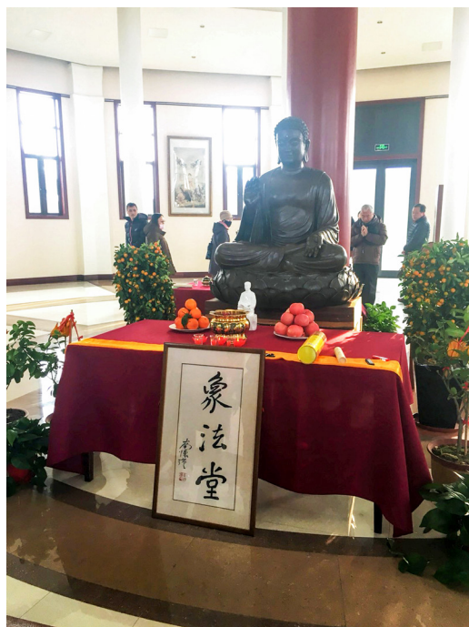
▲ 莊嚴宏偉的象法堂。

我常常逃避未來畢業後的工作問題，但在這次的研習營結束後，我想我有了一個新的答案，那就是「推動讀經教育」，正如同小時候參加讀經班一樣，期待未來能有更多的讀經班成立，讓小朋友們了解傳統的中華文化。