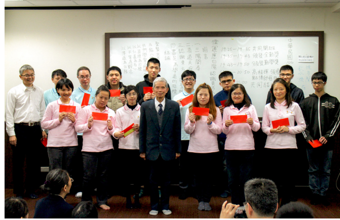
▲ 高領導點傳師與獲得全勤獎的同學合影。

以前的修持法門和現代不同，現在由於是三期末劫，天時緊急，上天老中慈悲，道降火宅，讓我們能夠在家修，修持儒家的法門，也就是「修身、齊家、治國、平天下」。