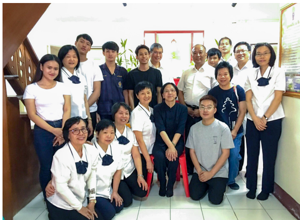
▲ 與清萊天惠中堂駐壇大學生合影。

傍晚時，我們到了清萊天惠中堂辦道。這個中堂的特色是，有三位學界乾道大學生駐壇，不但要包辦所有中堂的燒香、清潔、三餐、道務運作，而且還要協助每年中小學生的夏令營活動。