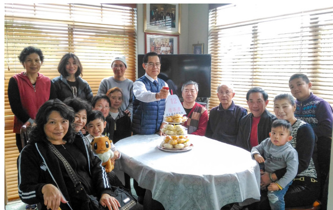
▲ 道親齊聚歡慶13週年慶，法喜合影。

師擔綱籌組成立「奧克蘭忠恕道院」，經海內外各地前賢、道親的慈悲護持圓成，不僅遠自台灣以長型貨櫃寄送中堂的各项用品，每年林點傳師也以入境簽證可居留的最長時間駐壇在當