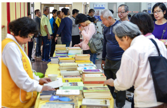
▲ 春季自由祭拜期間，贈送善書結緣。