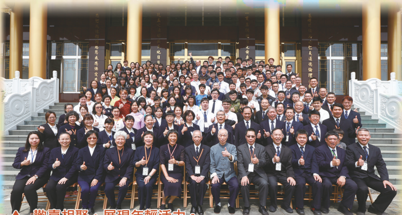
▲ 歡喜相聚，展現年輕活力。