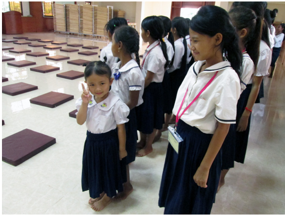
▲ 心純意淨，小小菩薩來中堂學習。