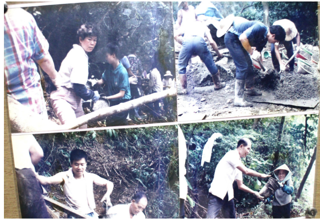
▲ 建設過程中，不畏辛勞，眾志成城。

司機先生先利用車子在磚頭上面反覆地輾一輾，讓磚頭碎掉，我們再把它拿來將路填補鋪實；下一次來，我們又鋪好了一段路，他又輾一輾，這樣把 5 公里的路都鋪起來了（從光明禪寺到天道清修院這段）。最下面第一層是大塊石頭，第二層磚塊，後來還去要高速公路人家刨起來的那些柏油來鋪，這條路就是大家這樣合力去做。