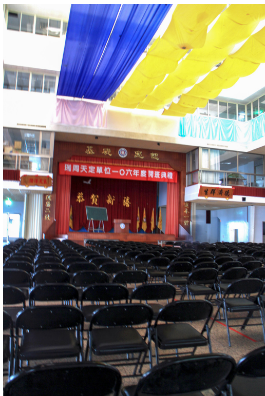
▲ 以布幔吸音，節省下非常多的經費。

但這種形式的建築是有缺點的，因為形狀像煙囪一樣，聲音不容易出去，所以在中間聽不清楚。我們曾經請人來設計，想加設隔音板，沒想到報價竟要 480 萬；但錢沒有那麼多，我們也沒有對外募款，所以就沒有採用這個方式。後來有一次我到馬來西亞一家飯店，看到裡面有很大的餐廳，中間用布隔起來，可以把聲音吸掉；回來我就比照這個做法，花了幾千塊錢，拿布幔隔一隔，這樣就可以聽清楚聲音，也省了 480 萬。