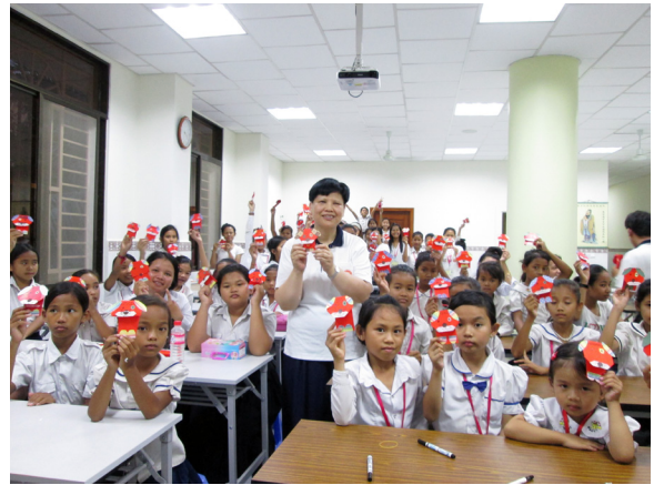
▲ 歡樂學習「狗來旺」勞作。