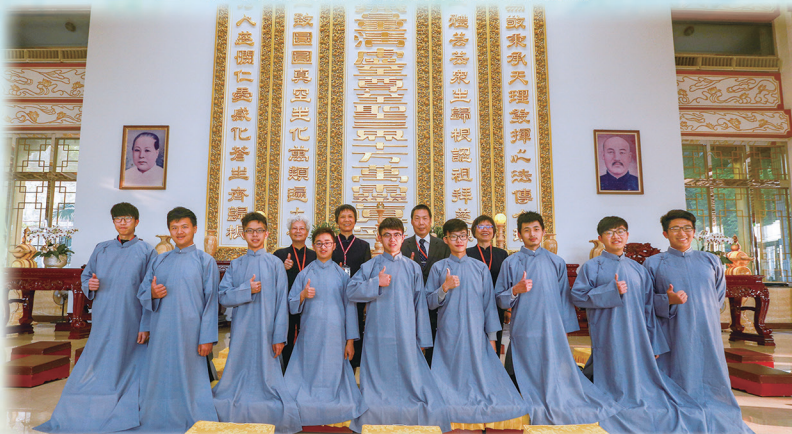
▲ 青年學子負責執禮。