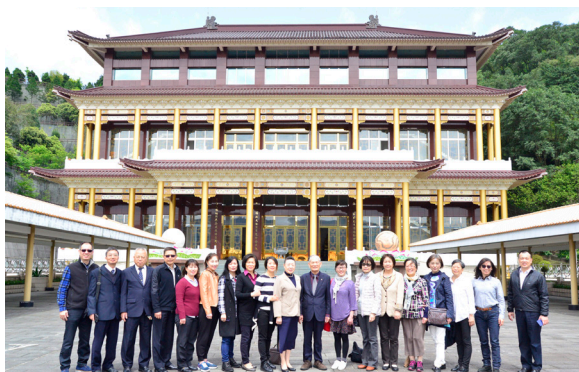
▲ 瑞周全真天儲單位日本道親參訪忠恕道院留影。