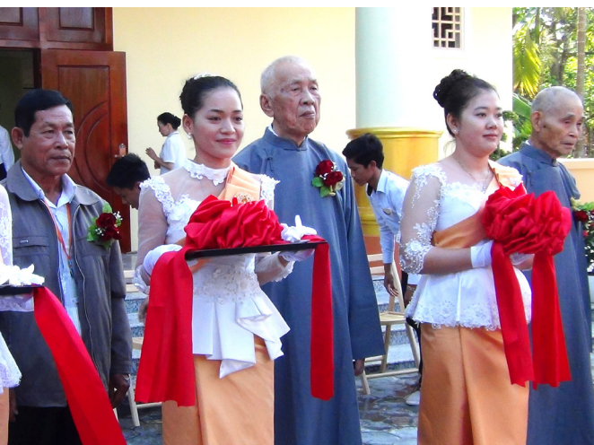
▲ 黃總領導點傳師及貴賓們剪綵。

緊接著，柬埔寨當地 7 個中堂共計 9 項表演節目，是整個活動的高潮；參加演出者無不使出渾身解數，賣力演出，或呈現中華文化的風格，或展現柬埔寨文化的特色，非常精彩，讓人驚豔不已，且博得與會來賓好評。