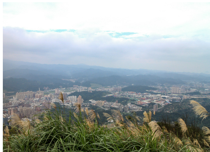
▲ 登高望遠，視野良好。

燒茶後，道親們都會很親切地將茶水送到人家手裡。我們準備 10 鍋的爐子在那邊燒，這麼大一桶的茶水，要煮開沒那麼快，所以後面一直燒茶，前面一直供應，人群常常排了一整排。可以服務這麼多人，道親也很高興，大家都不會感覺到累，反而覺到很趣味。後來我統計，登山的人之中，大概會有 7 成 8 左右來喝我們的水、薑母茶等。