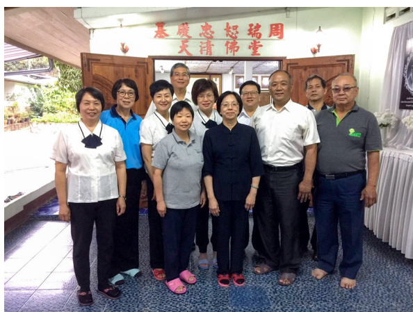
▲ 泰北的據點：天清中堂，由此再到附近的學校進行中文教學。

因為3月份是學校結業時期，所以在兩校剛好都碰到成果發表會；我們觀賞了濃濃民俗風的佈展及表演後，就開始教學活動了。在善甘學校，我們安排了6個班（小學、初中各3班），後學和蔡兄被安排教小學部四年級。上課中有一段小插曲：後學結束了上次進度的複習之後，接下來的時段是利用字卡教新字彙，後學就請蔡兄來教字彙；結果蔡兄跑去桌角看教案，後學當下心裡納悶他為什麼還要去查教案，就對蔡兄說：「不用看了啊！請直接教字彙啊！」蔡兄就走過來開始教。