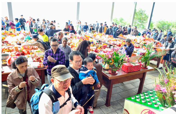
▲ 清明祭祖，誠表孝思。