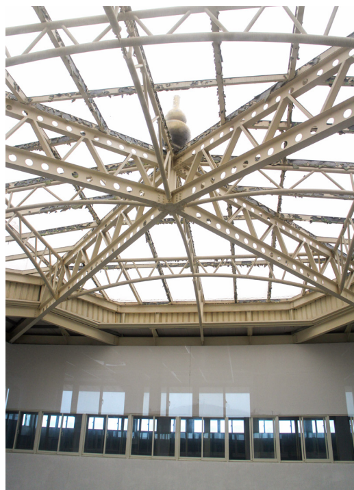
▲ 講堂的設計充滿巧思，採光優良。

我曾經去過羅馬，看過萬神殿，我想：「在幾千年前，沒有鋼鐵，也沒有水泥，萬神殿只用石頭堆疊起來，