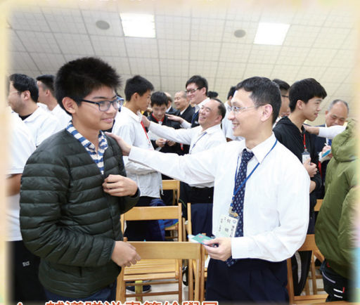
▲ 輔導贈送書籤給學員。