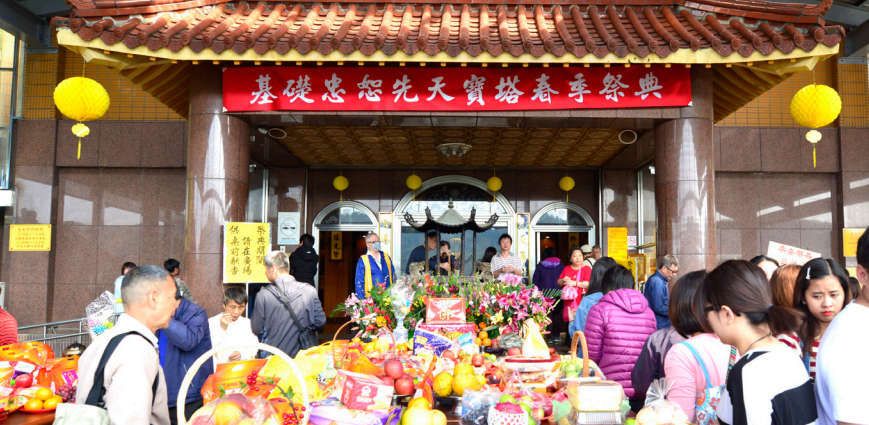
▲ 先天寶塔春季自由祭拜，緬懷與感恩。