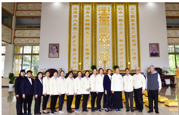
▲ 明光道場前賢於中堂合影。

基礎忠恕先天寶塔 3 月 19 日至 4 月 5 日舉行春季自由祭拜，共計超過 26,000 位寶眷、道親參加。