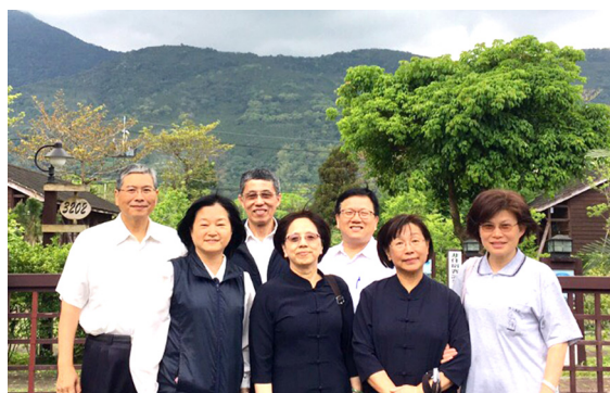
▲ 兩位點傳師及學長們在花蓮留影。

每一次了愿行，都是上天莫大的恩賜，背後要有多少的善因緣和合，才能成就一趟了愿行；所以後學心中有無限的感恩，感謝天恩師德。了愿過程中，點點滴滴都是在學習，藉事練心，累積成為轉念的正能量；時時觀照內心的善與不善，進而改毛病、去脾氣；透過不斷內化的過程，何時能達到一念不生，而後萬善相隨呢？！