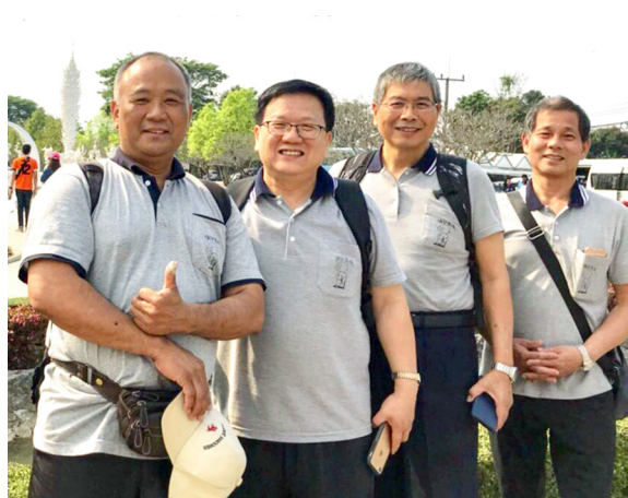
▲ 快樂的修道人，歡喜了愿。

差不多了吧，就聽到有學長喊：「要進中堂辦道了！」心裡真高興：「Good timing!」當時就體會到，平日應該多充實自己，才有機會扶圓補缺啊！當天辦了上百眾，辦道後下午就是燒烤活動，真是個印象深刻的大日子！