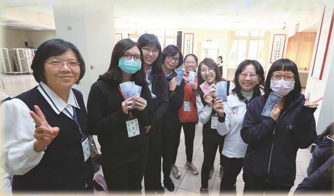
▲ 小組討論時間，互動熱烈。