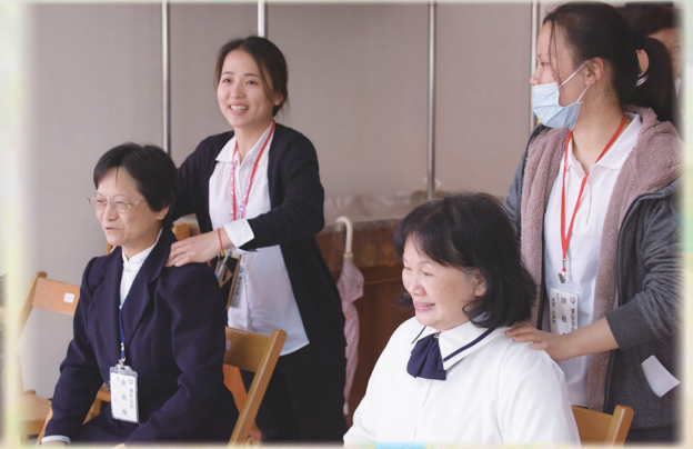
▲ 學員透過服務表達感恩之意。