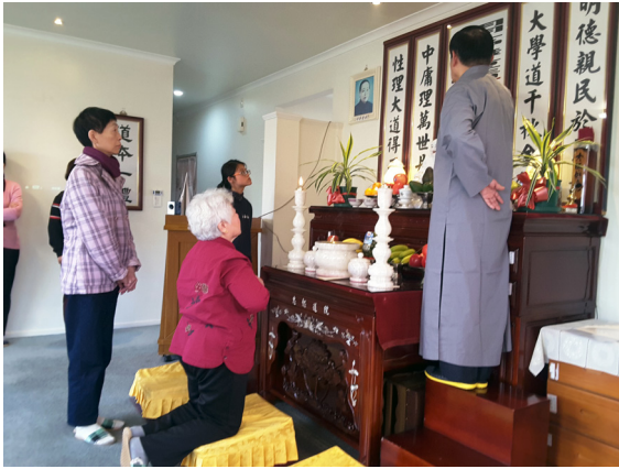
▲ 2017年，歡喜眾生上法船。

地開班成全，道親日益增多；期間並有台灣各地前賢、各單位道親慈悲前往駐壇幫辦，或者護持3個月（觀光簽證入境每次只能3個月），或者運用工作的年假、寒暑假期間飛往旅駐講課，一連串的各種美好牽成，促成了今日的堂慶因緣。感恩一路以來幫辦的前賢、道親們，讓奧克蘭忠恕道院矗立在紐國領土上續揚道幟、共成白陽法航。