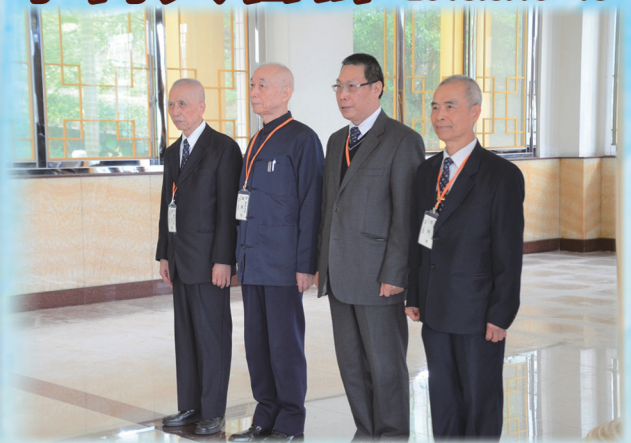
▲ 領導點傳師與點傳師們護持活動。