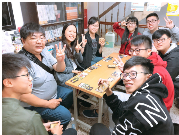
▲ 小組聯誼，增進彼此感情。

我們都很年輕，總覺得「道」離我們很遙遠，有些人則覺得，宗教這件事情，等老了再說……。若推估未