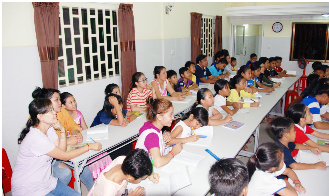
▲ 中文教學，引度更多有緣人。

4 月 26 日，時間過得真快，轉眼 6 天時間已到尾聲，要回台灣了，有些不捨！心中同時想到：這麼多人要來求道、這麼多人要學中文、這麼多人需要成全……，培訓當地人才是當務之急，語言不通的我們，必須靠著當地人才翻譯方能辦道。而眼前點傳師、辦事員不能不回台灣，雖然深感欲罷不能，沈思了一下，下次再來吧！後會有期！