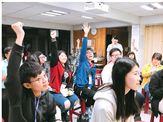
▲ 學界班上課時非常熱絡。

「人生當中有沒有發生遺憾？」當然有，但過去已經不能改變了！可是以後的事情，是自己就能夠掌握的，