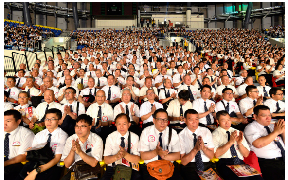
▲ 道親們歡喜參與一貫道總會成立 30 週年感恩大會。