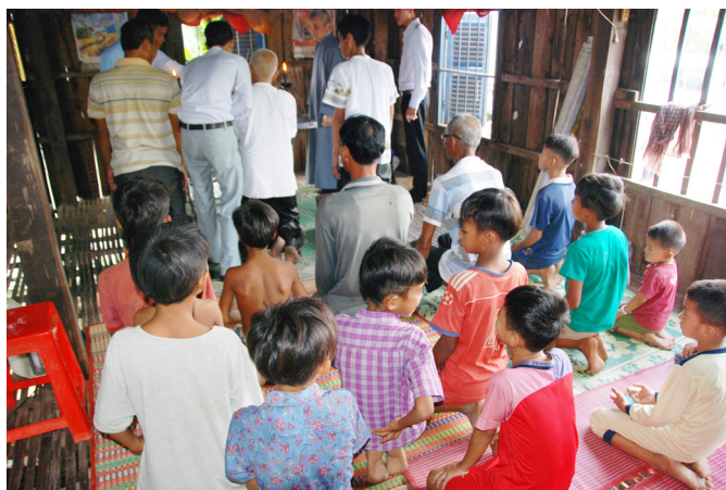
▲ 下鄉辦道，度得許多善良的東國道親。

抵達當地人才的家鄉後，先安設臨時中堂。臨時中堂的屋主好法喜、好真誠，非常歡迎我們的到來，還去家旁採了花草來供佛。有緣的左鄰右舍、阿公阿嬤、大人小孩……，我們