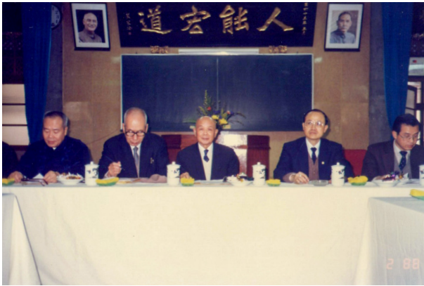
▲ 一貫道總會籌備會，開啟嶄新一頁。

當時陳博士任職中央黨部副秘書長，加上陳博士的學生——林鈺祥、蕭瑞徵等人聯合了 40 個立委簽名，冀一貫道合法傳道；更重要的是蔣經國總統開化、開放，終於在民國 76 年（1987）由內政部長吳伯雄宣布一貫道正式解禁。