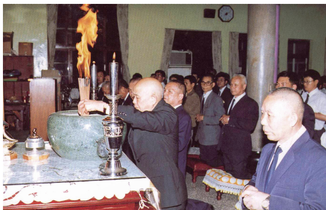
▲ 民國 83 年（1994），在先天道院舉行甲戌年大懺悔班，老前人率道親焚香叩謝天恩。