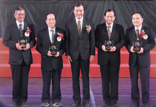
▲ 蘇院長和各道場領獎代表合影。