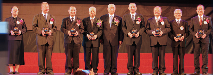
▲ 王理事長和各道場領獎代表合影。