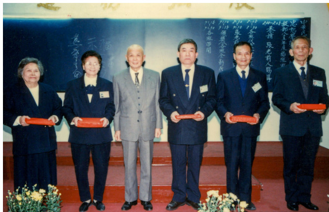
▲ 民國 86 年（1997），忠恕學院基隆分部結班典禮，老前人慈悲親臨頒發全勤獎。

要不要一道跟著去？後學那天剛好有空，就一起去面見老前人。因事先已連絡，老前人知道我們幾個人會去，早早就將拖鞋擺好放在門口。待我們一到，老前人就親手拿了拖鞋要給我們穿，大家嚇壞了，也慌了，怎麼能讓老前人為我們這些小後學拿拖鞋呢？一陣忙亂之後，總算進到了屋子。