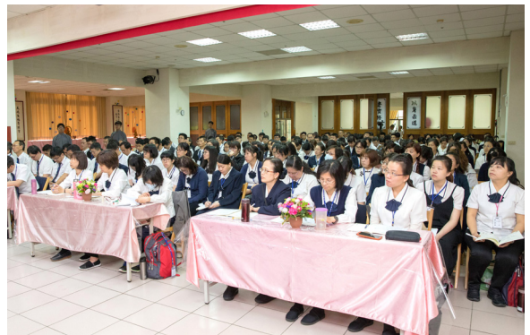
▲ 講師法會中，專注聆聽點傳師們分享開荒歷程。