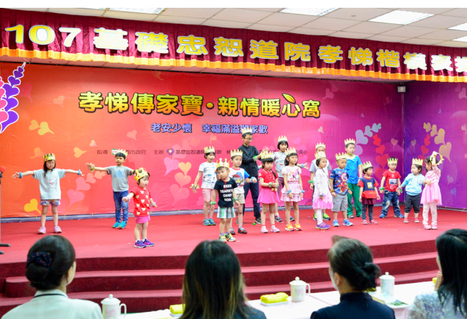
▲ 讀經班小朋友，朗朗清澈的讀經聲。