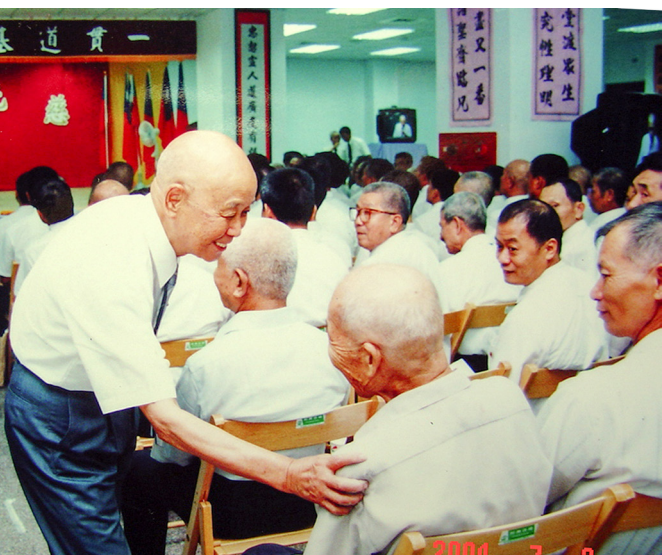
▲ 老前人關切道親，開班時間候成全。

如嬰兒般純真的笑容（老前人的眼都眯了），那樣地自然忘我、天真燦爛，如同一朵鮮花綻放一樣，慢慢地開展，愈開愈大，開到極致；然後才又慢慢收斂回來，回到最初的面貌。