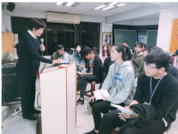
▲ 魏點傳師講述人生真諦，帶來許多省思。