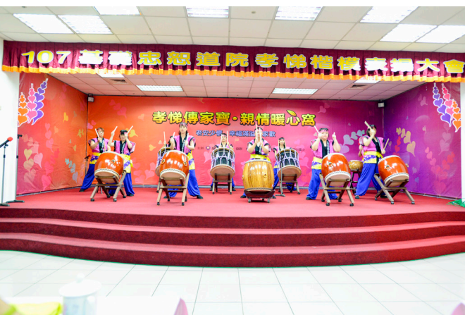
▲ 心燈太鼓隊，氣勢磅礴的鼓聲開場。