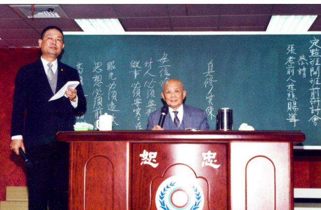
▲ 老前人不求安樂，心心念念只為道務發展、眾生離苦。

邊，彎下身來，邊小聲地問後學說：「星期天早上的課（青年班）你都能來嗎？」當時是怎麼回答老前人的，後學也不敢確定，大意是：「後學一定儘量！」因為後學那時在中油上班，屬於輪班制，不一定每個星期天都能排出時間來，但老前人的一番心意，後學是瞭然於心、銘感五內的。這之後數十年的學道生涯，後學都儘量排除私事、克服萬難，為的就是不想讓老前人失望。這除了感謝上天，也感恩老前人的慈悲成全呀！