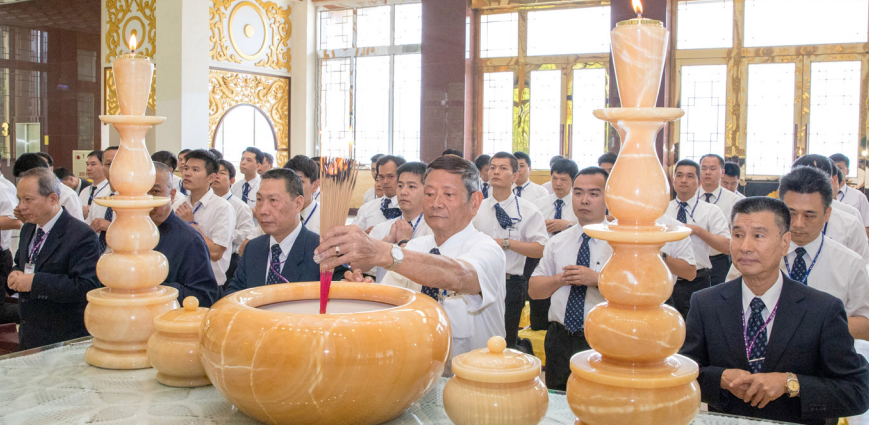
▲ 心靈成長班講師法會，誠心叩懇，表明愿力。