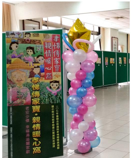
▲ 展覽孝親繪畫比賽得獎作品。

更恭喜獲獎的孩子！他們不凡的孝悌表現，還有卓越的畫作，將「孝悌精神」生動且傳神地詮釋出來，讓我們感受到生命、親情間，自然流露的溫情傳遞。由衷感謝桃園市各級學校老師、社區讀經班的配合與推廣，推薦孝悌學生及鼓勵孩子創作並集結作品，共襄盛舉。得獎的喜悅是一時的，落實孝行才是長久。大家的用心和支持，以及對孝道的推廣，讓本屆活動圓滿成功！我們明年五月再見！