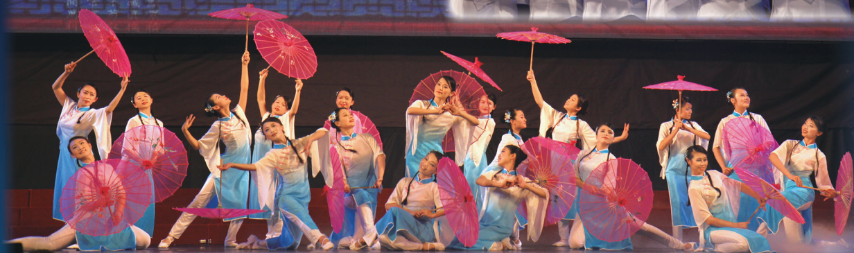
▲ 各道場熱烈參與感恩大會表演，共襄盛舉。