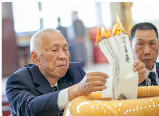
▲ 法會第一天，黃總領導點傳師帶領所有點傳師、講師叩求。

的未來」，是前人輩心心念念的，而基礎忠恕的未來也繫在你我的手上，在聽完點傳師們的開荒心路歷程之後，我們都下定決心要為道走出去，一同承擔屬於我們的使命。