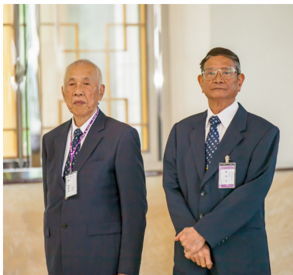
▲ 道範德行，大德坐鎮。

法會中，劉領導點傳師慈悲賜導「法會因由」。提到所有人在求完道、聽完三寶後，就已經開佛知見，希望講師們都能自我要求、自我提升，要「引迷入悟、開佛知見、轉識成智」。天時急緊，以前老前人常說：「不會的趕快學，學會了趕快做。」講師們目前都是聖凡兼修，但最終仍須重聖輕凡；內聖修道以承先、外王辦道以啟後，有辦才有德；把握時機，以度人成全為本業。劉領導點傳師還講述一個故事：一位退伍老兵，以撿資源回收為生，有一天撿到了一捆美鈔，但不知其作用而將美鈔貼在牆壁上，