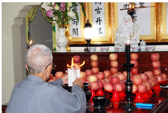
▲ 天恩師德加被，讓辦道順利圓滿。