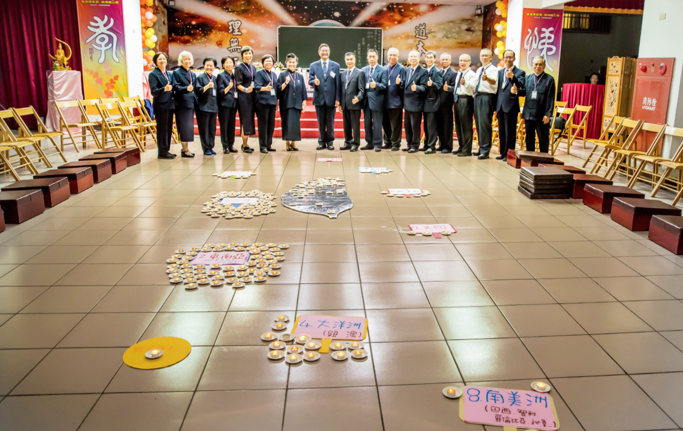
▲ 大道普傳，忠恕大法船道開四海，啟航！

兩天中，後學對開荒更具體的認知，也瞭解海外開荒絕非空口白話地粗率，必須要有真才實學。有道：「運籌帷幄，始得決勝千里」，海外開荒無疑是道範的具體展現，但在之前，後學覺得更要先開自己的荒，初入道場第一堂課——「三寶」所提：「明師一指的所在，是我們的方寸寶田。」若將寶田比擬實際，以種植維生的農夫豈敢任野草恣長，定會無時無刻加以照護，而「有土斯有財」，生活若有不便，認真耕耘的成果，亦將是最實質的保障；反之，自身方寸寶田未能勤照拂，寶田變成荒地，那就枉費了「人身難得，佛法難聞」的因緣。