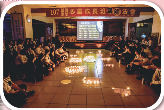
▲ 講師晚會，忠恕飛揚，道開四海。