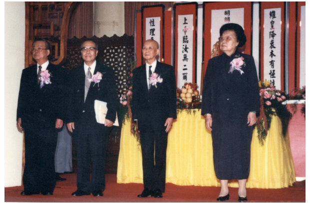
▲ 民國 87 年（1998），一貫道總會承辦中華民族青年子弟成年禮。

一貫道弟子如何落實祖師心願？我個人以為，最重要的是「反求諸己」。我們現在辦道辦久了，就以為