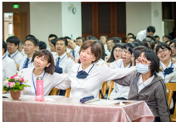
▲ 殊勝的法會因緣及力量，讓講師更凝聚。

開荒的首要，就是要為自己的心開荒，把自己心地的那塊荒地，好好地開墾出來，而不是在因循怠惰之中，為自己的放逸尋找藉口。「基礎忠恕