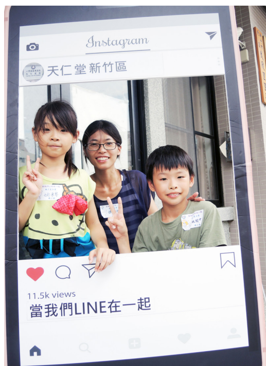
▲ 當我們 LINE 在一起，親子打卡板前合影。

總有放不下工作及家庭的時候。家長們平日裡日理萬機地工作、假日陪伴家人休閒娛樂，孩子們也適應著平日要寫功課、假日還要補習的窘境。網路時代，資訊席捲而來、流通快速，且便利取得，不知不覺中已經影響了我們的心靈成長，讓人們忘記了儒家的修齊治平、為人相處之道，與釋家平靜的禪定涵養。所以我們今年特別訂定了「當我們 LINE 在一起」親子夏令營，跟我們的讀經班家長們、心靈成長班的大朋友、小朋友們一起分享與學習，放下智慧型手機，看看身邊的孩子們最真實的模樣。