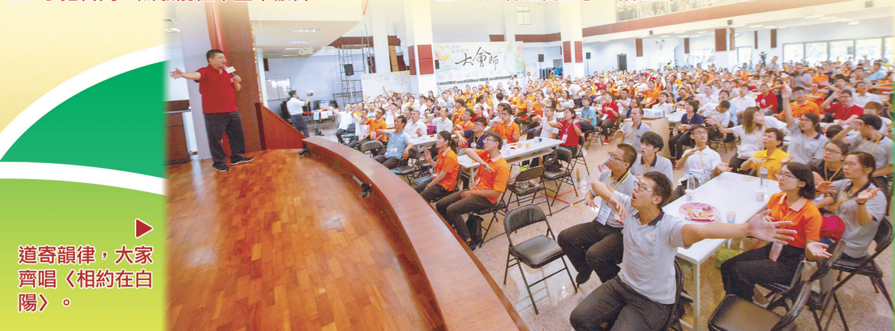
▶ 道寄韻律，大家齊唱〈相約在白陽〉。