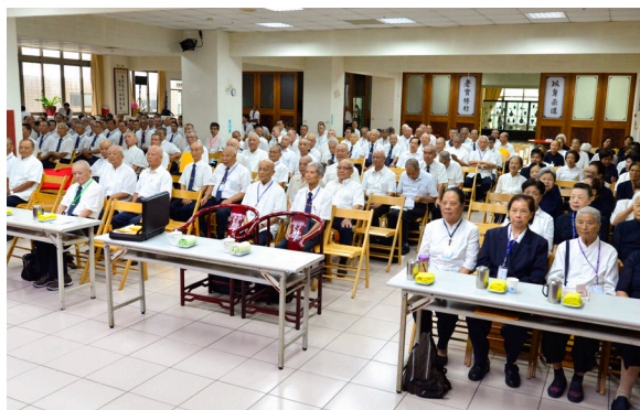
▲ 基礎忠恕道院107年度道親大會一景。