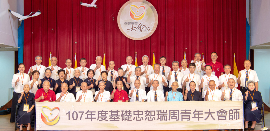
▲ 瑞周青年大會師，瑞周八單位齊聚彌勒山天道清修院。