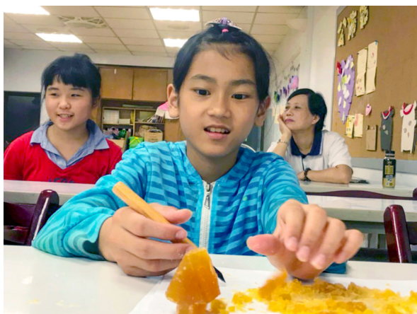
▲ 只需要提供雕刻引導，小朋友創意多多。

但是希望小朋友在體驗中「做中學」，在做與學中培養出興趣，也許在以後的人生當中，會有用到的時候。例如：學會肥皂雕刻，以後有機會可以做木雕或是竹雕，也可以刻經文，都是很不錯的呈現。後學也告訴小朋友：「為什麼老師喜歡教你們做很多的東西？因為這些雖然只是皮毛，但是至少你們經歷過，以後想要再一門深入，就自己進一步去學習，老師只是啟發你們的興趣。」