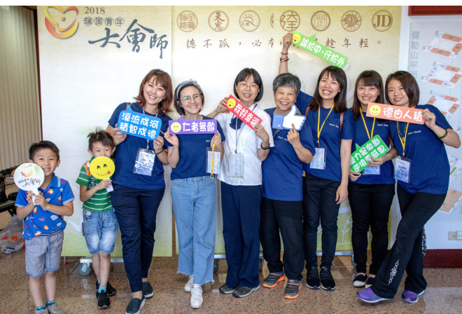
▲ 活動正式開始前，先化身網美留影。

上午8:00前完成報到，現場人潮眾多卻井然有序，這得歸功於前兩次的彩排及幹部們在籌辦時的用心；從下車到報到處，沿途充滿著親切的問候、引導，和精神奕奕的歡迎聲。即使沒看標示，憑著各單位衣服顏色，也可以正確地找到報到桌次完成報到。領完識別名牌後，即有學長熱情地引導至由視覺文宣組設計的「網美打卡板」前，拿著各式不同的活動標語留影；而打卡板上可以看到象徵瑞周八單位精神的標識，讓人馬上就能感受到各單位齊心舉辦大會師的氛圍。