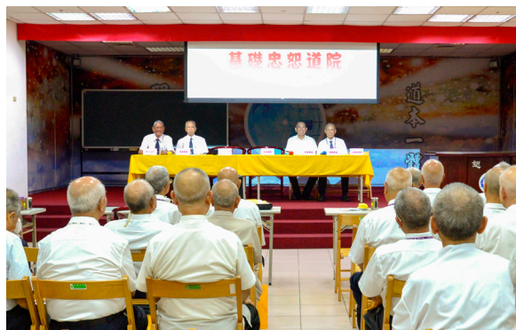
▲ 107年度道親大會，各位委員列席與會。