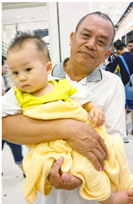
▲ 父親沈泰鴻壇主修道後的改變，讓正國學長感悟深刻。