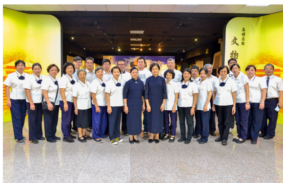
▲ 瑞周全真天龍單位道親參觀文物館。