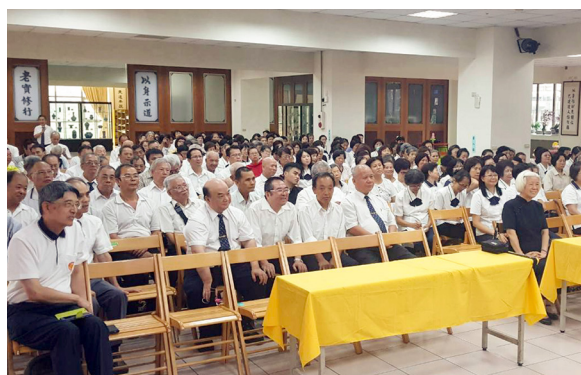
▲ 瑞周全真至善單位舉辦殊勝法會。