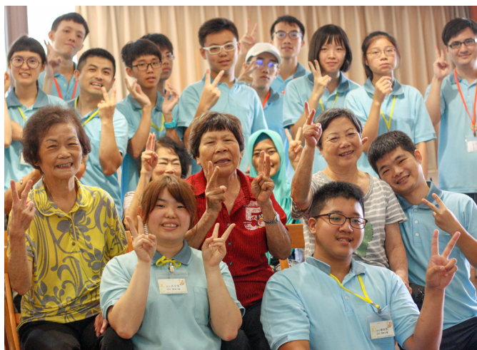
▲ 忠恕會館敬老健康操帶動。

我是第一次參加生服營。第一天來的時候，覺得很新奇、很特別，雖然覺得好累，但是累得很值得。第二天，我們玩了「命運好好玩」闖關體驗遊戲，此課程是考驗自己的價值觀，