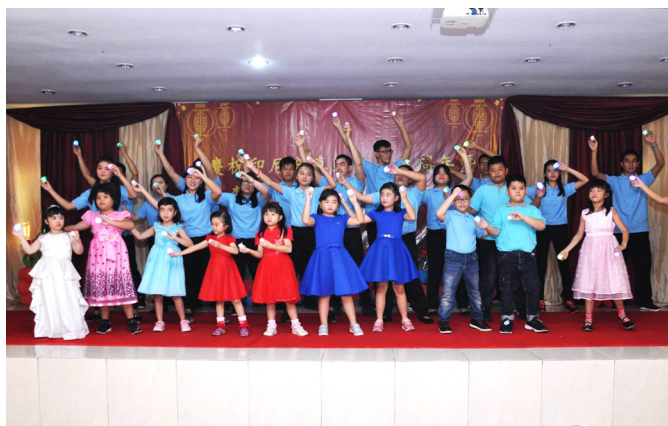
▲ 青少年及小朋友以精采演出表達祝賀。

雖然李點傳師已經功圓果滿，我們還是要繼續努力，不斷依理前進，真誠學修講辦行，學習李點傳師的精神，讓道場綿綿不斷，傳承永續。李點傳師，您永遠在我們心裡，道範常存，我們永遠懷念您！