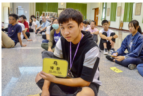
▲ 晚會表演節目，抽到上台演戲。

印象中最深刻的是晚會的各組表演，每組透過刮刮卡知道表演項目和順序，分別為廣告劇、MV 拍攝、跳舞、演戲等，但這些項目需要與「信任」息息相關。後學雖然沒有帶組，但透過協助各組，看到他們準備的過程，甚至在表演中，都讓我覺得非常驚豔和感動。只有一天半的時間，卻能將廣告劇表演得非常好，像是無人商店的橋段，小組先透過網路影片知道老闆為何會有想開無人商店的念頭，再用演戲的方式，演出信任的重要性。另外一組有印象的，是我協助編劇的那一組，故事是說主角看電視