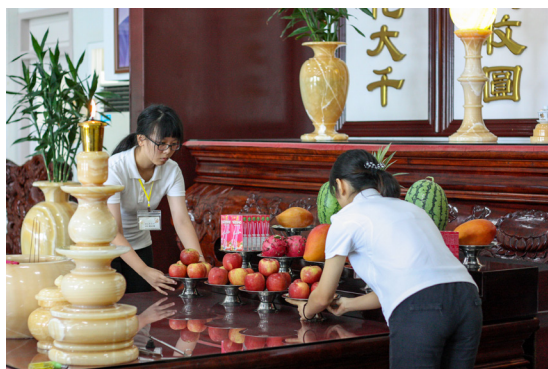
▲ 細心完成獻供任務。

侑明老師上的「愛的延長線」課程，談到我從沒有想過的問題——如今面臨老人化社會，但我們總是少了一份關懷長者的心。這次去忠恕會館帶動健康操才發現，即使僅僅是陪著他們做做運動、談談心，他們就會滿面笑容。有位阿嬤還說：「看到你們，就像是看到自己的孫子，很開心！」讓我們的心也暖暖的。我想以後再看到身旁的前賢們，也會想要多關心他們吧！