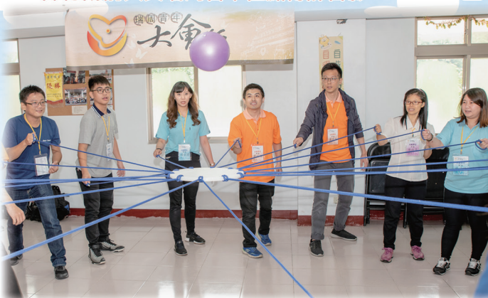
▲ 「合擊大法鼓」，體悟扶圓補缺。