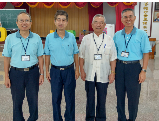
▲ 點傳師熱情參與生服營課程。

能重拾回笑容，勇敢地再踏出下一步，突破所有困難。相信在這四天裡培養的感情，和學習到的做事態度，都能存留在我們的心中一輩子。這四天，我成長了許多，也學會了去承擔事情，謝謝每一位在我身旁的人，因為有你們的陪伴，我才能過得如此幸福、快樂！期待明年的生服營，明年再見！