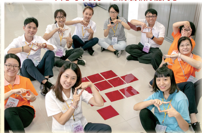
▲ 「就有道而正」，捨己為人以共成。