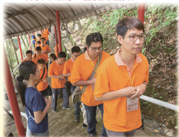
▲ 手抱合同，誠敬前往中堂午獻香。