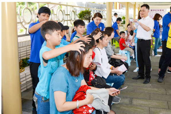
▲ 「按佛身福慧生」，藉由按摩向長輩表達感謝。