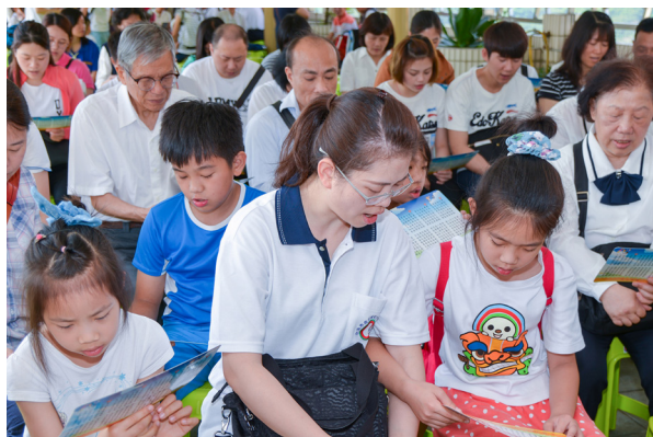
▲ 親子共同讀經，其樂融融。