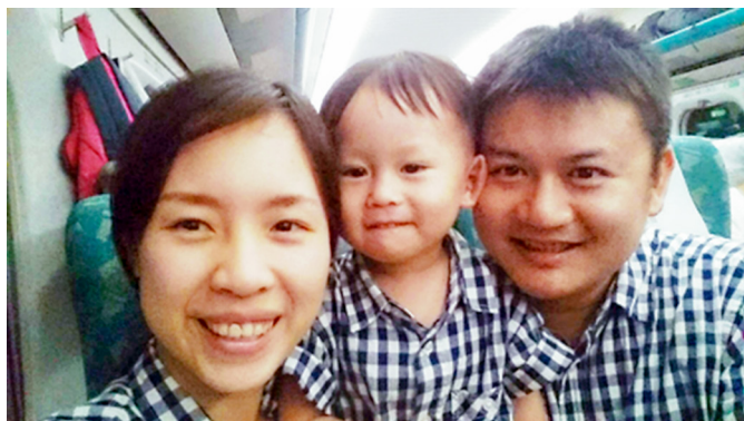
▲ 全家修道，家庭共好。

他的打工就只是副業；當打工影響念書時，我們自然會以念書為主，不會讓副業影響本業。