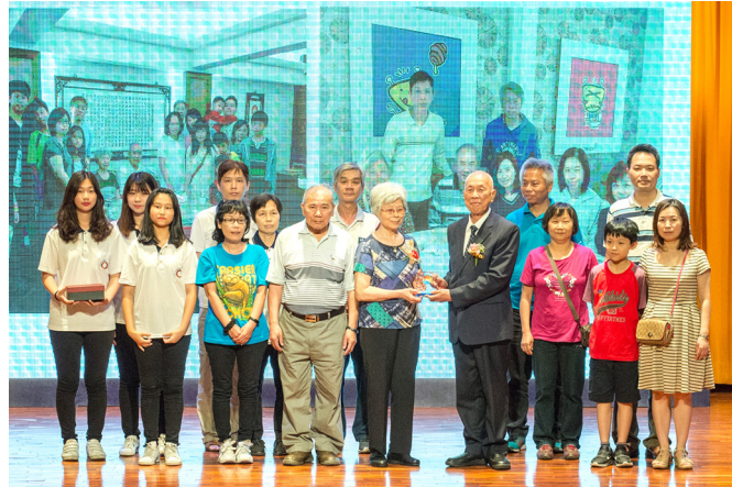
▲ 黃總領導點傳師頒獎給道範母親代表。

珍惜每一次活動因緣，各區域、各處室學長傾全力付出，各讀經班師資、家長、兒童珍惜把握機緣，踴躍報名參與。過程中，每一位參加的家長和小朋友，都有專門的師資或學長陪同，讓他們感受到道場的重視，更希望他們可以了解師資們的用心、細