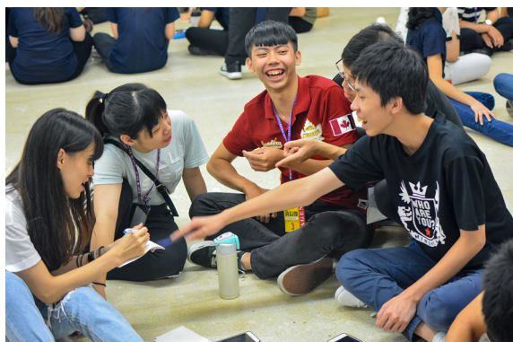
▲ 體驗活動中體會「關於物的信任」。

又一次地安排幕後的準備工作，或是活動組籌備所有活動，都是非常繁雜的。除此之外，大家都還有工作與學業要兼顧。但是，儘管營隊和凡事那麼繁雜，大家都還是為了夏令營，願意付出自己的時間與精力。每當後學看到大家無私的奉獻，除了感動及感恩之外，也告訴自己：一定要跟大家一樣聖凡兼修。籌辦夏令營的同時，「聖凡兼修」這道理，應該就是後學額外學習到的。