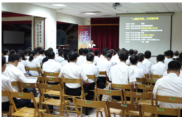
▲ 心靈成長班幹部交流互動。