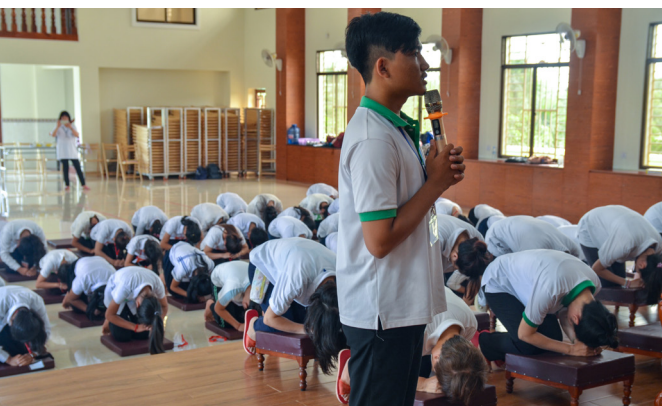
▲ 柬埔寨小朋友的禮節動作都做得很好。

燦爛的笑容，讓後學感到非常窩心，不自覺地連自己的笑容也跟著燦爛起來了。與他們的互動當中，發現他們真的很好學哦！這跟台灣的小朋友不一樣，他們在佛規禮節上非常有道味，每位學生們也非常有禮貌；在與同學相處時，會互相鼓勵、互相幫忙，不分彼此。