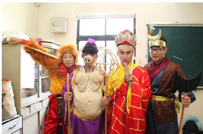
▲ 活動組扮演西遊記角色，吸引所有小朋友的目光。

人往往沒有真正地認識自我，有時情緒上的表現僅是表象，而非真正的情緒；情緒上的抒發只是一時的，事後往往會後悔。人生應自我修練，改脾氣、去毛病；認識自我，去除不