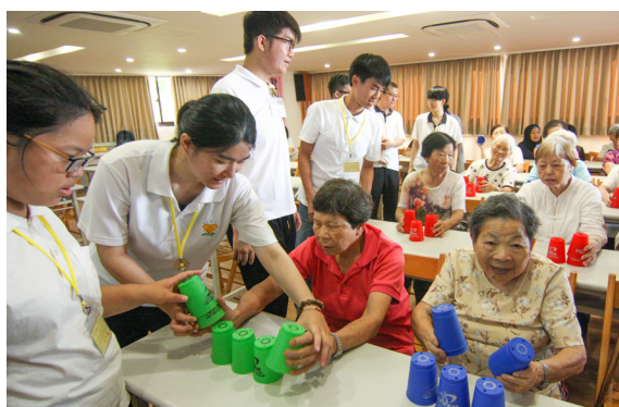
▲ 忠恕會館敬老遊戲帶動。

一次參加生服營，所以難免會緊張。到中午吃飯時，就比較不陌生了。我想營隊活動一定會很精采，果不其然，才一下子就過了四天，平常待在家裡，四天好漫長。