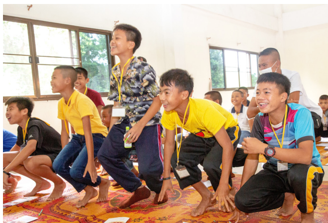
▲ 透過活潑的方式學習華語。

最後，更要感謝 天恩師德，讓我們營隊閃著雨縫在做事。在我們出發前就先聽泰國的學長說，最近泰國正值雨季，衣服不易乾，並提醒我們可攜帶輕便雨具。但我們抵達泰國那空帕農機場，搭車回中堂的1小時車程，是有風無雨；營隊活動及移動期間，晴空無雨；營隊結束，學員離開中堂的1個多小時，也是晴空無雨；但再過沒多久，就開始下雨，且雨勢