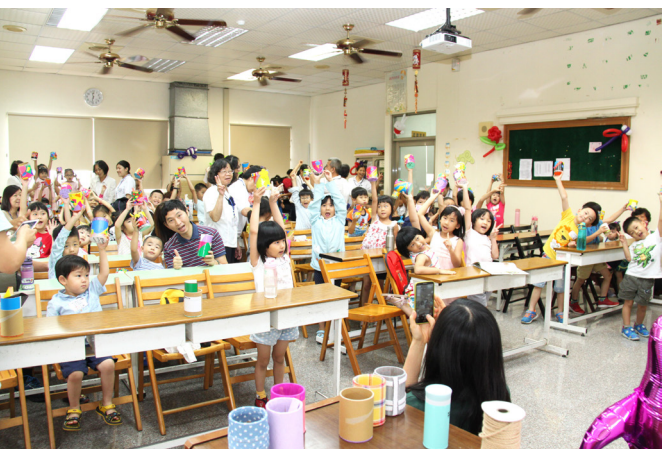
▲ 透過活潑的營隊模式，親子都得到成長。