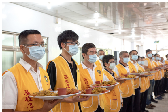
▲ 午餐服務的學長們就定位等候上菜。