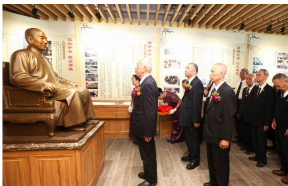
▲ 袁前人聖像揭幕典禮，眾人感恩緬懷。