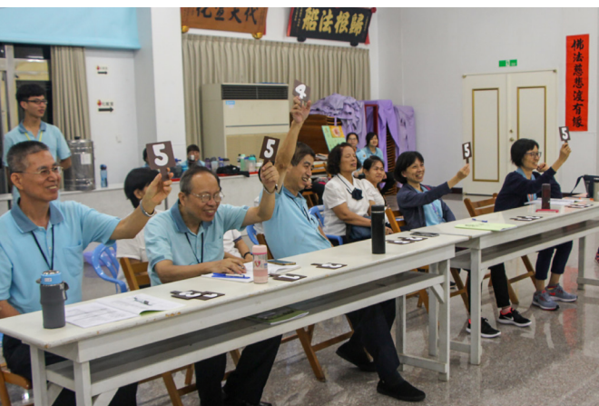
▲ 敬老健康操帶動比賽，由評審團評分。