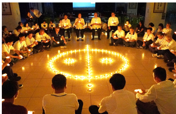
▲ 瑞周金剛單位樂道法會，殊勝晚會時光。