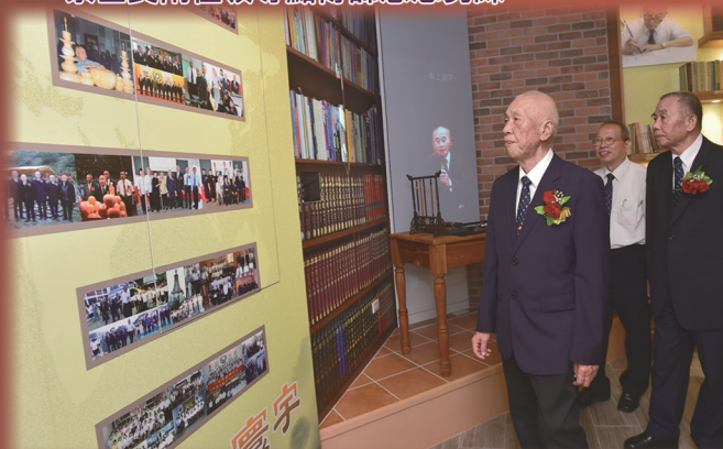
▲ 參觀紀念館，無限緬懷袁前人恩德（左圖與右圖）。