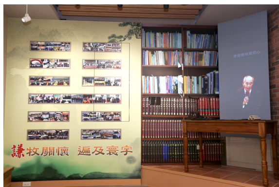
▲ 紀念館旨在闡揚袁前人修道風範及其一生立德、立功、立言之事蹟。

堃總領導點傳師及各位領導點傳師先行到天庭道院二樓貴賓室稍作休息，之後移步袁前人紀念館落成開幕的現場，待吉時到進行開幕典禮。