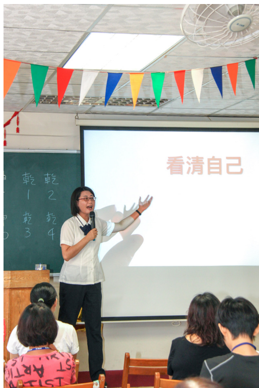
▲ 講師透過《論語》章句引導自我認識。

每個人都有價值，也能付出，要看每個人的心靈是如何去思考、想像。講師告訴我們，認識自我是：1. 為了要覺悟；2. 為了跳脫生命的輪迴；3. 為了要回歸靈明本性。帶小朋友參加讀經班，透過《弟子規》教育小朋友生活規範，扎好品格的根，同時也做好父母的基本態度。