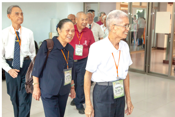
▲ 瑞周各單位領導點傳師與點傳師也至彌勒山天道清修院共襄盛舉。

「番番」的情緒聲音停歇，突然哭得更大聲：「我從來都不知道，原來我的爸爸這麼地愛我。」這件事，讓後學除了有些微父親的價值之外，也體會到原來這就是父母親對我們的愛。