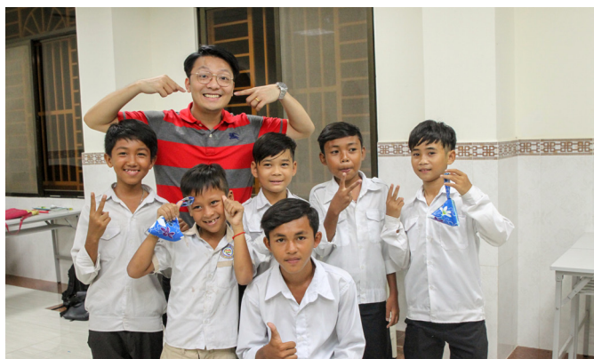
▲ 開心與小朋友合照。

能到國外開荒了愿真是難得，感謝讓後學有學習的機會；希望未來的日子大家再一起了愿！