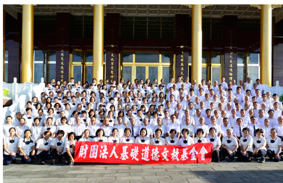
▲ 忠恕學院高級部法會合影。