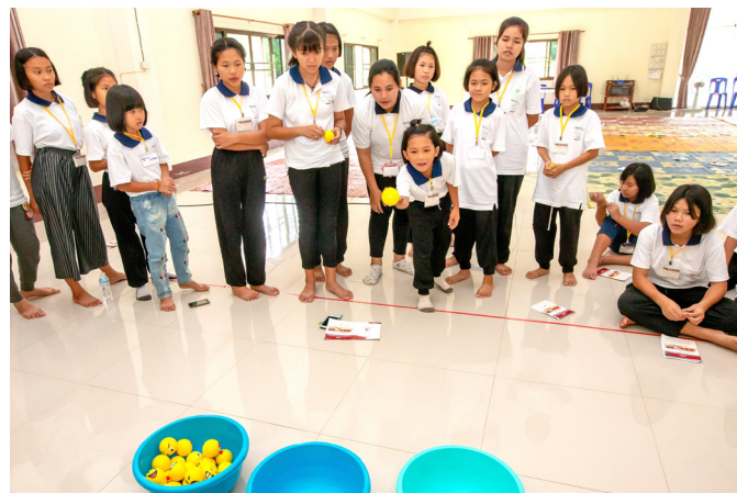
▲ 遊戲中複習華語，充滿趣味性。

泰國當地學員的質樸，同樣讓後學留下深刻的印象。在「孝順的故事」這堂課互動中，有一位國小低年級的