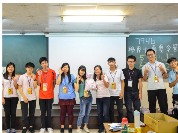
▲ 小組領獎，歡喜合照。

營隊第一天，讓我印象最深刻的應該是「一貫GOGOGO」，講師講述的內容，讓我覺得很「血淋淋」，感覺好像是真實發生的，也讓我看到身上的傷口，體悟到我好像是上天撿回來的。第二天，下午的課程是關於「物的信任」，其實我還蠻害怕的，怕自己講得不好，但還是硬著頭皮上場了。過程中，我也有發現其實有幾個學員在偷偷睡覺，原來在台上看是那麼一清二楚。讓我印象深刻的是，有一位學員分享以前會讓人造成誤會的