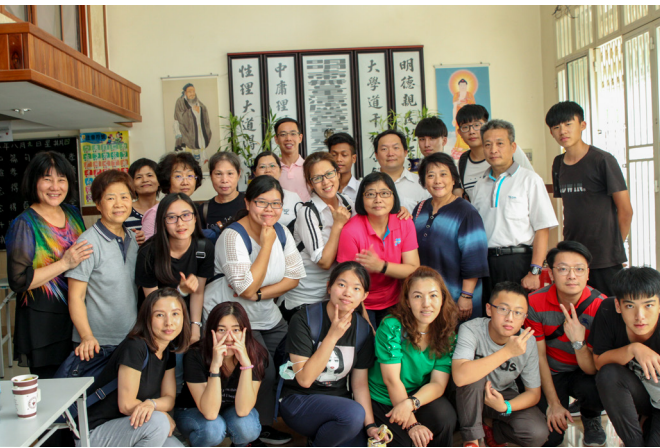
▲ 柬埔寨天一堂訪道。

自己不足的地方。感想有太多、太多、太多了……一言難盡！僅能以「感恩」二字表達內心之欣喜。