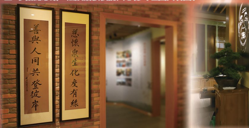
▲ 館內精心典藏各項文物，並呈現前人行誼點滴（左圖與右圖）。