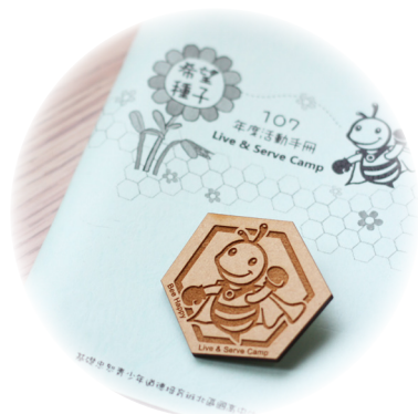
▲ 服務勳章，代表營隊最高榮譽。

感謝 天恩師德，讓宅媽遇見來自天堂的孩子——第七小隊；雖然是初次認識，卻能互相幫助，完成菁英服務認證榮譽卡。看著孩子知道自己認證卡上還有禮節和洗碗沒過關，晚上全員拿著小手冊認真背誦；隔天驗收時，全隊學員陪著其中一位尚未過關的學員練習。驗收洗碗時，宅媽交代的事項，大家都不嫌囉嗦地聽著，並且做到確實檢查。其中還有一位不擅表達的孩子，認真反覆地檢查，揪甘心（台語：感心，指內心感動或有所觸動）呢！