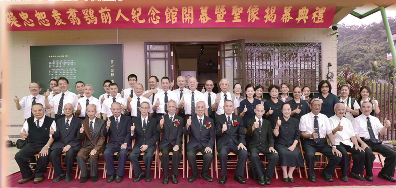
▲ 開幕儀式後共同留影。