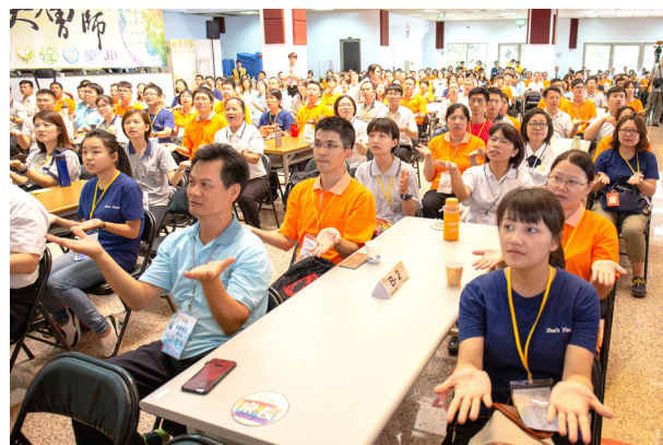
▲ 道寄韻律時光，歌聲搭配著手語。

在活動中，看到各位的道氣這麼蓬勃、這麼有朝氣，大家所匯集的力量讓大會師活動是成功的！看到他人做了善事，都會受到感動，還會受上天的感應，這感受、感應，後學認為是旁系的；而我們個人是個體，若做出有道德或正確的事情，用真心來做，