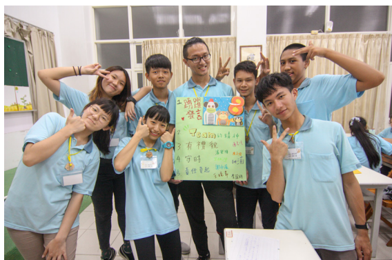
▲ 完成小組契約，一起合照。

第二天美食 DIY，我們做的芋圓超好吃，一下子就快吃光了，便趕緊也分給其他小隊享用。當然我們的芋圓，也為我們贏得了兩枚金幣。第三