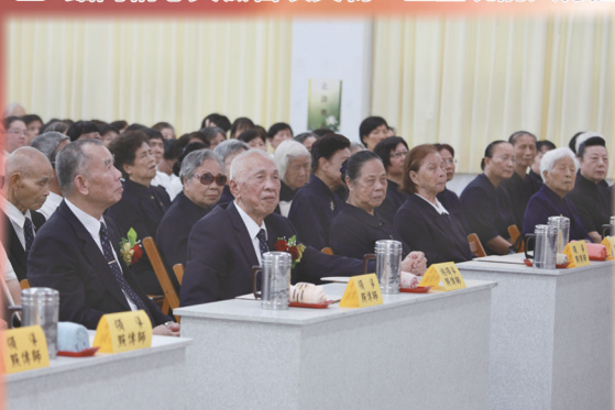
▲ 各單位領導點傳師、點傳師、道務助理齊聚宜蘭參與典禮。