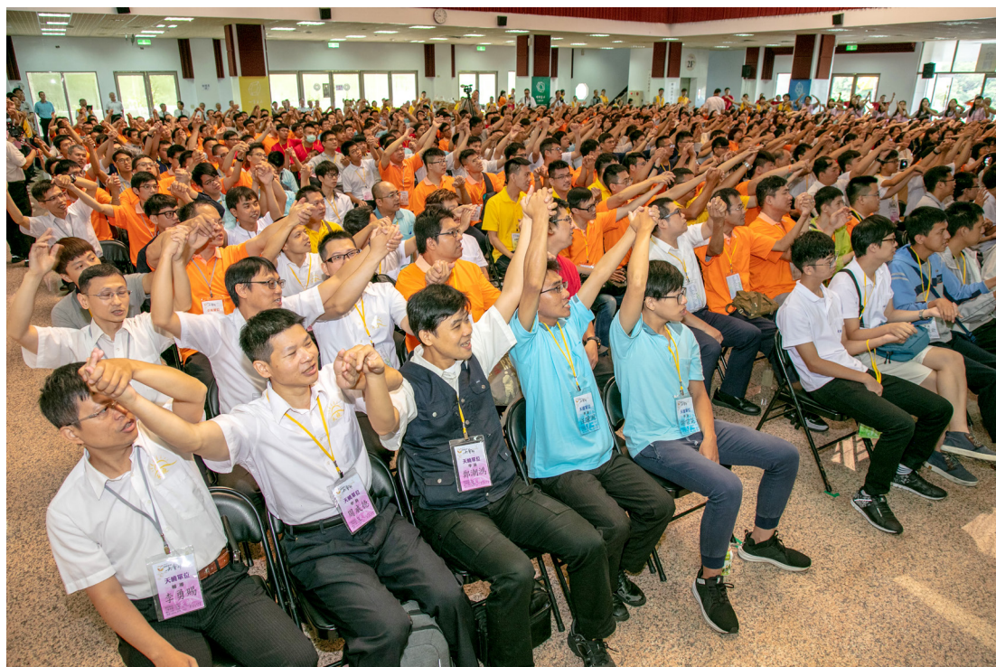
▲ 瑞周青年齊聚，「德不孤，必有鄰」。

以真誠心把事情展現出來，讓我們想到孟子的話：『學問之道無他，求其放心而已矣。』《孟子·告子上》孟子所說的學問，不是指我們在學校