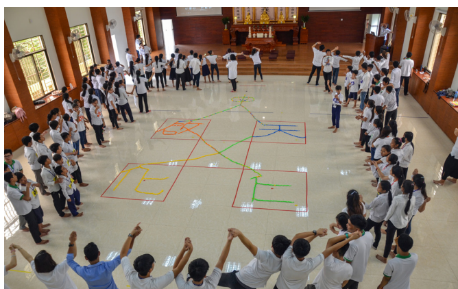
▲ 天仁與啟化團隊資源共享，共辦成長營。

這次東國訪道之旅醞釀一年之久，目的是為了鼓勵天仁道育國高中班的學員能全勤參班，並成全年輕學子多多參與地方道務；經由輔導師資推薦，即可於暑假出國參與訪道學習