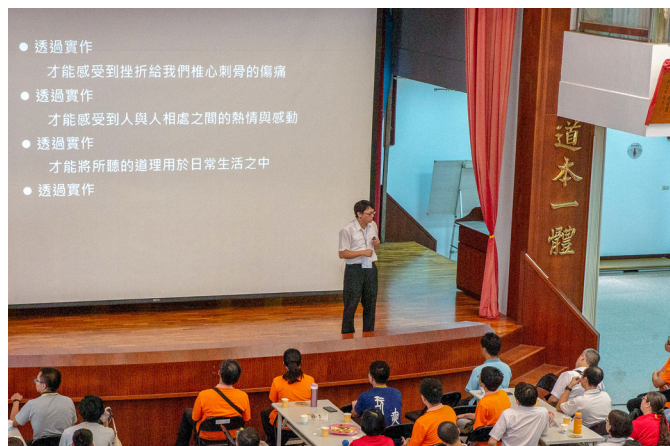
▲ 修道最大的印證，來自自我的改變。

最後要分享的是，後學大學時因為發生一些事情，於是留了及肩的長髮；那時因為念土木系，班上都沒有女生，所以號稱「土木系最美麗的背影」就是後學。然而，畢業與退伍之後，後學開始參與地方青年班，學習策劃活動與課程，原來～