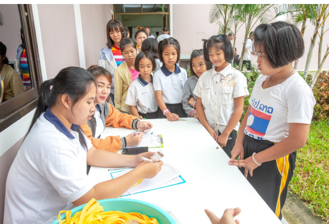
▲ 泰國學長協助學員依序報到。

泰國講師的笑臉，才想到：三天前才緣起，即將緣滅，以後的因緣聚合未知。心中的感傷絕對不是在這短短三天扎根萌芽，而是幾世或幾百年前相約要見這一面。此時想想現在生活周遭的家人、朋友、同事，更應當珍惜能相聚的時刻。這也印證了地理和語言的距離不能阻擋我們一心相「夕（惜）」地辦聖事。