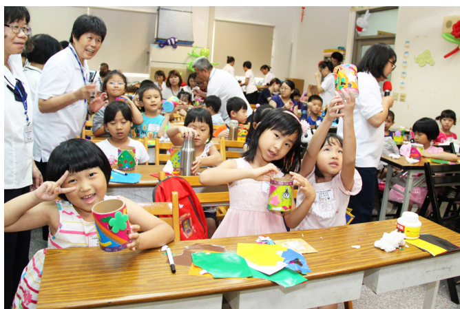
▲ 勞作 DIY，小朋友各自發揮創意。

自學校畢業後，很久沒有上課了！進入社會大學，所有事情都要自己做決定並承擔後果。今天透過心靈成長夏令營課程「認識自己」。自從