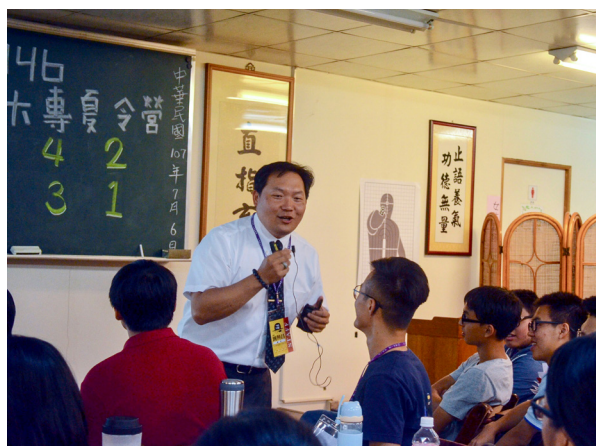
▲ 講師精彩的上課解說。

結果他二話不說就答應了。會找別人拍照的原因是，懂得使用單眼相機的人比較會捉角度，而不太會拍照的人，常常角度捉得不太理想，且拍出來的照片可能會模糊，活動後真的會修到抓狂。