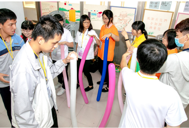
▲ 齊心協力，前後移動時保持氣球不倒。

「合擊大法鼓」是一個大圓盤串上 10 條繩子（繩子對折穿過圓盤邊緣的洞，兩端再分別綁成繩圈），讓 20 個人 20 隻手可以在周圍握住繩子，然後再在大圓盤上放上一顆球，20 人合力讓球在圓盤上彈跳，看哪組可以跳最多下。遊戲規則為：