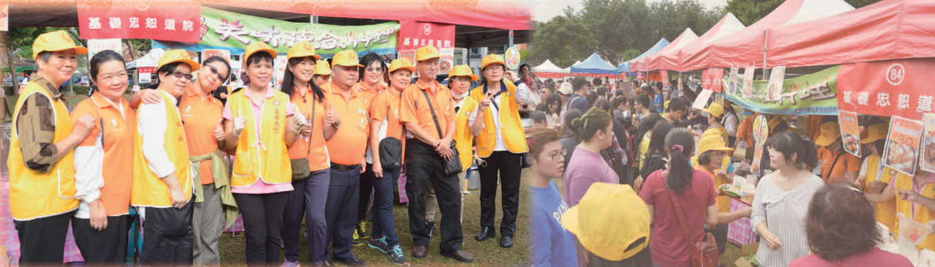
▲ 志工群熱誠參與，散播溫暖。