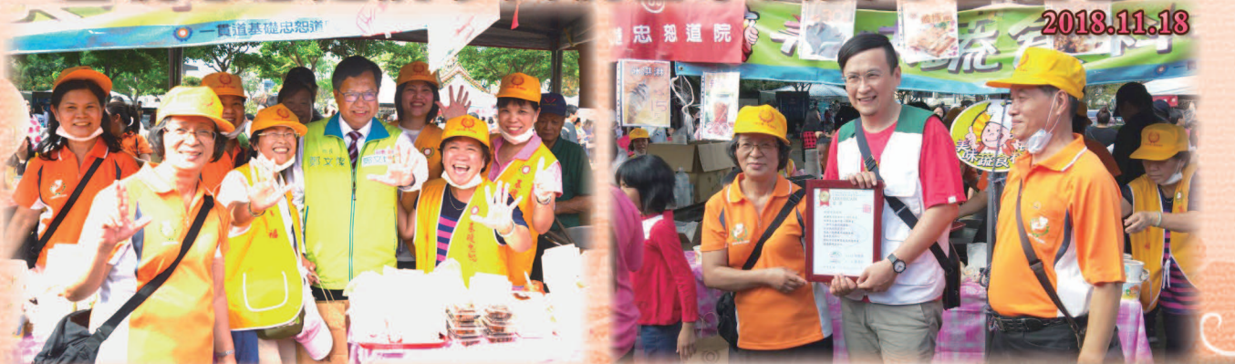
▲ 桃園市鄭文燦市長與志工們歡喜合影。