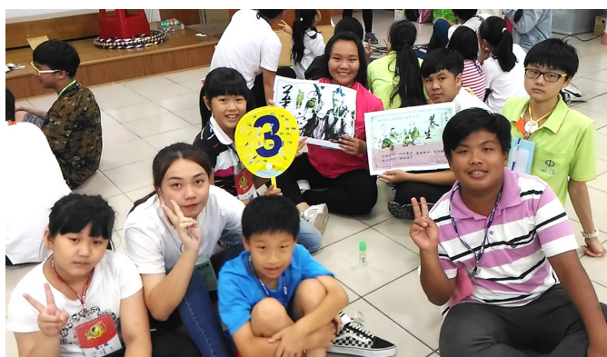
▲ 小組培養良好默契，共同參與營隊活動。

午飯後，國小學員入營，大家的戰鬥模式全數 Turn On。每當後學說：「各個小隊到齊後，自行愛的鼓勵、坐下。」所有隊輔都帶領著隊員使出「最大功率」來完成並且坐下。在講台上的後學，真是感動！後學也意外發現，有幾位學員是之前三國體驗營的學員，也有幾位輔導學長和小飛俠是去年參加志工營的同學，都在這次營隊之中發光發熱。