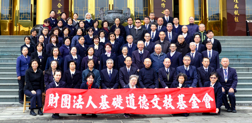
▲ 忠恕學院高級部助理法會合影留念。