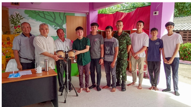
▲ 年輕的輔導學長們將鼓樂器贈送給中堂。

從無到有，一點一滴在心中，搬桌椅、架設臨時中堂、準備供果、插花佈置、掃地、拖地、設置投影布幕和音響器材，回報工作進度……；再一起環境維護，大家不分你我，同心