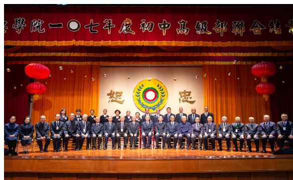
▲ 高級部成全學系結業生合影留念。