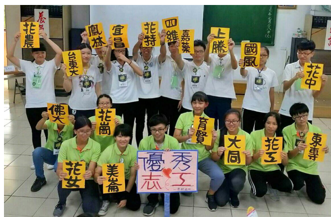
▲ 來自各校的優秀志工。

自從去年參加了三國智仁勇親子體驗營，明顯感覺孩子的不同與成長，所以作母親的我，暑假前特別注意今年的活動訊息，深怕錯過了。在這兩天的活動裡，看到了許多去年曾見過的大哥哥、大姊姊都成長了許多；更難得的是，時間都過了一年，竟然還記得孩子的名字！孩子們共同討論、共同參與所有事物，學習體驗團體生