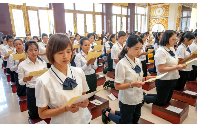
▲ 佛前表白心愿，愿大力就大。