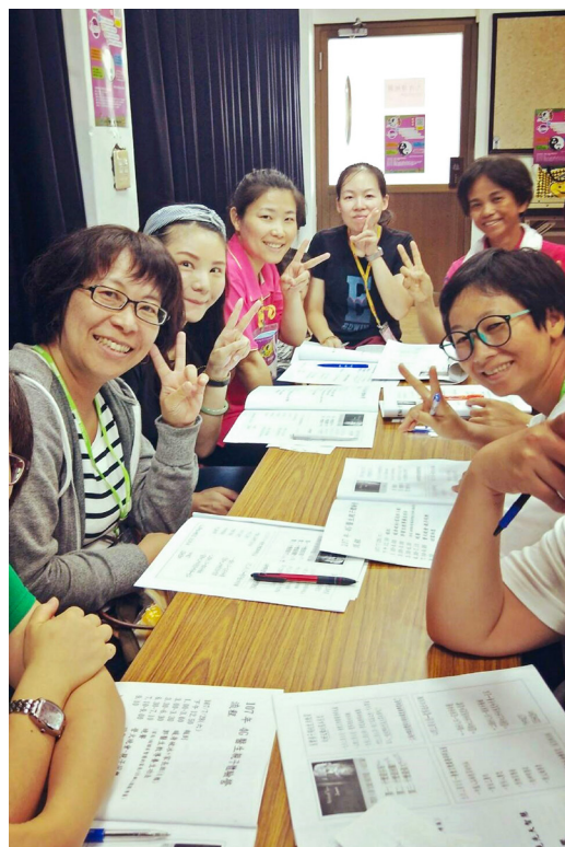
▲ 家長於課程中獲益良多。

今年會來到這裡，是因為學校通知各班有這樣的暑期營隊，我聽到後就去學務處報名了。來到慈懿道院滿心期待，令我最印象深刻的是營火晚會；到了第二天，學習到許多中醫知識。參加完這次活動，希望下次可以再來擔任志工與服務，也感謝我的隊輔和小飛俠，幫助我們認識大家。