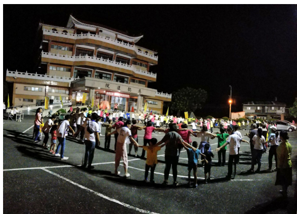
▲ 營火晚會，點燃彼此的熱情。

隊也是一個新的體驗。第一次可能有些不上手的事，但是我覺得未來一定可以再進步的。明年我一定要再來當志工、帶學員，或許會累，但撐過之後，便很有成就感；尤其是隊員們都很配合地完成任何事，到最後那一刻是感動的，感覺像是他們有了自信心，所以才會信任小隊輔，真的配合度高到破表！這一次，我帶了非常優秀的隊員們！