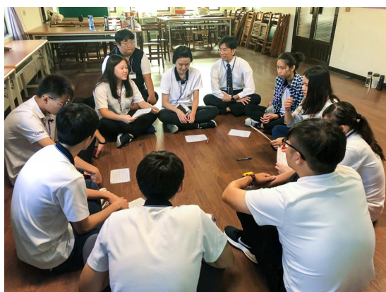
▲ 「妄戒」課程，小組依情境狀況討論分享。

在體驗這關的時候，後學印象深刻的是，如果有作弊的行為，竟然要被扣 50 分。後學在學校也看過有人因為嫌麻煩而不想認真填寫考卷，所以直接抄別人的作業來交卷；這種作弊