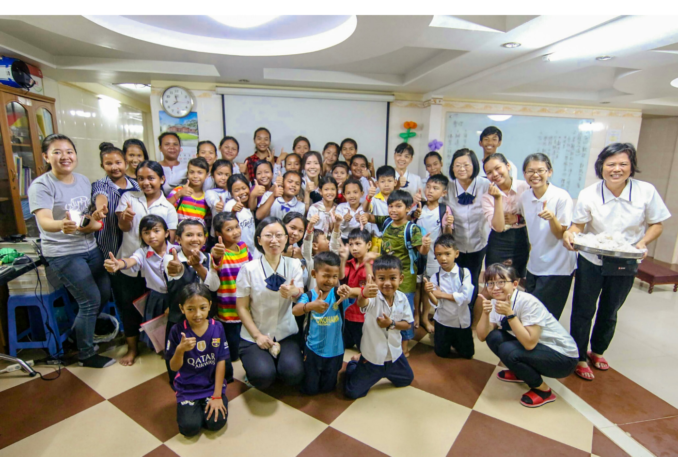
▲ 純樸有禮的金邊堂小朋友。

後學回國後，每天都想著中洲堂和金邊堂的孩子們，他們是那樣地天真無邪、單純可愛。本來陪同我們去拜訪成全度人時，他們都不太敢進去人家家中，我們一直鼓勵，給他們勇氣和信心；所以心得分享時，當地年輕人也說，本來不敢去度人，怕被罵，因為台灣來的前賢鼓勵，他們就不怕了！可見國外道親是多麼需要我們出國幫辦成全啊！