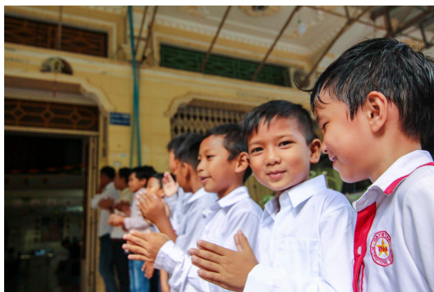
▲ 小朋友的熱情感動每位了愿者的心。

因為站在馬路上，對面那戶人家一直看著後學，後學就請金傑學長一起到對面翻譯，結果連同對面那戶人家和隔壁鄰居共有兩、三位都願意過來求道。後學感到法喜充滿，很高興可以如願引度他們求道！這裡的人都很純樸沒有心機，有個年輕人騎機車經過，看著後學，後學趕快邀請他進來拜拜，沒想到他就真的進來了！此外，後學找了會翻譯的前賢跟借我們設臨時中堂辦道那戶人家的女主人說：「今天能借你們家設壇辦道，讓很多人來求道，你們是很有福報的，因為有很多仙佛會臨壇護法，你們祖先也都能沾光，他們會很高興喔！」