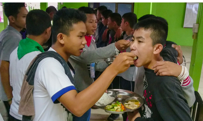
▲ 學生們餵飯給輔導學長吃。

接著跪讀《百孝經》後，練早操。感恩上天長養萬物，感恩農夫勞苦耕作才有農作物，感恩廚師媽媽辛苦烹飪才有食物，一切皆要惜福吃乾淨；食衣住行皆有禮，坐有坐相不隨便，服裝端莊嚴精神，來參去辭相問好，尊師重道感恩行。早餐時刻，指揮官突然一聲令下，只看所有輔導學長快速至前面集合，乾坤各圍一圈躺在地上，且雙手雙腳朝天。指揮官表示：「輔導學長們沒有善盡職責做好『道』的標杆，要處罰不能吃早餐！」我們一聽都嚇了一跳，心中不捨。