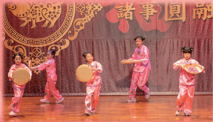
▲ 小朋友以舞蹈迎春接福。