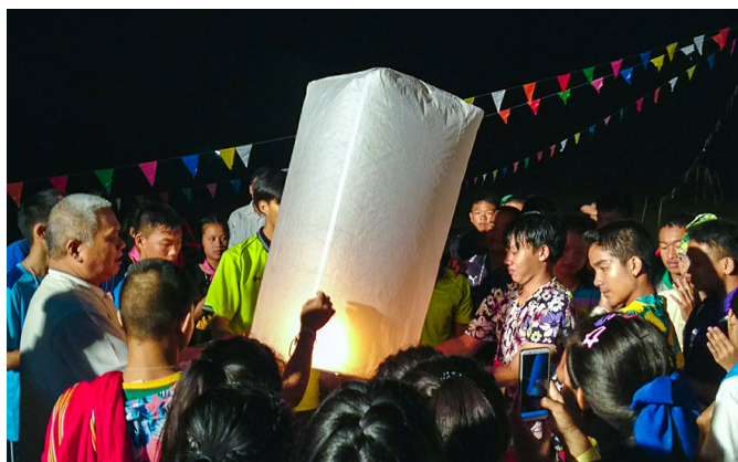
▲ 點傳師帶領大家一起寫下祈福詞、放天燈。

放天燈代表向上天報平安。真正的平安，從心平心安開始——心平，視眾生一切平等，內心安定，老實修行。白色天燈也象徵白陽時期的白陽天使——高飛，實踐道傳萬國九州，普度眾生的使命。帶著滿滿祝福，為眾生點燈，祈禱眾生皆能遇到光明，讓平安之燈為迷徒照亮回家的路，人人都能平安回家面 中顏！