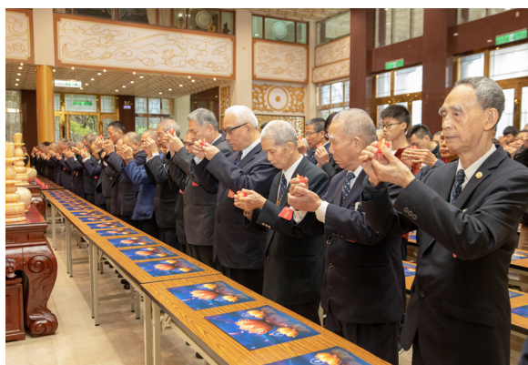
▲ 新春團拜，點燈祈福。