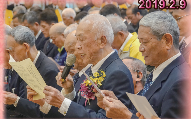
▲ 黃總領導點傳師代表念祈福疏文。