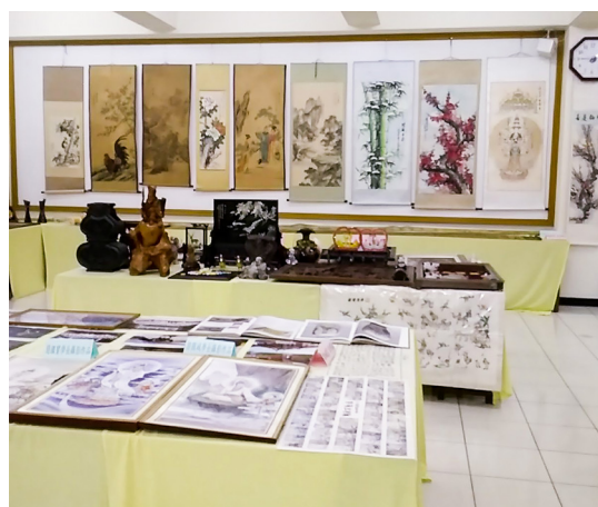
▲ 2 樓靜態展覽區，展示道親所製作及珍藏的物品。