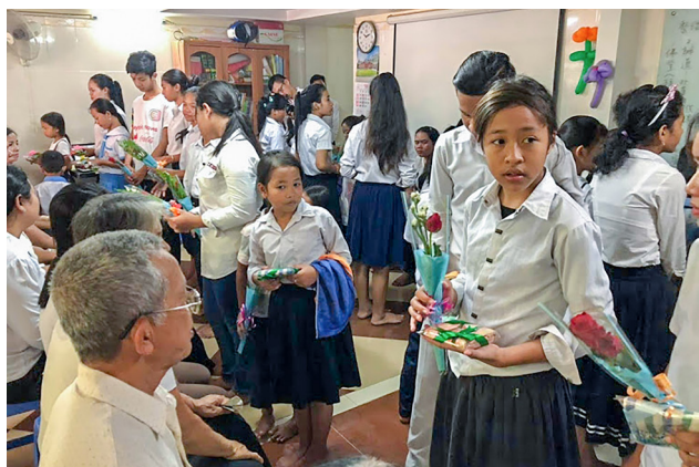
▲ 孝親活動讓台東兩地道親都有成長。

在東國，幾乎每天都有很多的感恩與感動！第一天到達金邊中洲堂（先天單位）時，看到外面排了兩列孩子們，熱烈地拍手、唱著中文〈歡迎歌〉：「真正高興能見到您，滿心歡喜地歡迎您，歡迎、歡迎、我們歡迎您！」後學內心有說不出的驚訝與感動，國外竟然有這麼多小朋友會講中文、會唱中文歌！這是怎麼做到的呢？後學內心有很多疑惑。