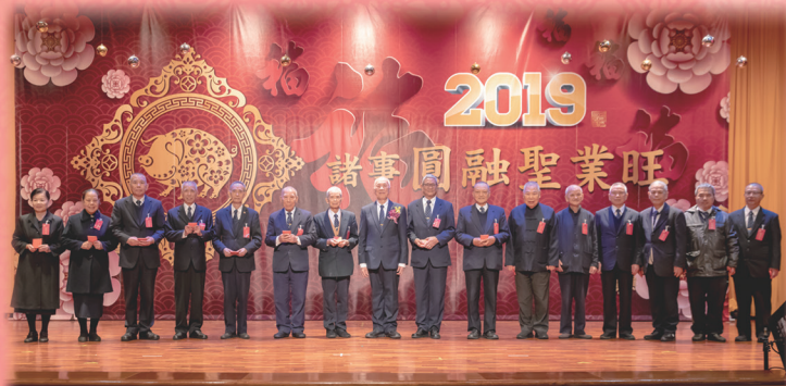
▲ 領導點傳師及點傳師們歡喜領紅包。