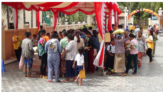
▲ 結緣品發放，敦親睦鄰。

1月4日下午3:10，舉辦聯誼茶會及說明課程，來了約150人。陳點傳師慈悲開班：「健康的方式不僅是治療疾病，更要有快樂的心境，幸福是一種心靈的滿足。『健康幸福班』一系列課程，將帶給大家身心靈的健康，預定於1月27日開班。祝福各位家庭圓滿幸福，歡迎踴躍參加。」之