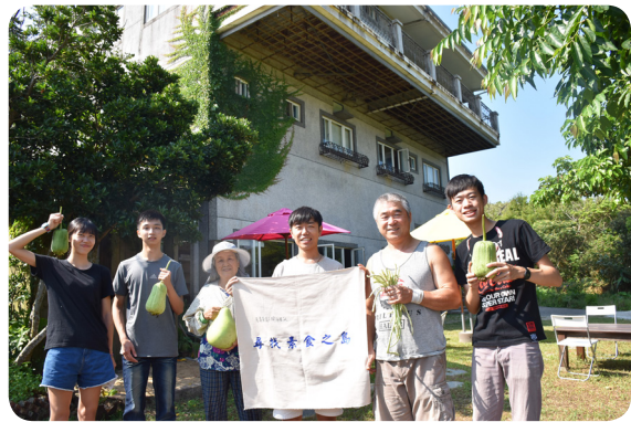
▲ 入住徜徉山海間的素食民宿。