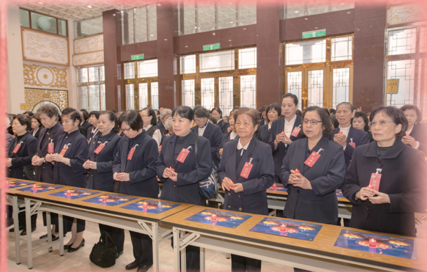
▲ 於祖師殿中點燈祈福。