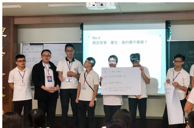
▲ 學員針對生活實例，討論對「酒戒」的看法。