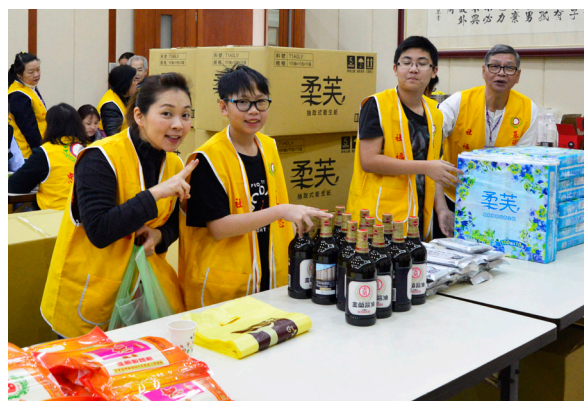
▲ 社福處物資發放，為鄉親送暖。