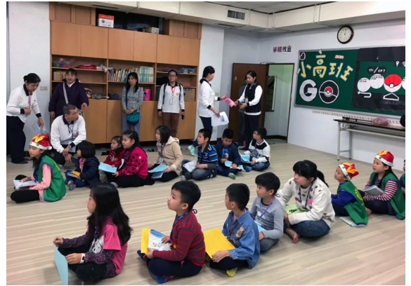
▲ 讀經的小孩靜而有禮，能守秩序。

報名截止後，有 17 個讀經班共襄盛舉，計有 102 位學生報名參加，其中幼兒園組佔了 45 位，國小組佔了 57 位；因為多數讀經班都是剛成立 2