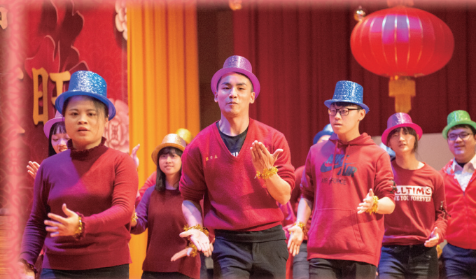
▲ 舞動青春，敬祝諸事如意。