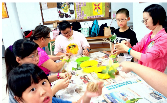
▲ 家長、小孩一起參與手作課程。

室等待或看小孩參加課程；但是沒想到家長們也共同參與破冰與親子教養的課程，讓我們這群有步入青春期孩子的家長，有交流教養心得的機會。其中印象最深刻的是「叩首」運動功法，可以增進孩子的專注力，大人們常做這個功法，身體放鬆，也會變健康。下次若有機會，會再帶女兒來參加營隊活動，很開心來這裡認識了許多朋友。