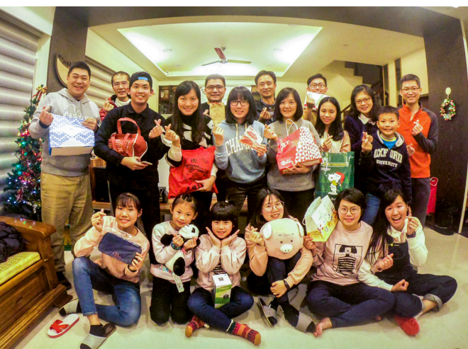
▲ 參加跨年讀書會。有一起修辦的夥伴，真好！

以待人。故所謂的「修行」，不是只有在中堂，而是在你生命中所處的每一個地方，在生命中所度過的每一分每一秒。