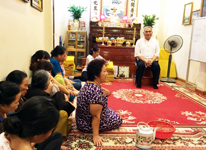
▲ 點傳師的成全，深刻觸動道親的良心。