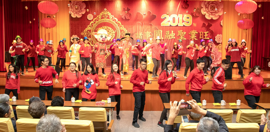
▲ 新春團拜，洋溢祝福與希望。