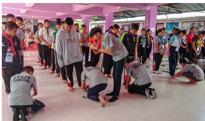
▲ 輔導學長為學員穿上祝福的襪子。

學員們當下都感動地哭了！因為在泰國，只有晚輩對長輩做這樣的服務；而在這場法會中，卻是長輩為他們穿襪，對他們而言，這是莫大的真