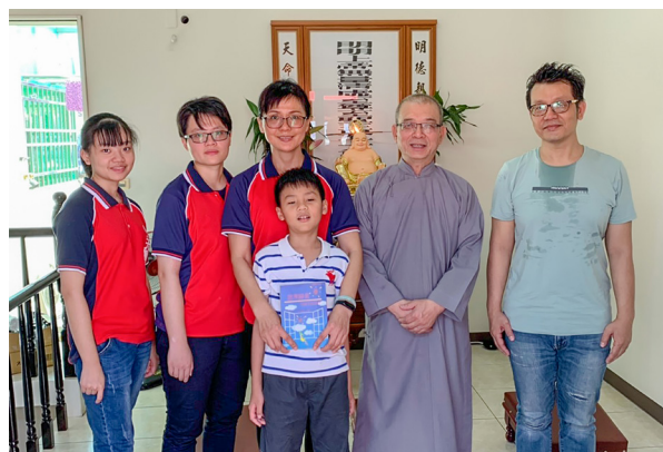
▲ 福慧雙修的一家人。

觸動內心，她馬上就立了一年報恩齋，以報答父母親對她的養育恩德，甚至在許願卡上寫下她的愿力：