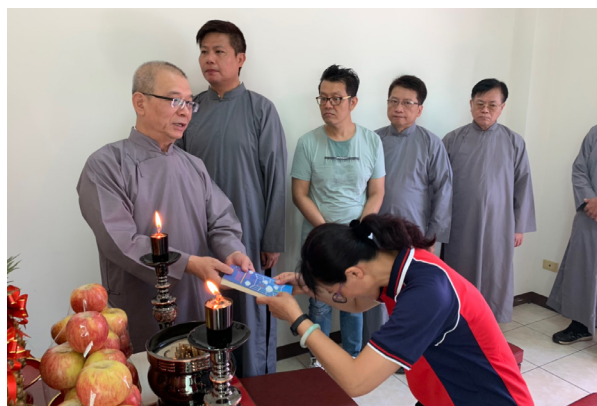
▲ 點傳師親領壇主手冊。