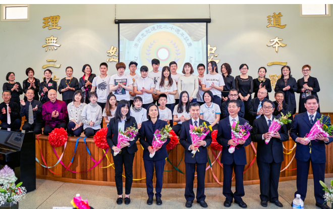
▲ 澳洲布里斯本忠恕道院 20 週年慶，大家歡喜合影。