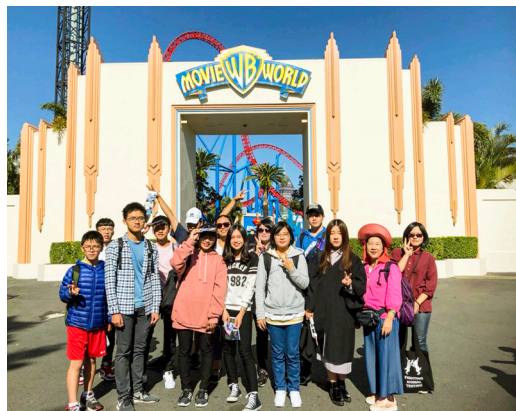
▲ 假日遊覽位於黃金海岸的電影世界。