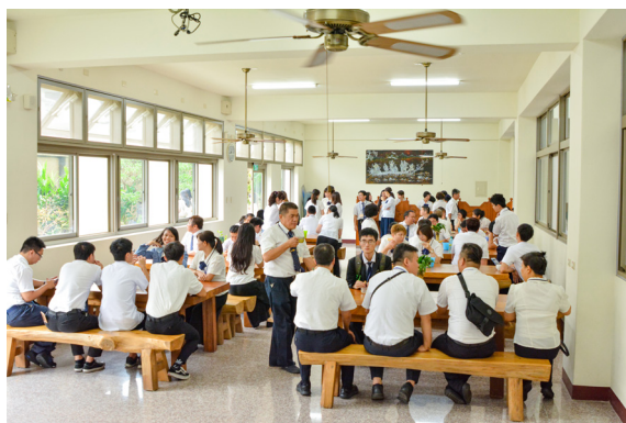
▲ 學員此行受益良多。

求道之後，要真心不二，全憑心意用功夫；修道不需要天天引經據典，道是不落言語，只要真心誠意就會成功；人有許多束縛問題，要靠智慧開解。了心了意用功夫，要了無私心，要了無私意，諸佛妙理非關文字。