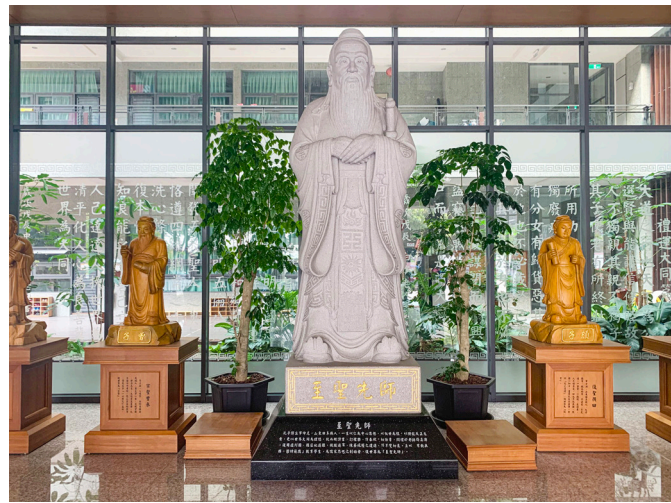
▲ 正和書院門口樹立孔子聖像，代表著儒家應運。

接下來由張講師分享青年志工隊運作、劉講師分享青年課程設計。高中志工隊自西元 2002 年開始推動；西元 2009 年，成立「正和人文發展協會」；因為正和書院推動三三三分區制度，道務蓬勃發展，高中志工隊由 8 所成長至 31 所，共計 800 位志工參與服務。招募志工的管道包括：伙食團、學校、同學、道親下一代、志工社團等。透過每年 7 月志工培訓、9 月志工老師培訓，搭配 3 月及 9 月志工出隊行前講習，並且在志工出隊期間，利用下午時間再強化服務培訓。