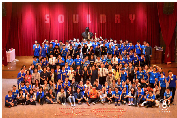
▲ 大學班一年舉辦四次，以度化青年為目標。