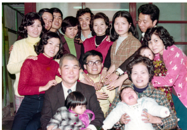
▲ 點傳師早期與家族共同合影。

年事已高的點傳師此時已較少到各班賜導，但不論是啟化堂的道學講座、壇辦班，或每週五下午的綜合班都極力參班。平日高點傳師有阿娣的