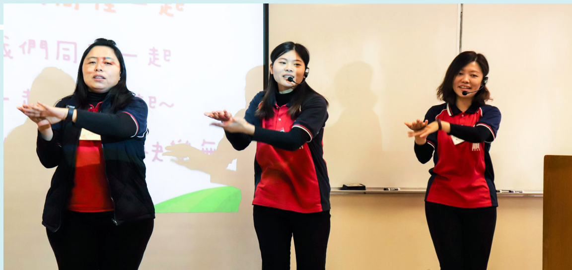
▲ 無私分享各種教學的秘訣。

就像彌勒祖師的圓圓大肚、長長耳垂和笑容滿面，我們亦有能力可以給與。（培訓營中，講師說：）能夠付出是最大福報！愛的力量是可以感染的！