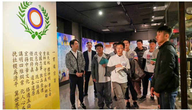
▲ 道育班師資與學員前往忠恕道院道史館參訪。

後學擔任的角色是劇中主角阿德的父親。拍攝過程中，後學印象最深刻的是微電影本身的故事：一對秉持道心的父母，想要給孩子正確的人生觀，卻因忙碌於道場事務而疏於關心孩子，進而造成親子間的衝突。這樣