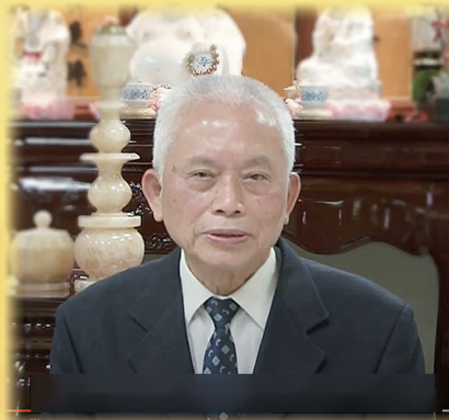
如此世界性的災難是末劫的前兆嗎？