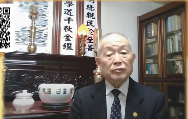
生命關頭的定靜安慮得