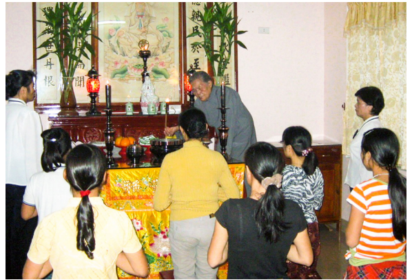
▲ 高尾點傳師慈悲愿力承擔赴東南亞辦道。

高點傳師於民國 62 年（1973）9 月 19 日領受天命，肩負使命度化十方。正如獲諾貝爾和平獎的人道醫生史懷哲所說：「世界上沒有一件具有