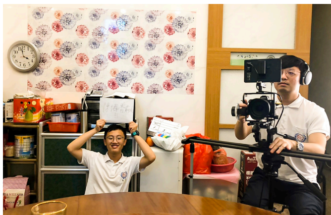
▲ 影片從故事的撰寫、拍攝到完成後製，歷經了八個月。

師資們的工作，我們不可侷限自己的力量；就如這次，讓後學深切地明瞭到，興趣和專長也能融入於道場的活動裡，一切並不是那麼地難以接近，一切都是沒有什麼限制和框架的！最後，後學期望在之後能繼續燃燒自我，為大家付出。