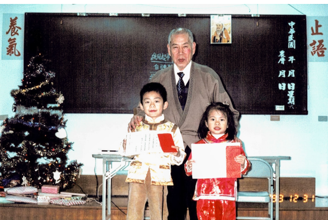
▲ 黃天賜點傳師非常重視對於小朋友的培育。

允許提早到 22:00 獻香。您說：「如果有罪過的話，由我一人承擔。」還慈悲地要大家常回中堂獻香。