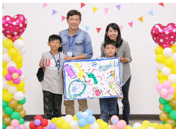
▲ 全家同心協力展現成果。

完成了活動，第一次幫爸爸洗腳，一起完成屬於我們家的家庭畫，這是人生中第一幅，下次要再一起畫也不知道是什麼時候了。