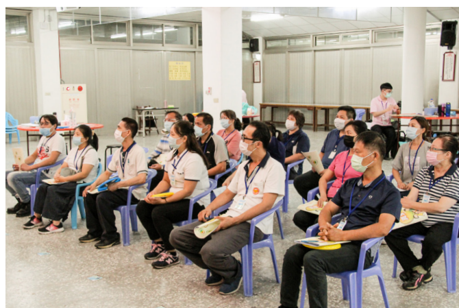
▲ 「愛在心裡口要開」專題。

今年是我第一年參與青少年育樂營的人才培訓，雖然遇到了疫情，使得原本三天三夜的育樂營改成舉辦一天的親子營；但是因為是第一年舉辦親子營，沒有過往的經驗，每位夥伴都是盡心盡力地去籌備這次的親子