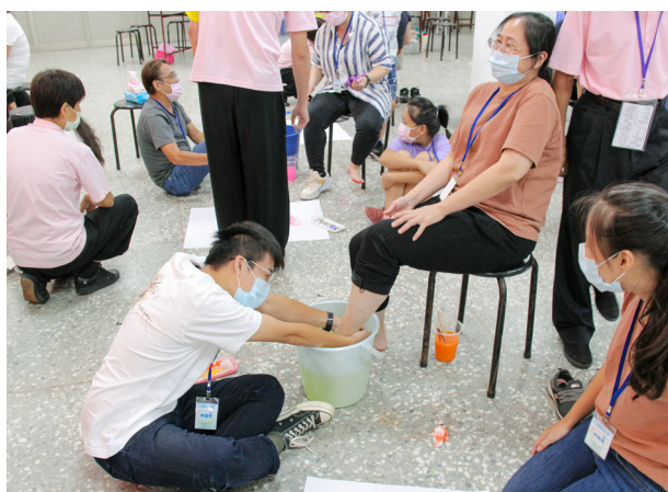
▲ 創意彩繪完，幫媽媽洗腳。