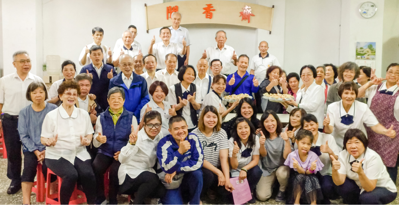
▲ 素食料理 DIY 成果分享。

有時回想親朋好友的質疑，後學漸漸意識到要注意攝取食物的營養跟熱源，以及顏色的搭配。比如，薑就是很好的熱源，水煮蛋、豆類、海藻、黑芝麻，這些都是持齋人很需要的食物。若是沒把身體照顧好，可能讓葷食主義者更加反感，因此後學有點感受到自己身負重任的使命。