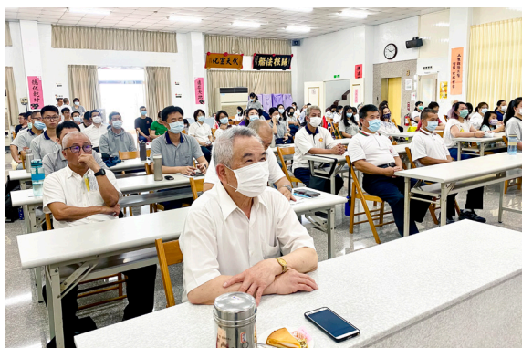
▲ 在宜蘭天庭道院上課，喚醒自性佛。

但到了後面，我也想到了：「那一棵棵大樹都有目標，充滿幹勁，筆直向上生長，它們不與人爭與天爭，就像我們每個人都要有志向，你便知道你要做什麼，有了動力為了那個目標而努力。」