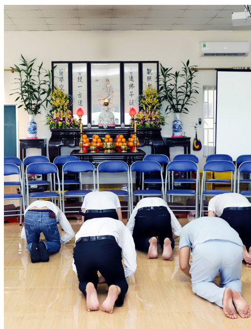
▲ 當地青年在覺醒後真誠修行。

除了各處的行腳，還有一個重頭戲是新道親法會，在一處其他道場的中堂舉辦，這裡清一色是年輕人，人數不多，他們的點傳師因故已經許久沒有來了，然而沒有點傳師的引導，卻還是自強不息。令後學印象最深刻的，是他們對點傳師的態度，都是90度鞠躬，開會的坐姿都是直挺挺的，如此認真的態度，配合洪點傳師的辦道度人，並沿襲著前人的精神風骨，承蒙上天加被，焉有不成之法會？而法會成功的要素，後學認為是全體的精氣神到位。後學看見這些新道親們對道的專注，和凝聚而成的磁場的力度，是台灣少見的。