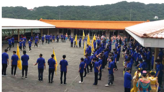
▲ 動唱表演團練一景。