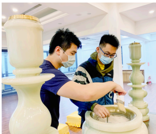
▲ 參訪萬里德光講堂，年輕一代自發整理中堂。

第二天印象最深的是點傳師們最常提到：「自己時間已經不多了，接下來是你們年輕人的時代。」這句話真的衝擊後學的內心，每每聽到這句話，內心真的是充滿悲傷。真的慚愧，活了 20 多年心中才開始有體悟，前人輩、點傳師們如此無私地奉獻自己的生命於道場，後學卻會因為一點點的疲倦就產生怠惰之心，看到許多與後學同輩的學長有如此的體認，後學真的該改變自己了！瑞周天惠單位如何發展，就在我們年輕人的手裡。