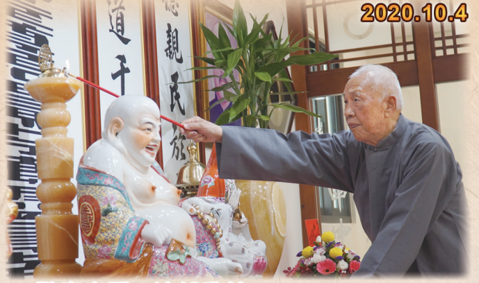
▲ 點亮光明，法船啟航。