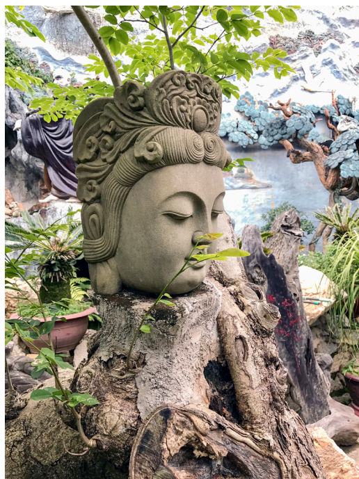
▲ 佛教傳入越南已好幾個世紀，影響當地人民深遠。

自然處處都是道的境教，帶著覺性走入古老皇城，看的早已與一般觀光客不同，從其中一位接近末代的皇帝的故事，感受那股喪權辱國的恥辱——皇帝曾在一條河邊，停下馬來，問了他的臣子：「手髒了要用水洗，國破家亡的恨要用什麼洗呢？用血洗！」看到這裡，後學想起清末中國被列強欺侮的慘狀，心中感慨萬千啊！