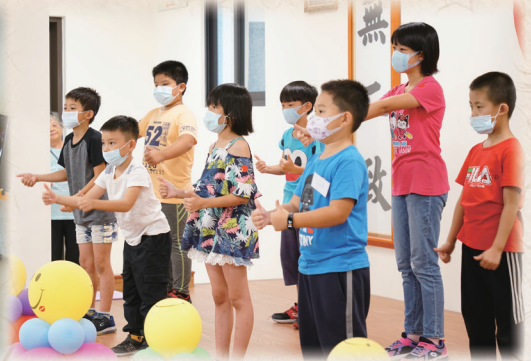
▲ 玉里讀經班小朋友精彩表演。