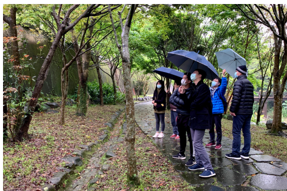
▲ 道法自然，自然就是道。

此次之行，一開始本以為是單純出外踏青，沒想到後來卻是心靈深層之旅。點傳師在第三天走完頂湖步道後問後學：「這三天是否過得很充實？」