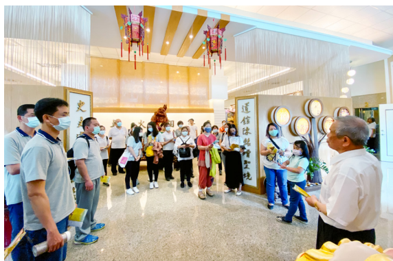
▲ 參訪天庭道院道史館，明瞭前人輩修辦歷程，發願真修實煉。

以前的後學說壞不太壞，說好也不太好，總是讓媽媽操心，功課不好好讀、學抽菸、喝酒、惹事、打架、自殺。感謝後學的媽媽一直沒有因為我這樣而埋怨上天，反而更加相信上天會撥轉因緣，讓後學回復到原來的自己。也在媽媽的努力下，讓後學有機會到宜蘭參加法會。後學希望有一天能夠跟洪點傳師一起去開荒，更希望在那之前，後學已經把自心的荒開好了。