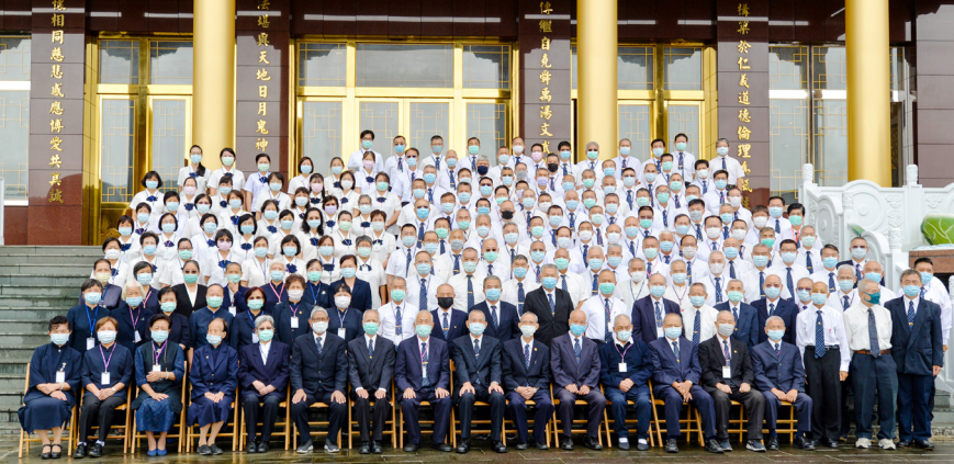
▲ 基礎忠恕第四期道務助理法會留影。