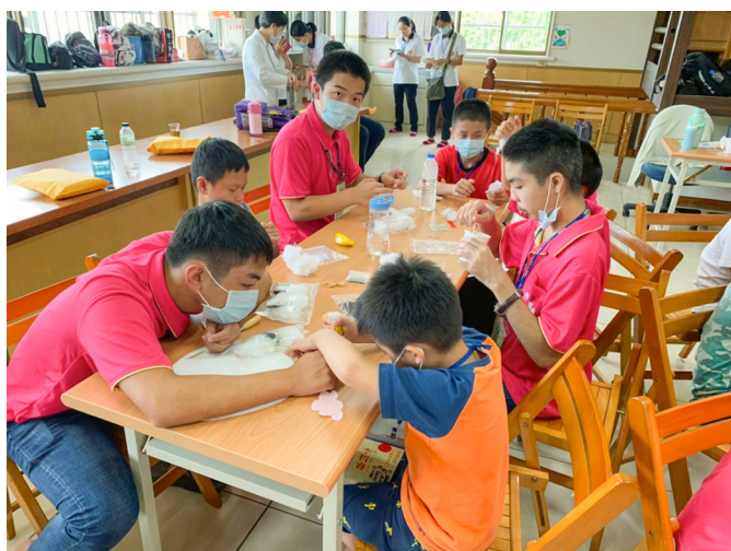
▲ 志工與小種子班學員製作雲朵香包。

的精心規畫，還有廚師爸爸和廚師媽媽等，是不可能圓滿成就這次的營隊，沒有你們更不可能有我們！很感恩有道場這個大家庭。