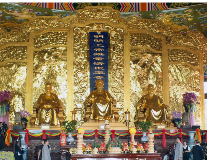
▲ 白陽聖廟供奉著白陽三聖——老祖師、師尊、師母金身聖像。

讚頌〉，震人心扉的歌曲，磅礴上雲天；接著引導旗列隊先行，各道場領導前人們恭敬齊步登上 108 級階梯後，進行一貫道祖師紀念館大門啟扉，以及白陽聖廟三聖及各道場來臺開荒前人們聖像揭紗儀式。