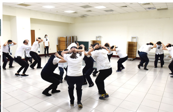
▲ 青年大會師輔導研習營進行闖關體驗活動。