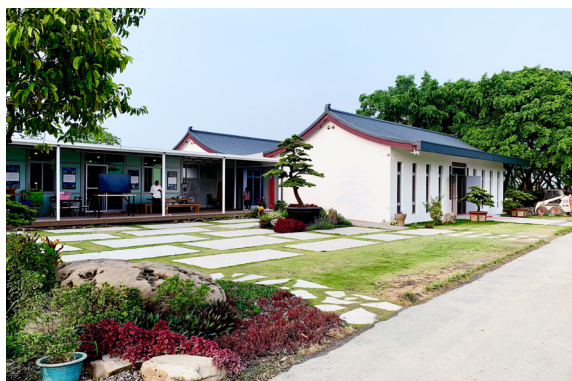
▲ 天一聖道院中堂外的庭園。