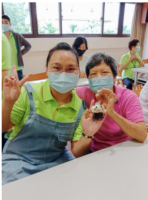
▲ 志工和長青菩薩一起完成雲朵香包。