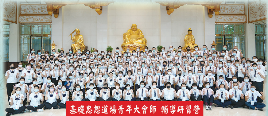
基礎忠恕道場青年大會師 輔導研習營