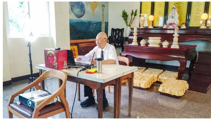
▲ 黃總領導點傳師慈悲勉勵東國開荒眾人。

我們的德行要用這三項來培養。今天如果捨棄了「慈悲」，能夠有勇氣嗎？如果捨棄了物質、精神、語言上的「儉約」，這樣可以擴大推廣嗎？如果沒有「不敢為天下先」的「謙讓」精神，那不是人人都爭先恐後了嗎？若這樣，不論做什麼事情都是行不通的。所以說，「慈悲」很重要，以慈愛之心處理爭端，最後才能獲得勝利，因為進可以攻，退可以守而固之。上天要救助的，是固守「三寶」，同時以「慈悲」來維護一切的人。