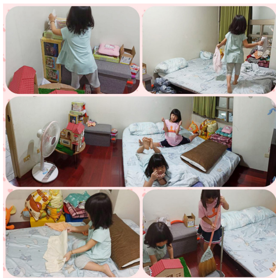
▲ 小朋友在家協助各種家事。

過不斷地溝通、協調，互相了解彼此的看法，找到最適合的方式，然後勇往直前，因為前輩們都是我們最大的肩膀。第二件事是「成全不能停」，當疫情來的那麼突然，若我們還在固守成規，覺得讀經班只有一種方式，這樣我們是不會進步的，反而令苦心經營好幾年而能穩定參班的家長及孩子，可能就此消失。