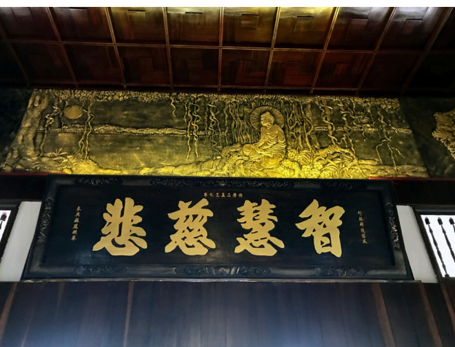
▲ 竹林禪院牆上佛教故事雕刻與匾額。

得不好，大家都是在懺悔自己，在講自己的體悟、愿力和不足……。這樣正能量的循環，再加上點傳師每一次都能抓住核心，詢問每個參與者：身為修行人，辦道應有的態度等觀念。這些深入的反思，都會讓自己被重重地敲醒。