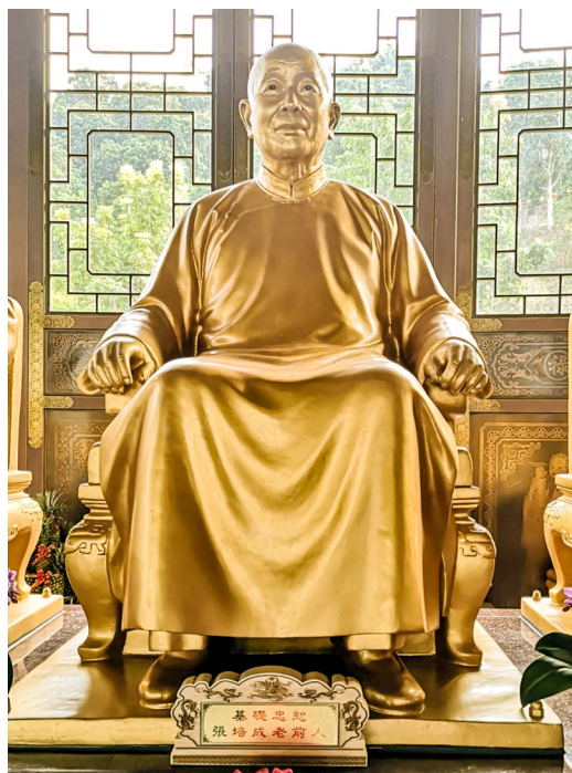
▲ 張培成老前人聖像。