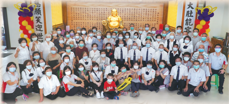
▲ 於一樓彌勒祖師聖像前合影。