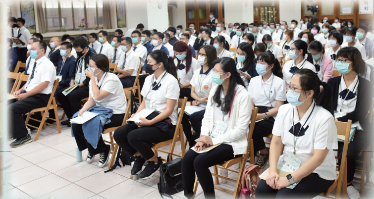
▲ 各單位輔導幹部為青年大會師集結準備。