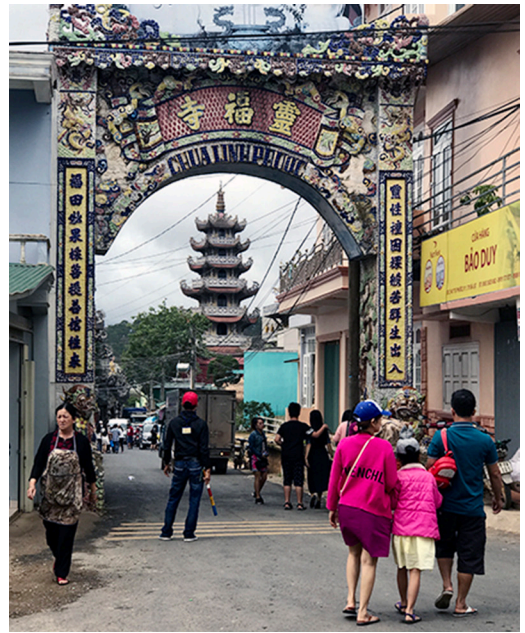
▲ 遊覽各地了解其中故事。

旅程中的一個插曲，至今仍津津樂道。我們當時在鄉下，因為一些原因和公安人員打交道，這是我人生第一次！如今回想起來真的是相當特別的經驗。當時的我可謂「初生之犢」啊！事後想起來，實在是上天慈悲，有許多細節似乎都剛好安排好，好在過程真的是有驚無險。聽說之前點傳師也遇過，這也讓後學十分佩服，想