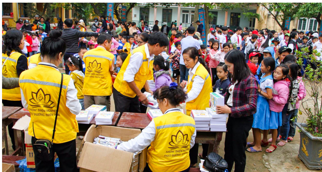
▲ 上圖，鄉親等待領取救災物資。下圖，到學校贈送物資給小朋友。