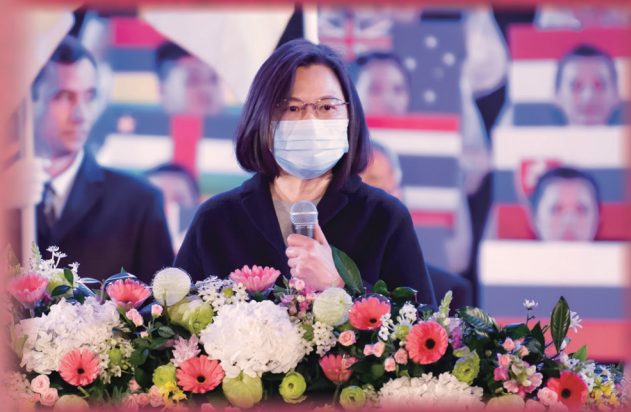
▲ 蔡英文總統蒞臨致賀詞。