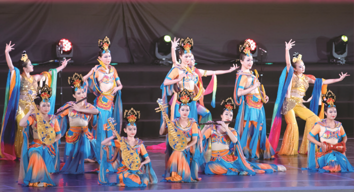
▲ 香音飛天，舞姿翩翩。