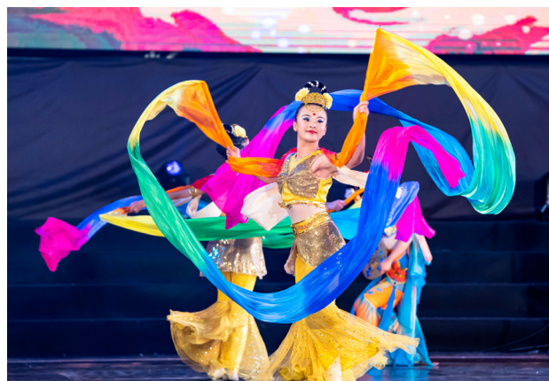
▲ 飛天繞梁，象徵祝福與敬意。

我們都是因為「道」而相親相惜，都是因為「道」而互助扶持，這是上天的巧妙安排，在因緣聚合時，我們共同承擔使命；不論我們來自哪裡，今日相聚在一起，共修共辦，這都不是一個偶然。一起登上濟世法船，航向亙古盤今的永恆方向，不論風雨如何變幻，白陽舞台在我們的腳下，這