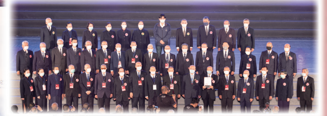
▲ 頒獎感謝各道場參與節目表演。