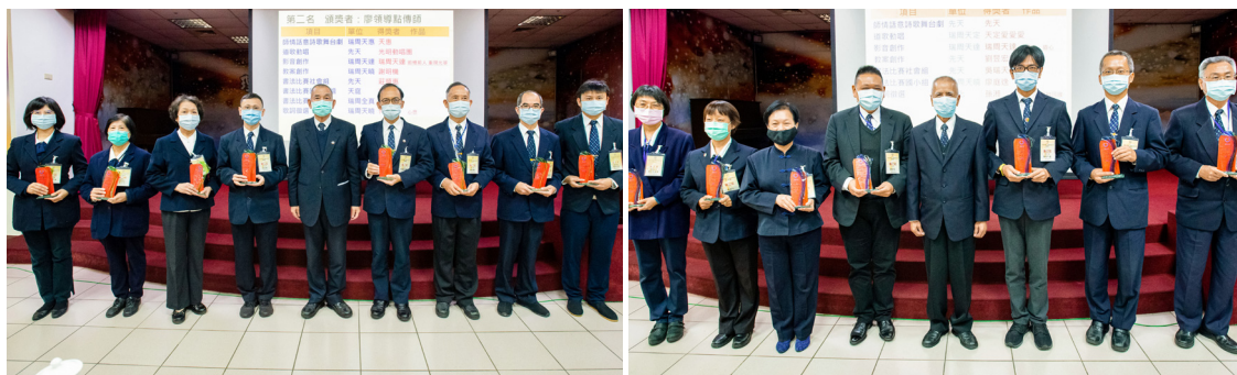
▲ 老前人成道十週年暨袁前人成道五週年感恩追思大會各佈局活動第二名（左）、第三名（右）獲獎者。