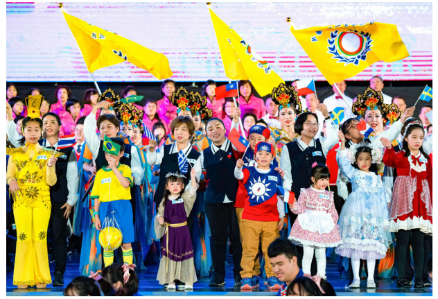
▲ 揮舞旗幟，代表道傳九州，慧命承續。

暑假開始招生成團，展開次次嚴格的訓練。從一開始的魔鬼集訓，到舞台上的優雅呈現，更是無人缺席，每一位團員克服自己的不方便，次次配合團體行動，在每一回都看得到每一位的成長與感動，您們心靈的美讓