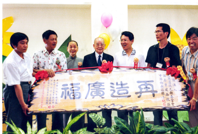
▲ 致力社會公益，救助 921 震災重建，獲贈匾額。

大德陳茫前人生前每次為後學們賜導開示，總會提起您的行誼風範。在民國 50 幾年（1960 年代），那時候全真道院尚未建立，有位年輕人來道場，不認識大德周前人您，當時他