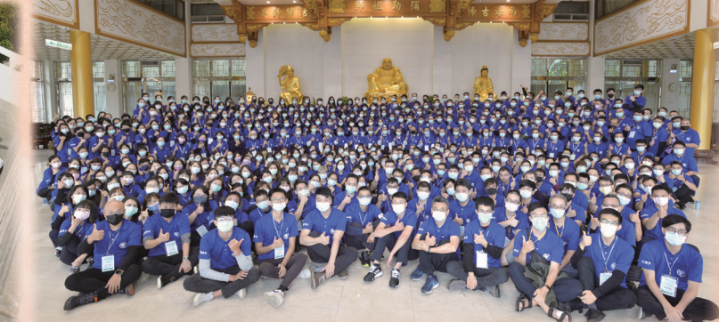
▲ 北部場於基礎忠恕道院祖師殿留影。