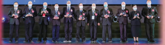
▲ 頒贈自陽聖廟護持奉獻獎。