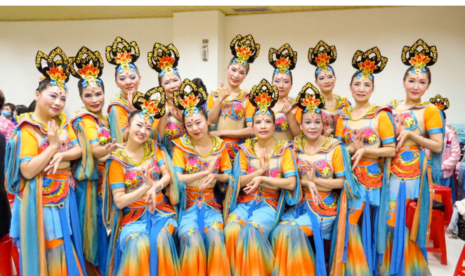
▲ 在辛勤的演練下，帶來美麗舞姿。

幕落下，仙女也要回到凡間煩惱柴米油鹽醬醋茶，我們將煩惱收心回歸原點，深刻知曉傳道 90 年真的不容易，延續下去是我們一貫道弟子的責任，一如〈彌勒之光〉歌詞中說：