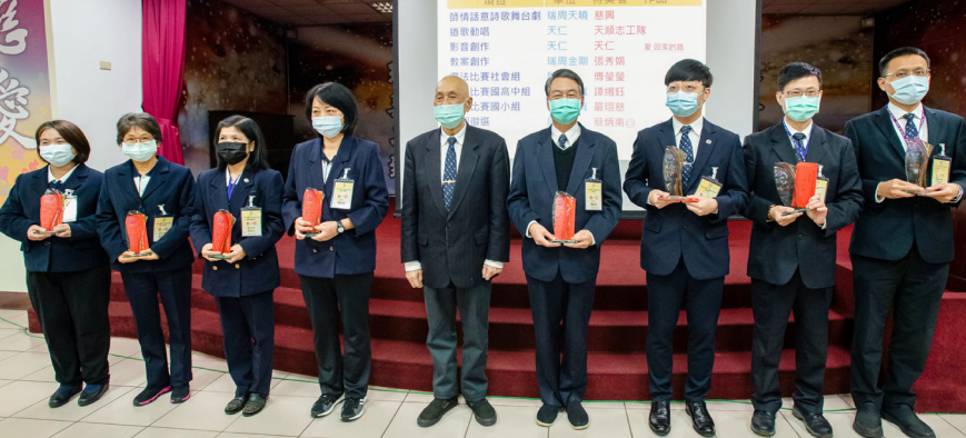
▲ 老前人成道十週年暨老前人成道五週年感恩追思大會各佈局活動第一名獲獎者。