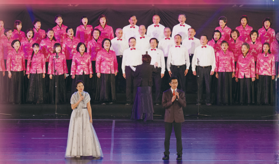
▲ 彌勒之光，攜手共創人間天堂。