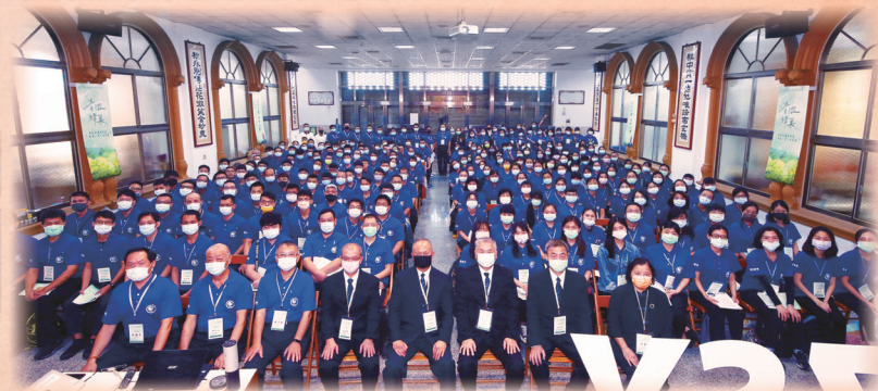
▲ 中南部場於台中光輝道院內合影。