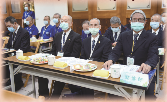
▲ 領導點傳師與點傳師們慈悲護持。