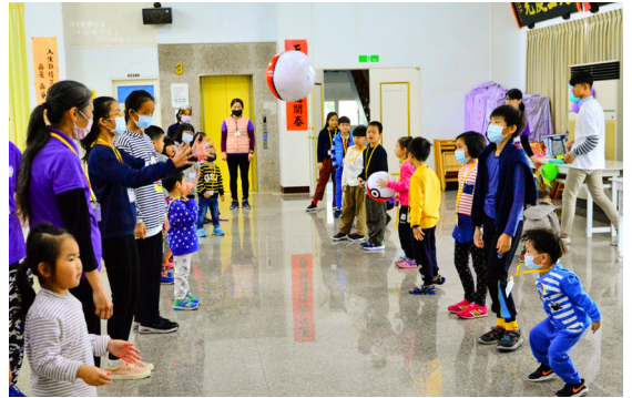
▲ 小朋友的課程非常活潑有趣。

學習能以歡喜心做事，以感恩心做人；凡是具有正能量、有眼光的人，會給我們一個全新的訊息，或許就改寫了自己的人生，當我們對自己所擁有的一切懷著感恩，就能夠理解「煩惱是幸福的」！因為，在絕處逢生、在心志磨煉中，能夠讓我們在困境時重燃信心，得以成長、得以精進，所