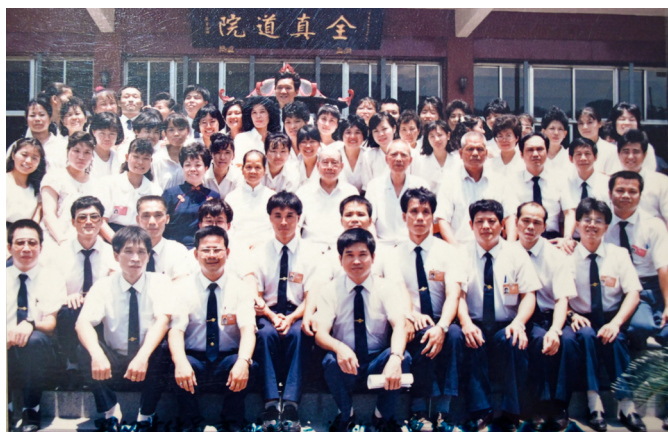
▲ 全真道院進德修業辦事人員班第二期結業合照。

《史記·列傳·李斯列傳》：「是以太山不讓土壤，故能成其大；河海不擇細流，故能就其深。」海之所以深遠，乃在於低於地表的空間，足以承接千江萬水，亦能涵蘊眾寶；心若能寬廣，就能包容一切人事物的善與惡、美與醜……，無對待分別之心，故有言：「方寸之心，如海之納百川也，言其包含廣也。」每一滴水的聚集，成就了遼闊的大海；每一件人事物的發生，匯集包容，成就無上的正等正覺妙法。修行的成就，就在一念