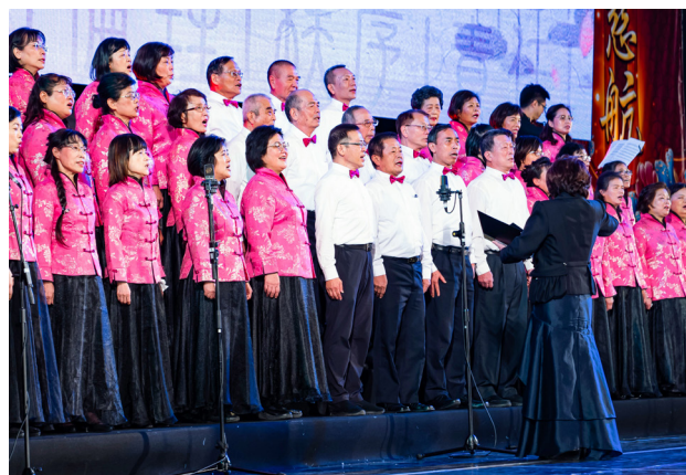
▲ 合唱團唱出美妙旋律。

朵等待引度娑婆眾生，期待故家還。偈云：「心如工畫師，能畫諸世間，五蘊悉從生，無法而不造。」心能生萬法、能創造一切，為什麼只知用有形之美，來妝點這世間的一切，卻不用我們內心的美去優化這個世界，創造人間淨土呢？豈不知成佛之路就在眼前，而迷昧眾生總不見；諸天仙佛滿懷慈心柔情，祖師悲愿聲聲喚起，十方志士急急護持，只因天時緊急。