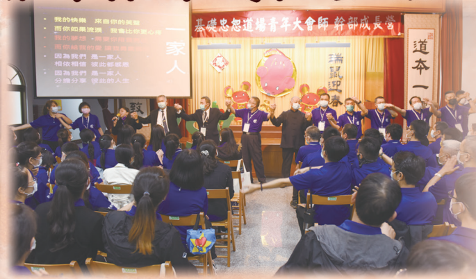
▲ 點傳師與道務助理們帶動歌唱。