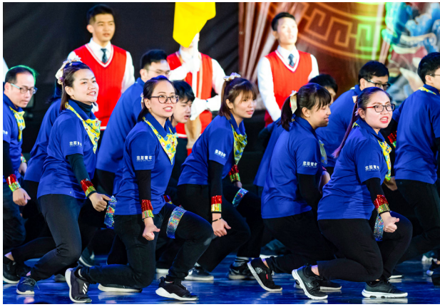
▲ 以動唱呈現青年飛揚活力。

出優質默契，只要一個說明、一個要求，大家都能夠配合團體的運作，表現青年學子無比的創造力與活力。