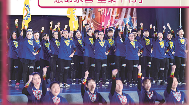
▲ 一貫飛揚，忠恕青年活力啟航。