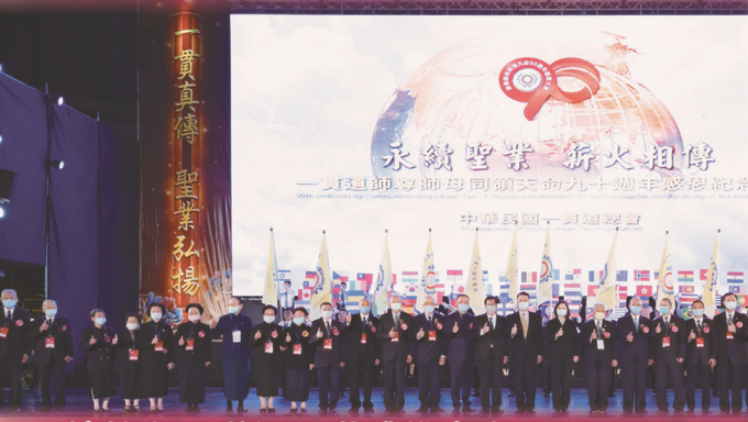
▲ 總統與各道場領導或代表合影。