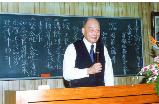
▲ 基礎先天整合定點班貫徹班務整合法會，周前人慈悲賜導。

時，也常再三叮嚀：「來聽班，要用在日常生活中，坤道在家有秩序，對公婆有倫理，對子女負責任；盡到奉獻己力，無為而為之，就會家庭圓滿。」……，太多太多的慈勉。後學永懷周前人德澤，盡己之心，盡職守責，領恩學習，聽命辦事。感恩周前人慈悲！