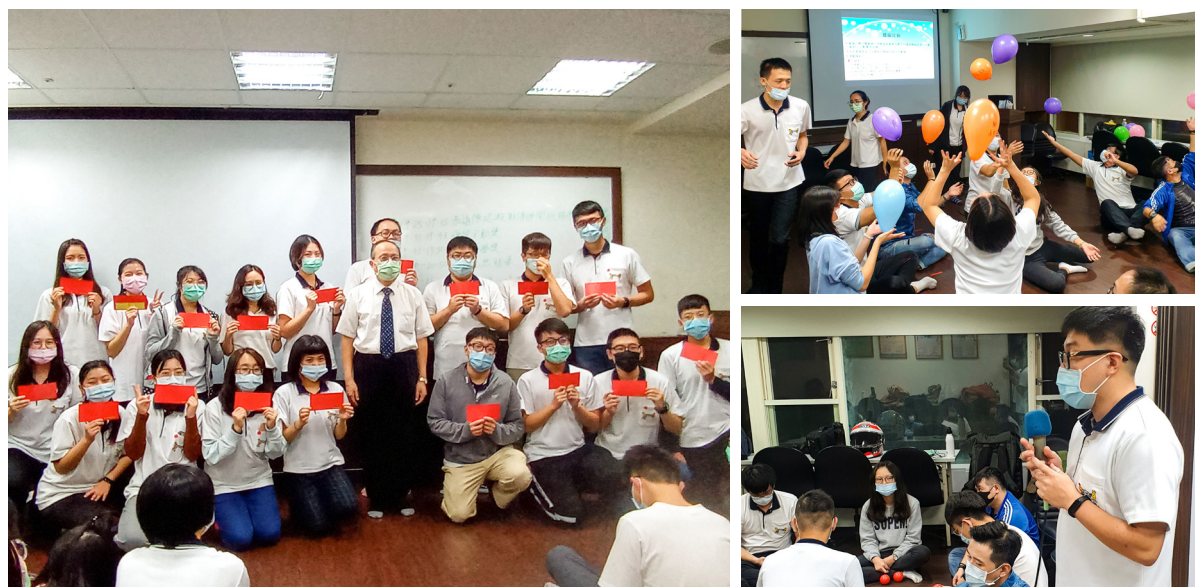
▲ 忠恕學院學界班期末活動照片集錦。

在此後學也想感謝幾位講師的幫助，才讓後學能在道場走那麼久。曾經一度想放棄，也是由於講師們的拉拔，後學才能走到現在；即便後學有再多的問題，他們總是能替後學解答，雖然有時候不是後學要的，但是後學還是很感謝他們耐心地解釋，才讓後學不斷地成長。