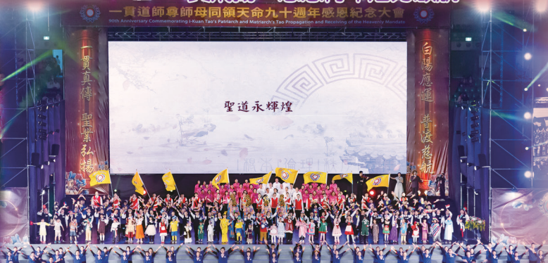
繼往開來，聖道永輝煌。▶