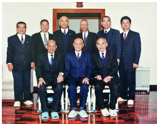
▲ 與老前人、袁前人合照。

班上課時問大家：「你們是不想吃肉？還是不敢吃肉？」當時後學們不明瞭前人您的教導用意，心中只覺得都在修道了，當然是不想吃肉啊！但是在前人您的開示下才明白，原來當下的不想吃肉，有可能在哪天改變主意想吃肉了，那該怎麼辦？前人您慈悲地說：「我們唯有不敢食眾生肉，才是修道守仁持戒的第一步啊！」前人您為了讓眾生能夠解脫六道輪迴之苦，以無量心、無量行來教化學道者，修辦道要抱定正確方向，使之德業日進、日日求新、明理來修辦道，讓眾生都能走向回天的光明之路，前人您一生當中皆以大仁、大愛之心為準則。