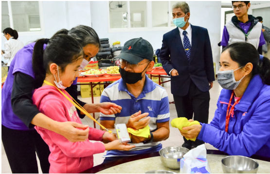
▲ 小朋友恭敬遞毛巾給家長。