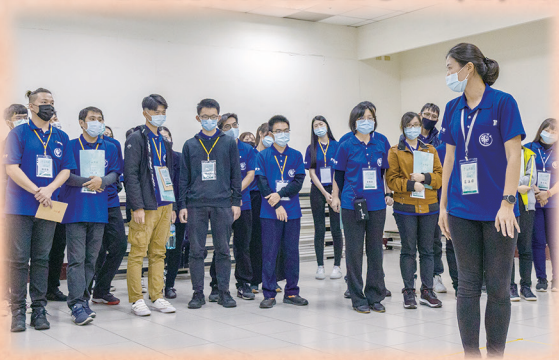
老前人五心級分站課程—「精進心」。 ▲ 北部場 ▼ 中南部場