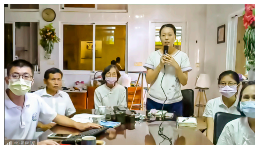
▲ 各單位報告現況與反應問題。