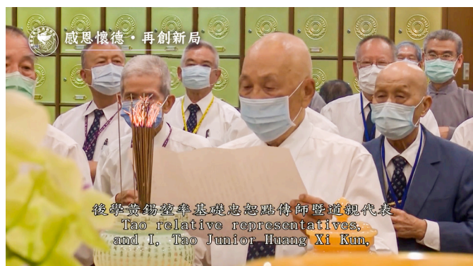
▲ 黃總領導點傳師代表於5月9日在先天寶塔敬奠。

處處都是困難，加上二二八事件的危機險境，可說是立足艱難；也就是這樣的困境，更練就出老人家對道的心志與堅定，因為道是天人合辦，有發心的善愿，上天自然會暗中來助道。