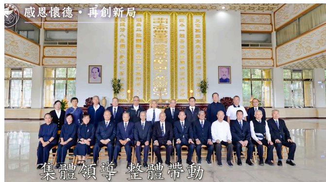
▲ 集體領導，整體帶動，愿力再起，開創新機。

為感恩與追思老前人與袁前人德澤，基礎忠恕道務中心於大會前籌畫了多項佈局活動，包括道歌動唱、詩歌舞台劇、教案創作、書法、影音創作、開創新局歌詞創作等比賽，各單位參與熱烈，除了透過不同形式感念並呈現兩位老人家的德行，也發揮創造力，並凝聚向心力，尤其讓年輕一代的道親們發揮所長，共同參與，也象徵著永續傳承的意涵。各項比賽或