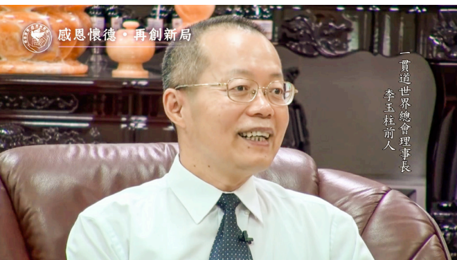
▲ 播放一貫道世界總會理事長李玉柱前人行誼的片段。

藉由各道場公開講道、講經典，讓大眾有機會更了解一貫道；輔以一幕幕多元化的活動相片，也顯現當時各道場努力透過各種形式與社會對話，才終能達到師母的交代，讓一貫道在台灣得以合法傳道，並陸續成立了中華民國一貫道總會及一貫道世界總會。