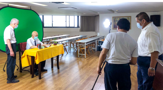
▲ 黃總領導點傳師透過錄影方式慈悲賜導。