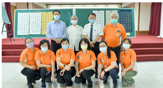
▲ 孝思書法比賽評比。