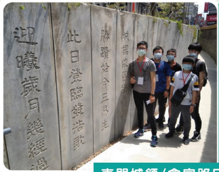
東門城隍/食字路口/字句拍照