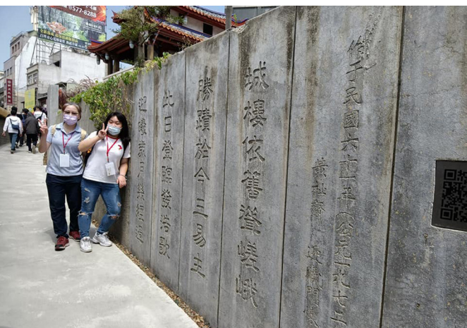
▲ 在城市中依據線索找到景點。