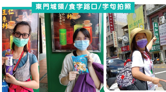
▲ 在城市中找到相關字句拍照。

一大早就有諸多未知的關卡等著大家，如同人生的旅途上，一切都是未知的，等待去探險。晚會一開始，兩位講師用戲劇的方式讓人去反思：我們常常都說很忙，那到底是在忙什麼？是在做該做的或是有意義的事情嗎？還是只是漫無目的地去消遣、揮霍時間？當真正去計算屬於自己可以安排規劃的時間，才發現原來是少之又少，而這些時間又該怎樣去運用才能發揮它的價值？