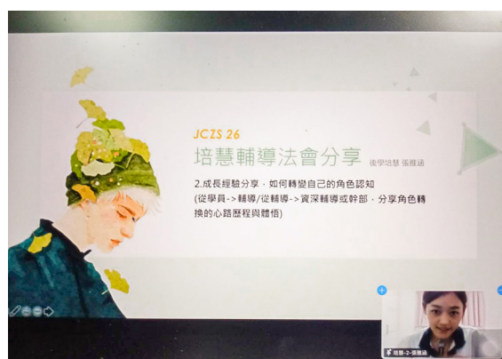
▲ 資深輔導學長分享角色轉換的歷程和體悟。

在「做中學，學中做」的過程，磨練班務運作、課程與活動設計、輔導等技能外，每個人都是一片公心地為了道場而付出，不是為了自己而是為了眾生，當這樣的起心動念產生群