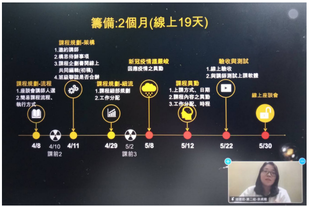
▲ 發揮創意將課程改為線上模式的實務分享。