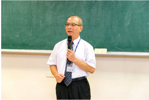
▲ 陳點傳師分享用辦道帶動道務的經驗。

讀經班的經營方式，每年一定招生兩次，過年後一次，暑假夏令營後到九月又一次，這是不變的原則。為什麼要兩次？不管我們班人多或人少，就是要招生，要讓讀經班的家長，這個資源、這個活水源頭源源不絕地存在，然後可以成全他們求道、未來進入道場參加班程，變成道親。