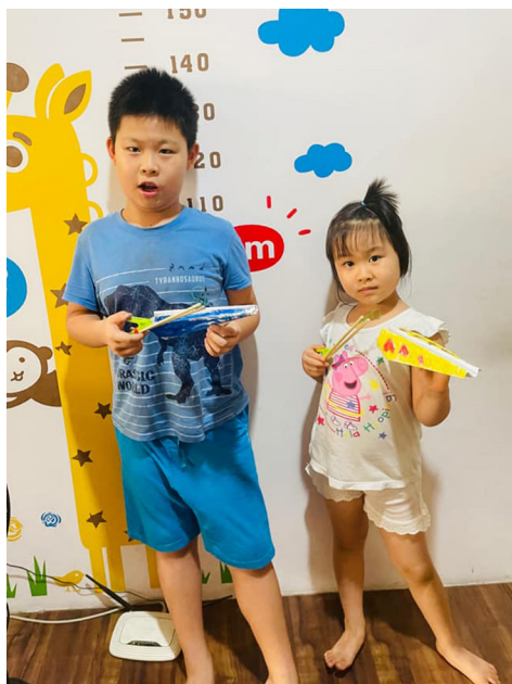
▲ 兄妹展示飛機發射器作品。

在這次的活動中，後學汲取了許多寶貴經驗，像是訓練口才、上台勇氣，更重要的是懂得如何去教導幼小的孩子。以前在看老師教人的時候感覺都很輕鬆，結果自己實際去教別人的時候才知道很困難。好的線上教學不但要擁有好口才與十足的勇氣，還要透過排練來學習處理各種突發狀況，這真的很不容易。如果下次還有機會的話，後學一定會再來服務、學習的。