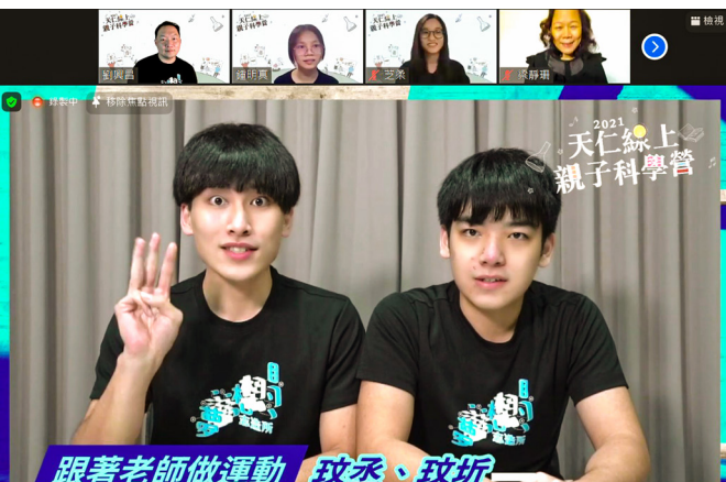
▲ 活潑的大哥哥們帶著孩子做各種運動。

這次課程以「科學家故事暨搶答活動」做為起手式，故事內容活潑有趣，並搭配搶答，讓孩子們聽得入迷也玩得盡興。接著「跟著老師動一動」單元，邀請活潑的大哥哥們帶著孩子做各種運動，有動唱，也有熱門的有氧運動等。有一位家長回饋寫到：「跟著老師動一動這一段，小孩根本動到為之瘋狂！」最後是「科學玩具製作」，在大姊姊們悉心引導下，孩子們都動手做出屬於自己獨一無二的科學玩具！像是有一位家長在FB留言寫下：「孩子的夢想起飛了！謝謝天仁志工隊，帶給孩子們愉悅的科學玩具體驗！」活動結束前，孩子們將今天所學紀錄成科學繪圖與心情故事作為學習總結。