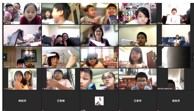
▲ 孩子們快樂參與親子科學營。

後學跟弟弟這次準備的是「跟著老師做運動」這個單元。原本要現場直播，但彩排時就漏了一些開場的介紹，甚至會忘記後續的一些動作，所以我們最後採用預錄的方式；如此一