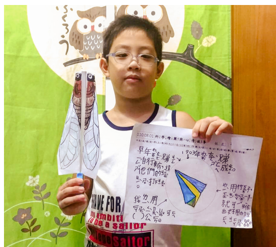
▲ 課中認真製作的蟬造型發射器與學習單。

儘管新冠病毒疫情當前，大家都只能在網路世界中相見，但後學在這兩梯次的營隊裡卻擁有了貨真價實的實質收穫。