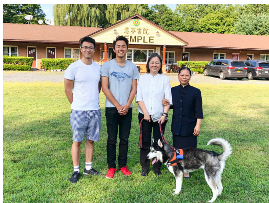
▲ 參加友壇法會後，與發一奉天道場點傳師合影留念。

最後，感謝 天恩師德、濟公老師的慈悲撥轉，讓件件驚險的事都能夠有驚無險。我們何其有幸能夠得到上天的庇護。