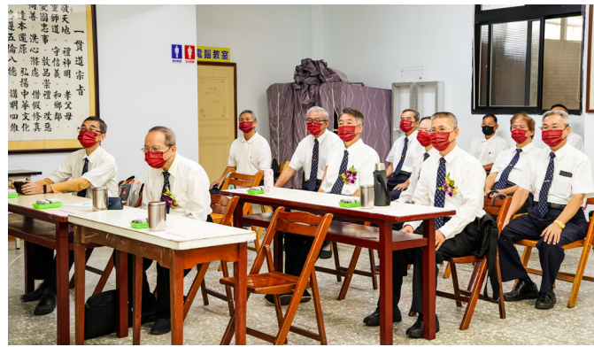
▲ 配合防疫措施，在新民教室觀賞活動。

接續播放匯集啟化講堂歷史照片剪輯而成的「走過三十年」影片。啟化講堂從原始的關帝廟，建設成現在的四層樓建築；一張張珍貴的照片，老前人、前人、點傳師、前賢大德的