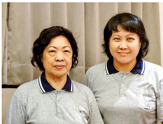
▲ 母女不懼考驗，終能安設中堂。

平時吃飯不太方便，於是中午幫她帶便當，持續超過半年以上的時間，只為了成全她去中堂聽課，這讓媽媽有了再次接近道場的機會。