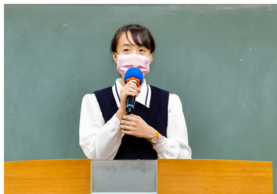
▲ 作者上台分享學習心得。

再來，每個禮拜我們會學習一篇〈濟公活佛慈語〉，大家會一起互相討論心得，來反思自己遇到困難的時候，是不是一樣能夠做到感恩？是否能夠化解煩惱？看看我們讓自己散發出來的是祥和之氣、浩然正氣？還是頹靡不振、意志消沉，然後退縮不前呢？