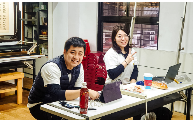
▲ 感謝輔導學長們大力支持與帶動。

第二個，因為第一次擔任課程主持人，所以有諸多的徬徨與不安，深怕自己帶給學員的觀念與想法不夠正確與明確；但經過與輔導學長們的討論與練習，到真正上場後，發現一切擔心都是多餘的，因為唯有放下那些擔心，才能表現出最佳的自己，將自己最真誠的一面表現出來。