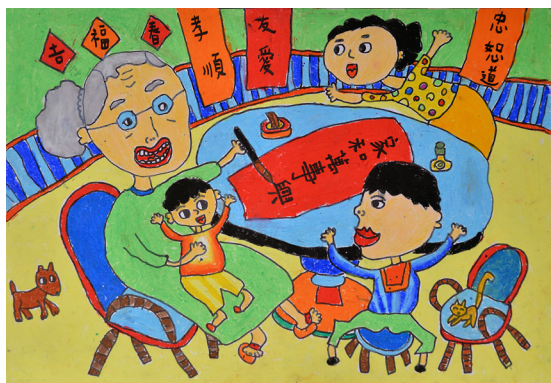
▲ 透過畫作傳達友愛兄弟姊妹及親子間慈愛互動。

呈現在疫情中不忘關心爺爺、奶奶的身體健康，童真的心透過繽紛色彩繪出活潑快樂的氣氛，也體現出孝在日常、幸福同行。