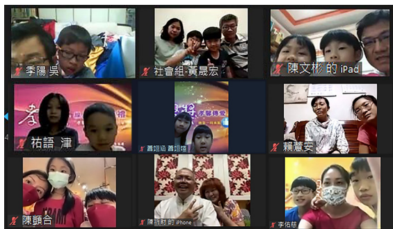
▲ 2022 孝馨獎頒獎採線上辦理，傳遞愛的幸福行。

傳遞暖心的愛，就是孝悌傳家。一個家裡有了愛，這個家是和樂融融的；有了愛，這個家是美滿幸福的。希望大家把這一份力量、這份愛、這份孝心傳遍整個社區、社會、國家、宇宙，能夠成功圓滿自己。」