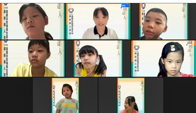
▲ 評鑑老師（上方中間）溫柔地鼓勵大家。

另外，我們安排孩子在線上複習時帶大家一起讀經典，每位帶讀的小老師都很認真看待這個重要的任務，在事前會先練習許多遍，讓聲音、速度和流暢度都能符合要求。在幾次複習課程後，孩子多背了好幾部經典，對讀經達人認證也更增信心，主動要求增加認證科目。在最後幾次的複習課程中，我們也盡量模擬認證的過程，希望讓孩子能熟悉應考方式而不怯場。