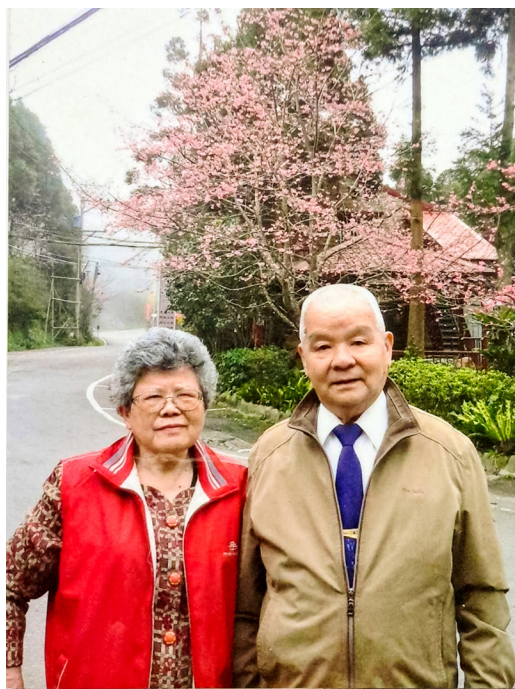
▲ 周點傳師與夫人合影留念。