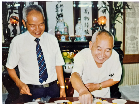
▲ 袁前人與周點傳師合影。