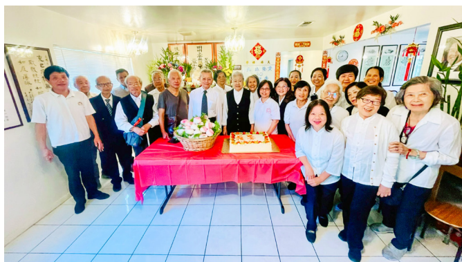
▲ 感恩點傳師與道親蒞臨天緣中堂 30 週年堂慶。

陸點傳師慈悲賜導：「非常高興能夠參與天緣中堂 30 週年慶。今日見到中堂人才濟濟，道親們和善親切、