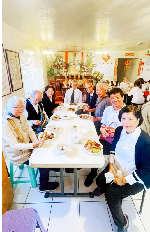
▲ 天緣中堂歡迎大家前來以誠心花果敬佛。

感恩。願以此文表達後學一家最深的敬意與懷念，感恩他們曾經帶給我們的溫暖與成全，這份恩情將永遠珍藏於心。