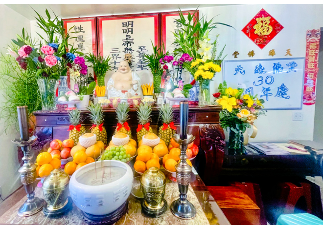
▲ 天緣中堂迎 30 週年，愿繼往開來創輝煌。

親朋好友參班之後，不但能禮佛求道、接受佛光普照、聆聽道理、學習佛規禮節，更能品嚐美味素食，可謂身心靈皆獲滋養，滿載而歸。