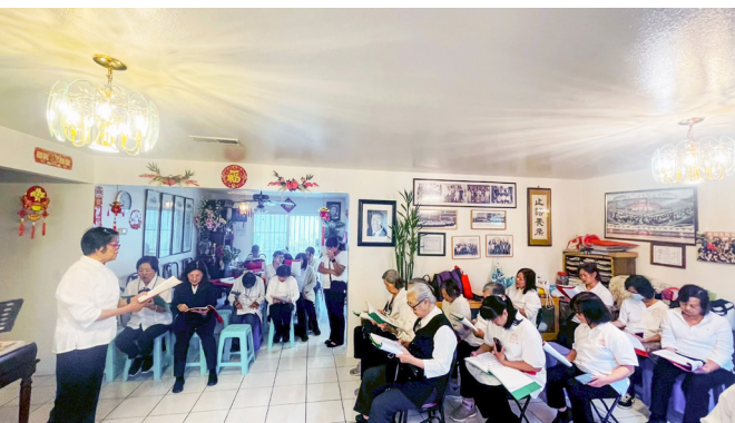
▲ 天緣中堂定期提供安定身心、寄託信仰的道場予更多有緣眾生得聞大道、求得三寶。