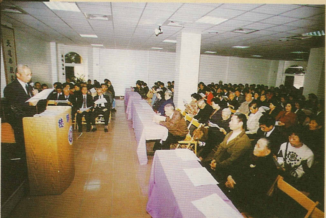
▷ 慈光福位辦法說明會。