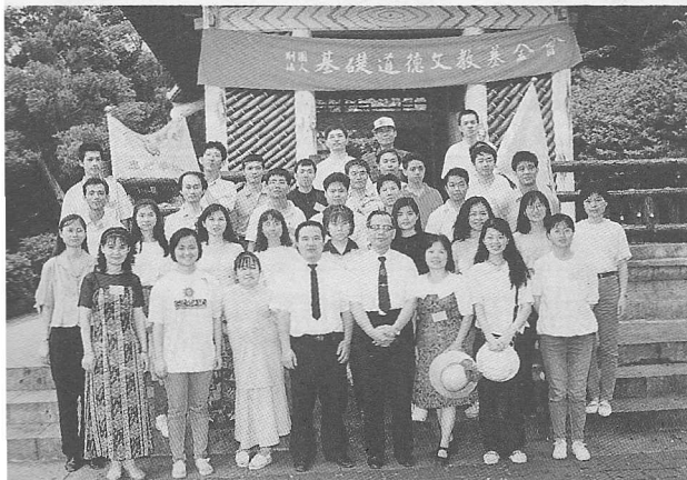
△跨出青年壯闊步伐！