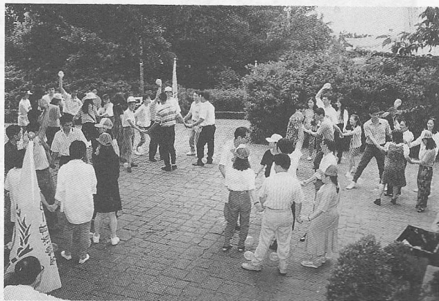
△團康活動，拉近彼此的心。