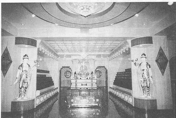
△先天靈塔一樓祭拜大廳。