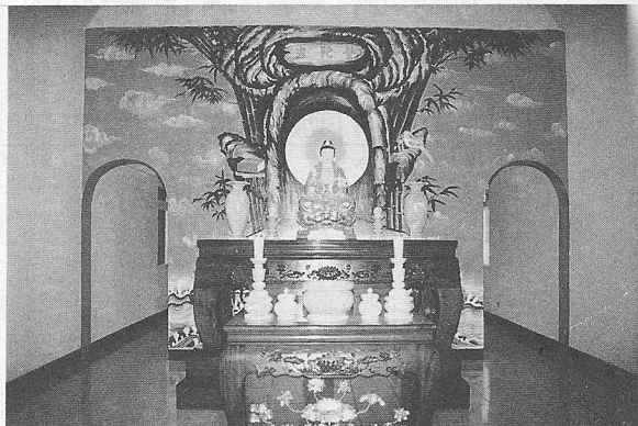
△先天靈塔八樓為供奉南海古佛。