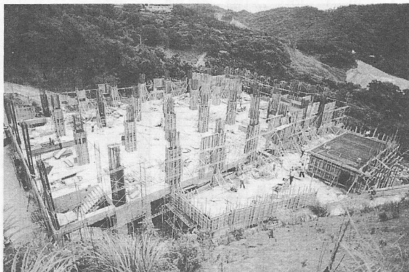
△主體大樓已向第五層進行樑柱、牆面施工；兩側各四層的衛浴及大廚房結構已完成，於廚房頂樓設約十坪的機房並安裝發電機。